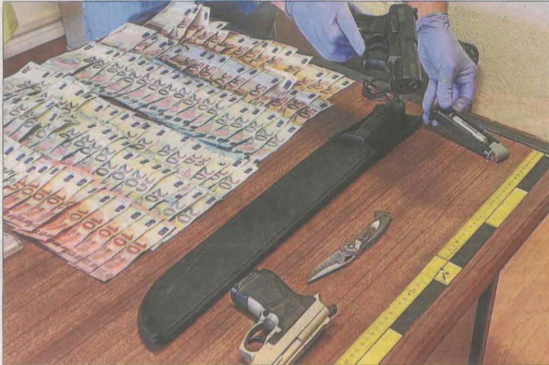
Imatge de les dos pistoles simulades, el matxet, la navalla i els 2.700 euros de botí.

Els fets van tenir lloc cap a les 23.00 hores del dia 5 de maig quan el 062 de la Guàrdia Civil d'Osca va rebre l'avis que podria es podria estar cometent un robatori en un bar de Binèfar. Una patrulla de Seguretat Ciutadana de la Guàrdia Civil de la localitat hi va acudir ràpidament. Després d'accedir a l'interior, van observar quatre homes amb passamuntanyes, gorres i mocadors, armats amb dos pistoles, que es va compro-