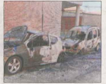
Dos dels cotxes calcinats.