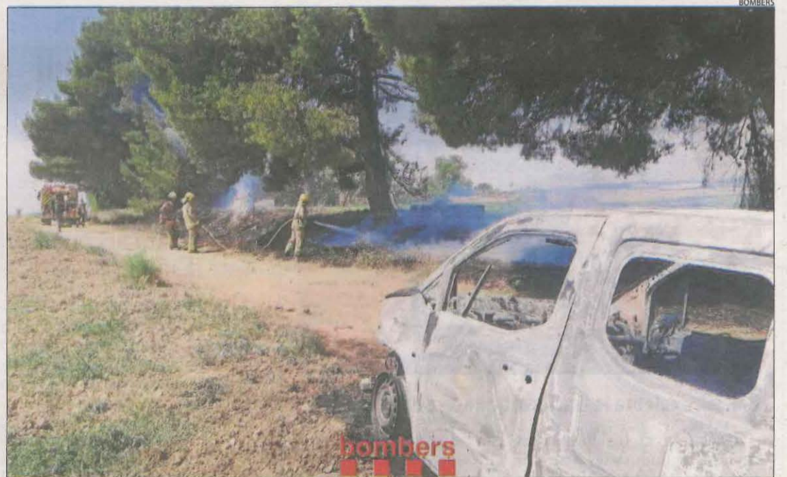
Imatge de l'incendi de Gimènells que va cremar una furgoneta i vegetació.

tindran en els propers dies. Els Bombers de la Generalitat van treballar ahir en l'extinció d'incendis a Guissona, Gimènells, l'Espluga Calba i la partida Mariola de Lleida.