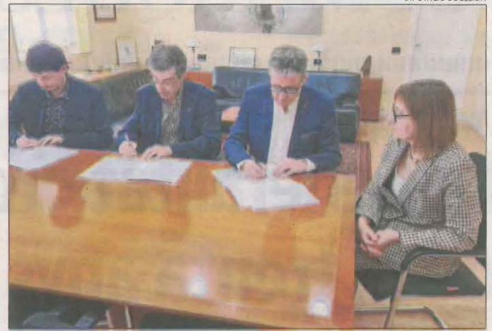
Imatge de la firma del conveni per formar secretaris.