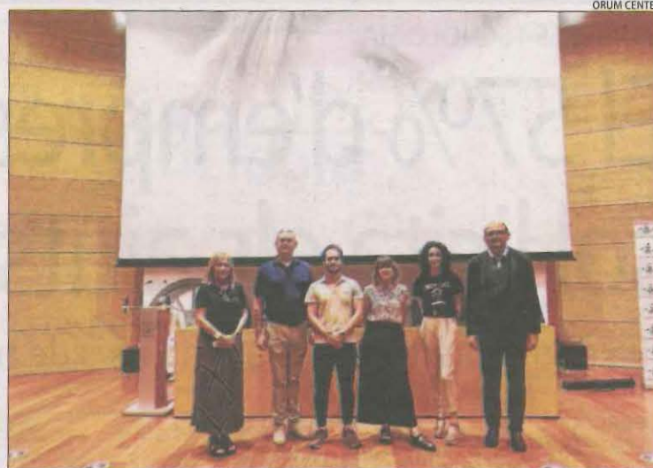
L'acte es va celebrar a l'edifici de la Biblioteca de la UdL.

encertar la identitat". També va donar eines a famílies i terapeutes per ajudar els nens i joves a educar-se en aquest concepte i ajudar-los a expressar allò que senten que són així com a fer la transició d'un gènere a un altre si així ho desitgen i a expressar-ho públicament.