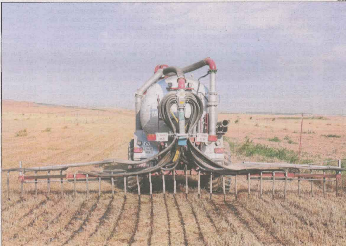
Imatge d'arxiu d'una cisterna aplicant purins a nivell de terra.

Per a la resta de dejeccions animals, la distància mínima és menor, d'entre 50 i 200 metres. La reforma que planteja la Generalitat vetarà purins a menys de 200 metres de nuclis de població, d'acord amb un decret estatal de l'any 2020. La separació mínima respecte a cases aïllades serà bastant menor, d'entre 25 i 75 metres.