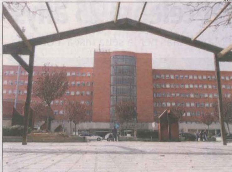
L'empleat va ser traslladat a l'Arnau de Vilanova, on va morir.

Des de l'empresa van afirmar que "ha estat un accident totalment fortuït, el fort vent ha arrancat una porta amb la mala fortuna que ha caigut so-