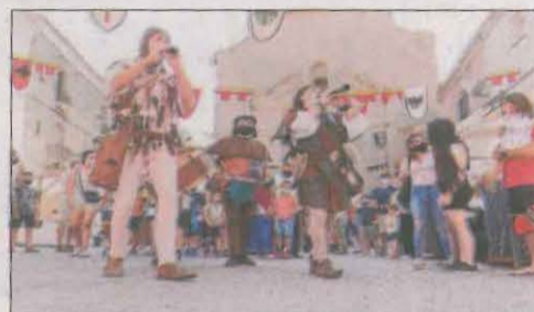
La Cremallera Teatre i Improvistos posaran caliu musical.

A més, tindrà l'ocasió de visitar els banys jueus o endinsar-se en el carrer de les Bruixes o Los Suburbis de la Quinta Forca. L'esperen exposicions de Nancy i antiguitats, pessebres o jocs de fusta així com escacs o bitlles. I altres equipaments com els museus Casa Tonot i Casa Jan. La Cremallera i Improvistos s'encarregaran d'acomiar el mercat.