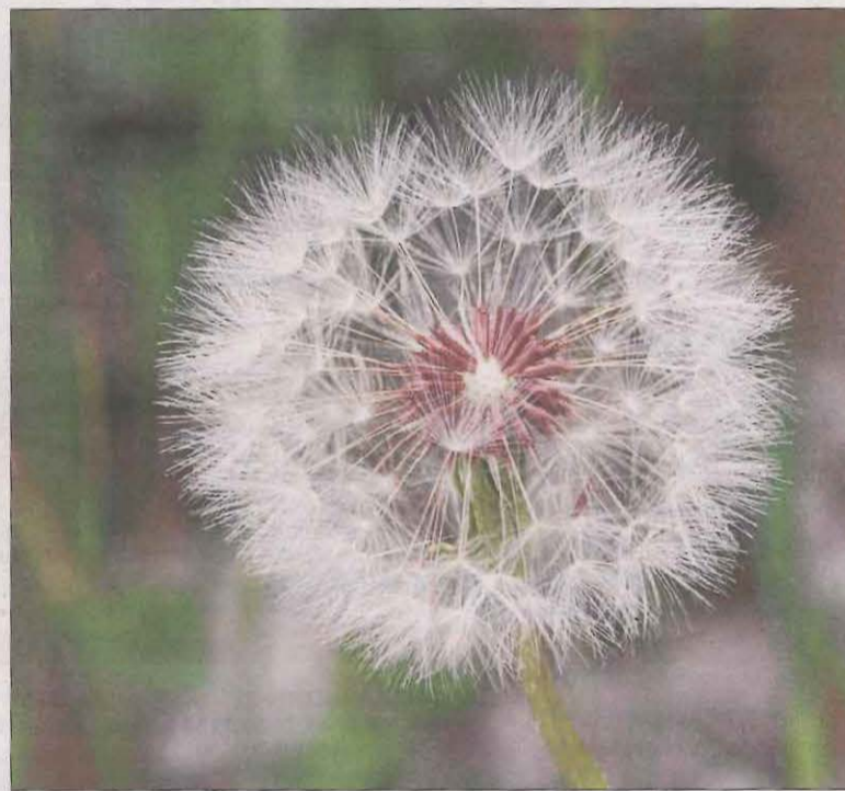
Lletsó oleraci. Espectacular foto de @DomenecLlop d'un lletsó o xenixell, planta comuna al Bages. Ja se sap la dita: l'agafes, bufes i demanes un desig.

Envia'ns la teua foto més artística etiquetant-la a l'Instagram de SEGRE (@segrediari) amb #cerclelectura.