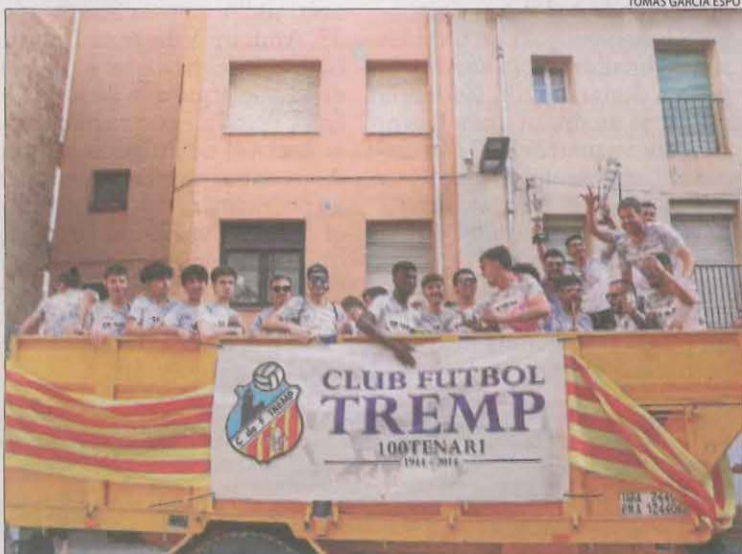
La plantilla del Tremp, celebrant l'ascens per tota la ciutat.