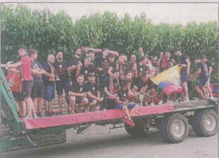
La plantilla del Coll de Nargó, ahir durant la rua.