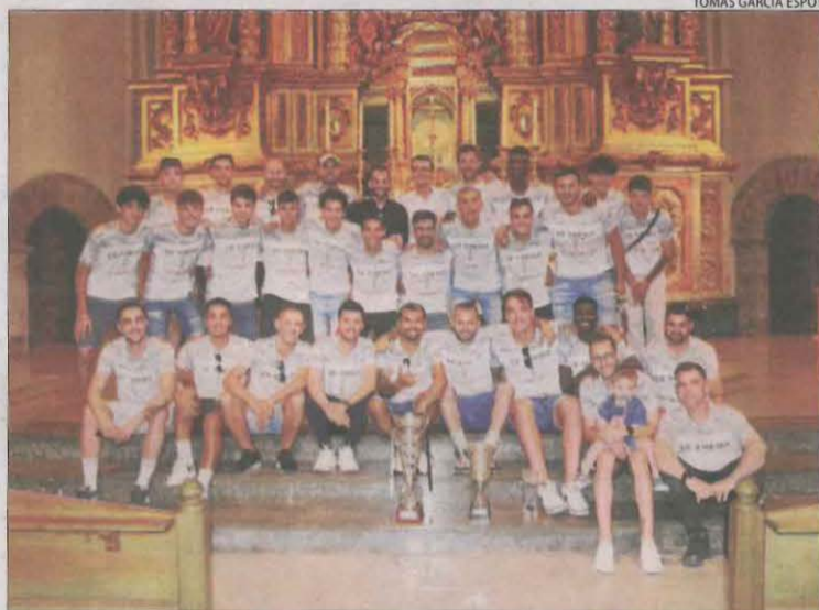
La plantilla va oferir el trofeu al patró del poble, sant Bonifaci.