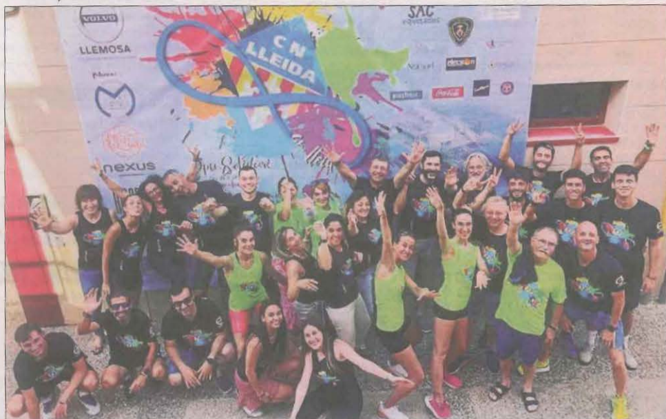
Iniciativa solidària. El Club Natació Lleida ha organitzat tot el cap de setmana el vuitè Open Solidari en benefici de l'AECC Lleida i el projecte d'un local de colònies per a nens i nenes.