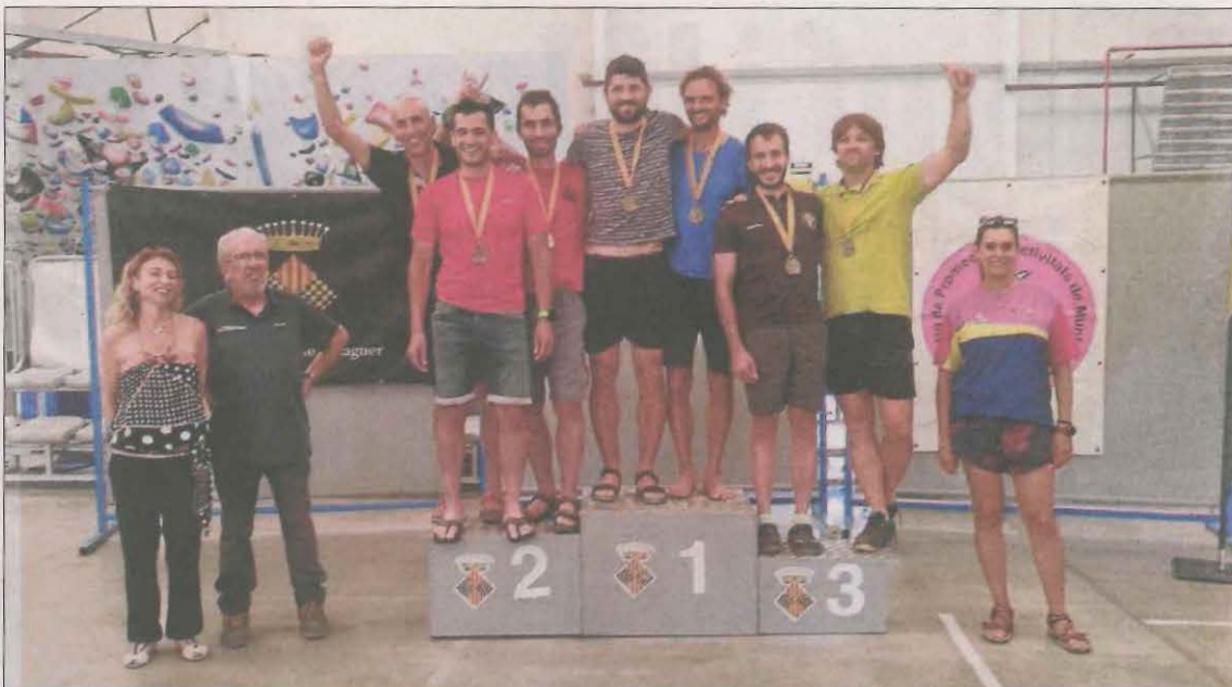
Participants del raid durant el tram de ciclisme de muntanya. A la dreta, la celebració al podi d'un dels equips guanyadors de la competició.