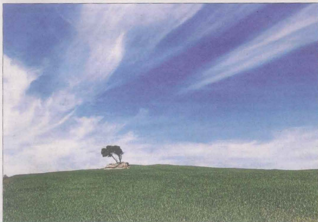
Solitud i placidesa. @jordi ens envia aquesta foto amb un solitari arbre, que creix sobre una roca, envoltat per un immens mar vegetal. Més tranquil·litat que això, impossible.