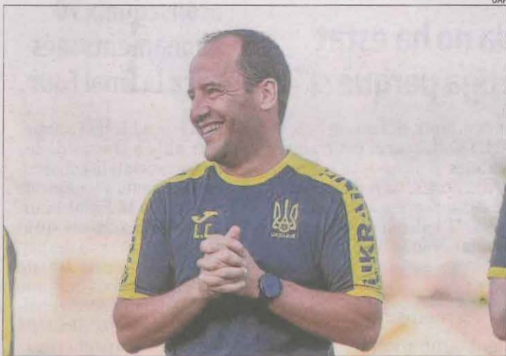
El tècnic de Balaguer, ahir durant l'entrenament.