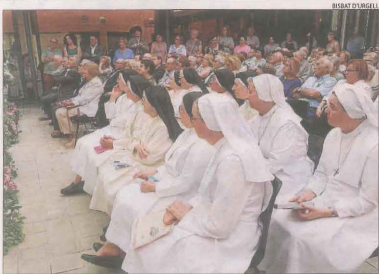
Acte d'homenatge a les monges del Cor de Maria en el centenari.