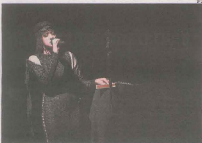
Sónar, de nou ■ El folk electrònic de Tarta Relena va obrir ahir a Fira Montjuïc després de dos anys de silenci la 29 edició del Sónar, que s'allargarà fins demà amb 117 actuacions.

Després de dos anys, el Mostremp també tornarà a celebrar al carrer la Festa del Cinema, un sopar amb productes de proximitat i música en directe.