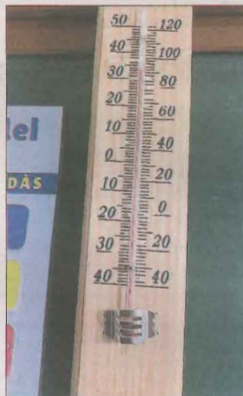
Temperatura ahir en una aula.

Segons van detallar fonts municipals, el servei de teleassistència trucarà als 145 usuaris que es troben en més situació de vulnerabilitat per comprovar el seu estat i si necessiten algun tipus d'atenció per pal·liar els efectes de la calor, i després ho farà amb 923 persones més no tan vulnerables, prioritzant les que viuen soles o en llocs aïllats.