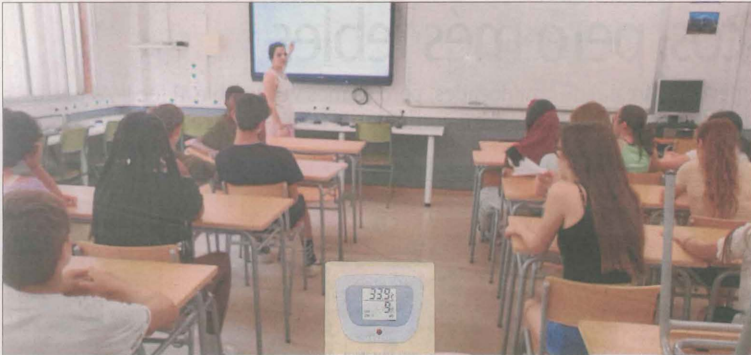
Classe en una aula d'un institut de Lleida ciutat amb gairebé 34 graus ahir cap a les 13.00 hores.