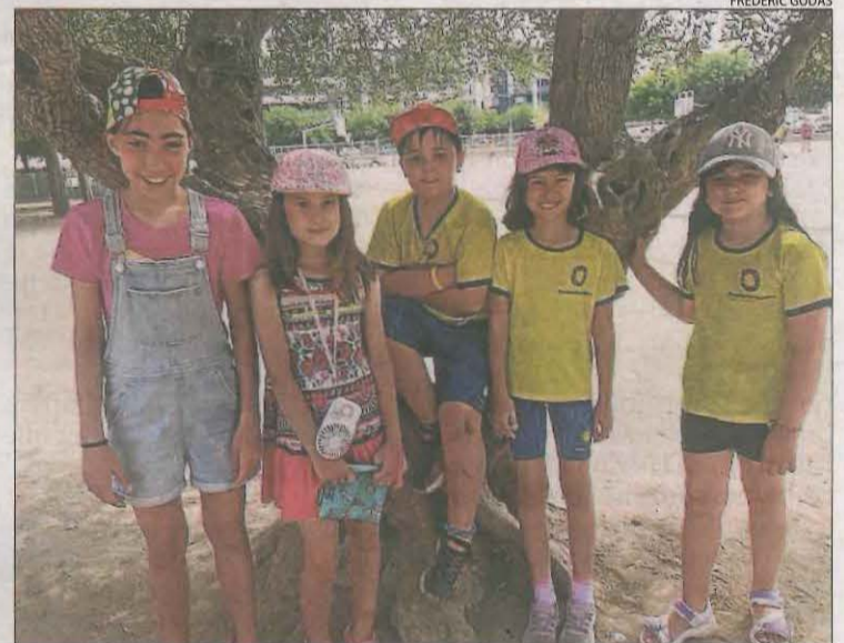
El col·legi Frederic Godàs ha demanat que els nens portin gorra.