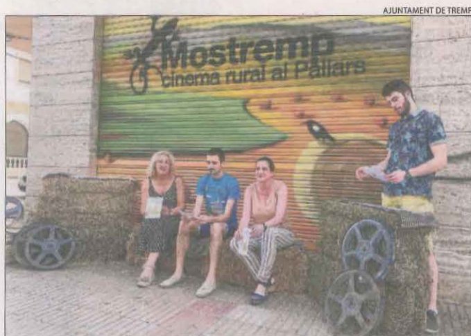
Presentació ahir a Tresp de l'onzena edició del certamen.