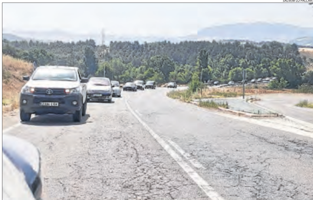
SALVEM LO PALLARS

Protesta contra centrals solars al Jussà ■ Salvem Lo Pallars i la Plataforma Unitària Contra l'Autopista Elèctrica van organitzar ahir una protesta contra les tres centrals solars que promouen filials de Forestalia i Blueprom entre Tremp i Isona. Van portar a terme una marxa lenta entre Figuerola i la capital del Jussà i van recollir més d'un centenar d'al·legacions.