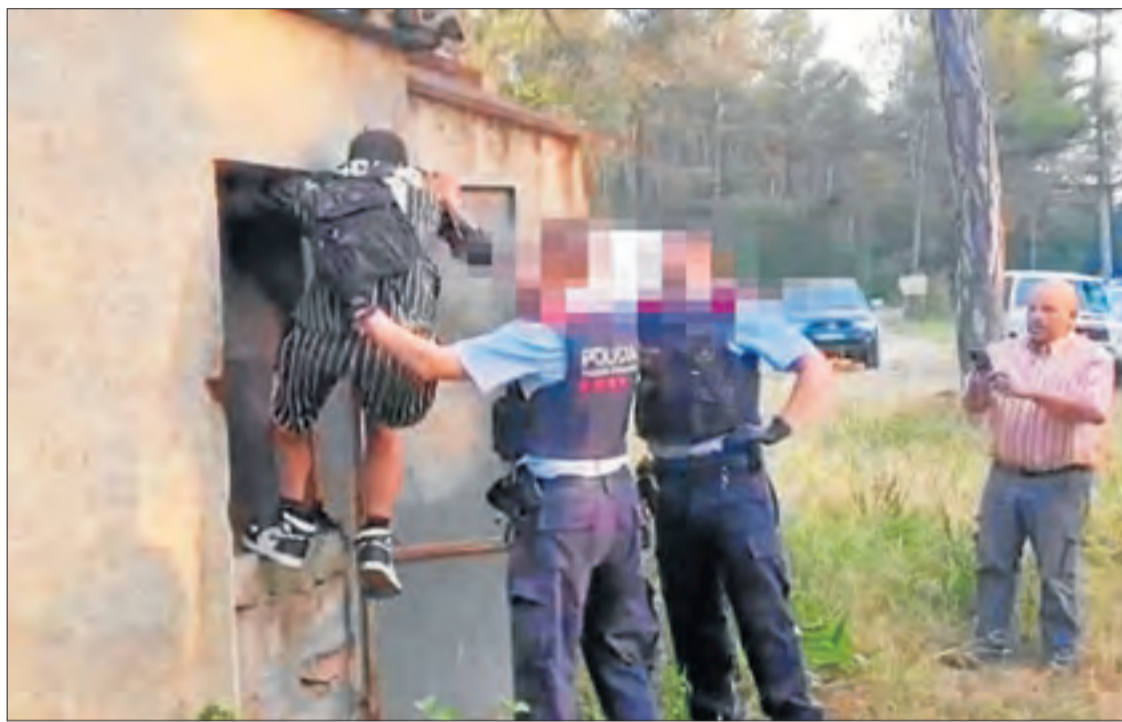
Moment de la detenció del jove, amagat en una caseta en una zona de pícnic.

Finalment, a les set del matí, agents dels Mossos d'Esquadra que es trobaven a prop del lloc van poder arrestar el presumpte autor dels focs, que ahir continuava a la comissaria a l'espera de passar a disposició judicial per aquest cas, que investiguen els Agents Rurals.