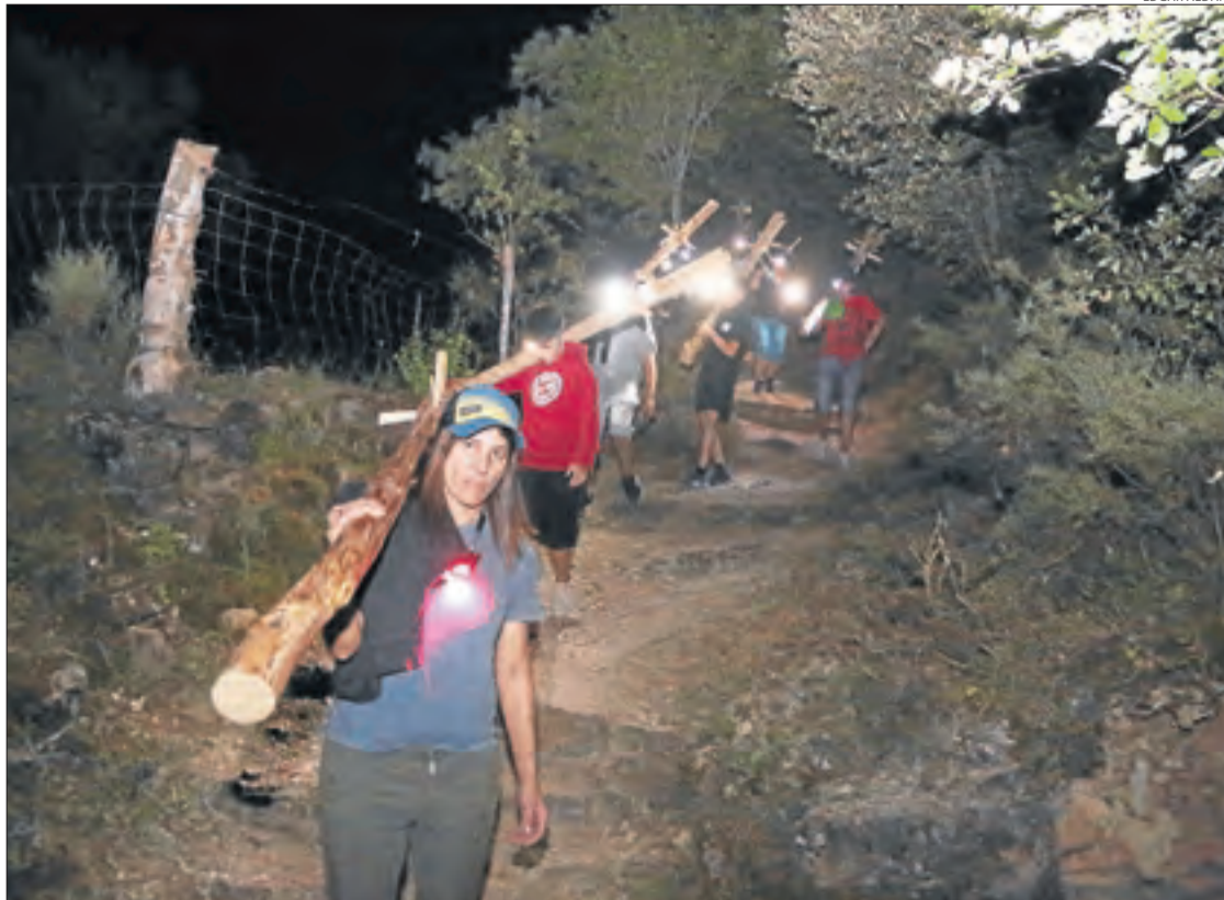
Durant la baixada les torxes van estar apagades però es van il·luminar amb llanternes.

Per la seua part, Sort també va fer baixar les falles encara que en aquesta ocasió l'organització va decidir fer-ho amb les torxes apagades i il·luminant el camí amb llanternes frontals. A les 19.00 els participants van recollir les falles al Riuet i a les 20 h van iniciar la pujada cap a Bressui. Dos hores més tard, a les 22.00, va començar la baixada d'Olp i a les 22.30 ho van fer els de Bressui. Es pot dir que les falles de Sort són les que recorren més quilòmetres de totes ja