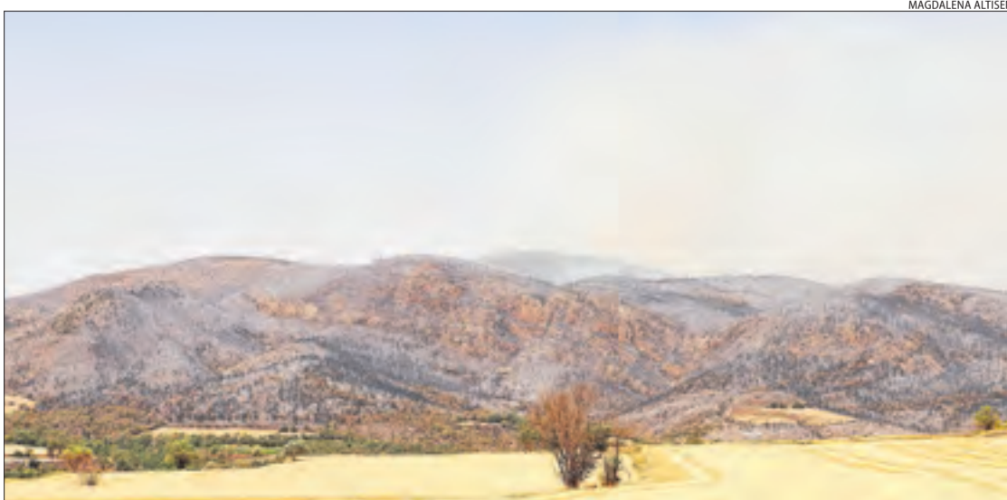
L'incendi a la Noguera manté un eix de confinament d'un es cinc mil hectàrees.

Al Solsonès van aconseguir estabilitzar el foc de Lladurs, que al principi va ser dels que més preocupació despertaven pel seu gran potencial d'incendi i que ha calcinat unes 42,8 hectàrees. També es trobava en fase d'estabilització el foc d'Altès (Bassella), amb una afectació d'un es set hectàrees, mentre que el de Castellar de la Ribera va ser donat per controlat amb una afectació estimada d'un es tres-centes i tres hectàrees. Els focs de Peramola i de Cabó van ser estabilitzats, mentre que continuava actiu el que va ser provocat per un llamp a Coll de Nargó.