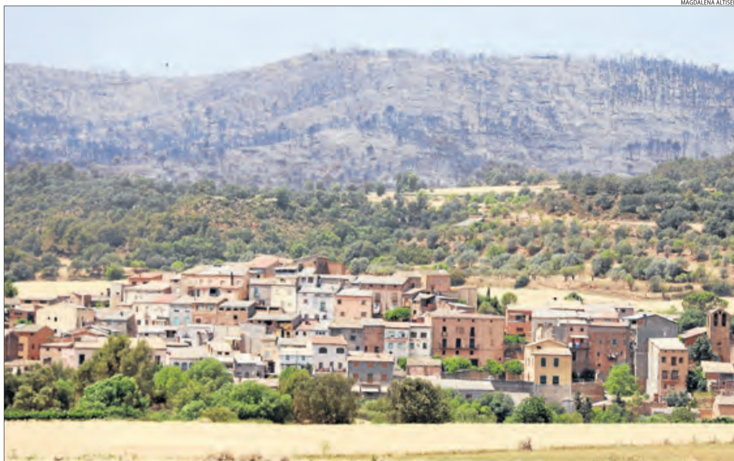
Vista de Baldomar, nucli d'Artesa de Segre, amb el paisatge calcinat al fons.

que s'està aconseguint que el perímetre creixi en "menys proporció".