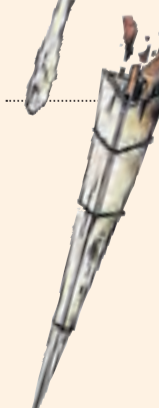
Vilaller. Tres taulons en forma de punta triangular d'1,80 m.