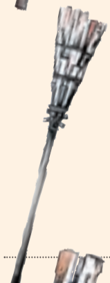
Ribagorçana. Amb quatre estelles de teia clavades en un pal d'avellaner.