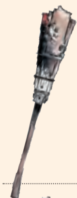
Isil. De pi roig, mesura entre 150 i 170 cm i pesa entre 20 i 45 quilos.