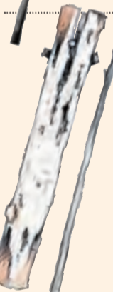
Rantiner. Abunda a la Vall de Boí, sobretot a Taüll. De pi negre.