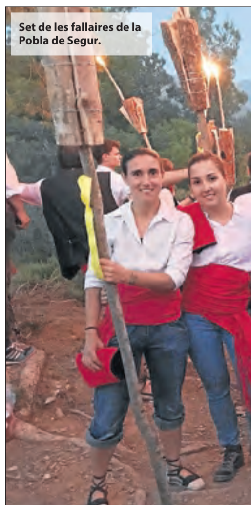
Set de les fallaires de la Pobla de Segur.