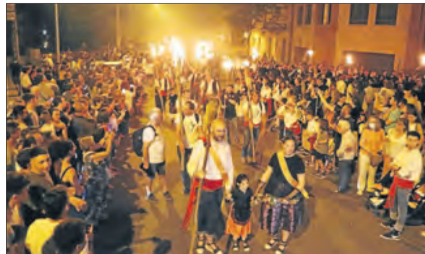
Els visitants van omplir els carrers de la Pobla de Segur.