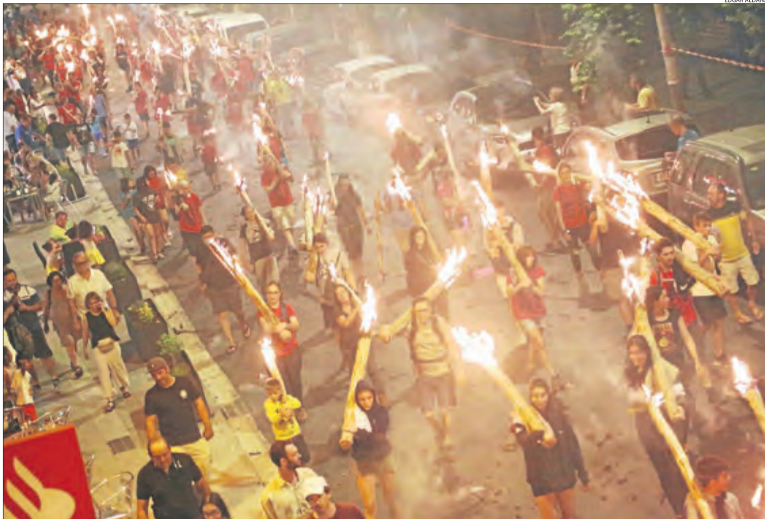
Les falles es van encendre un cop es va arribar al centre urbà i no hi va haver perill. A la imatge, Sort.

La festa va estar marcada per la presència de molta gent jove que assegura un futur a aquesta tradició, una cosa que també va voler ressenyar l'alcalde. “Els joves han estat els primers