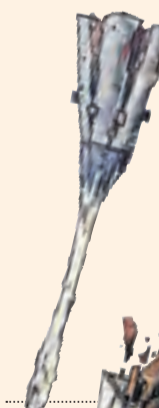
Barruera. D'avellaner, amb la part superior partida en 4 trossos.