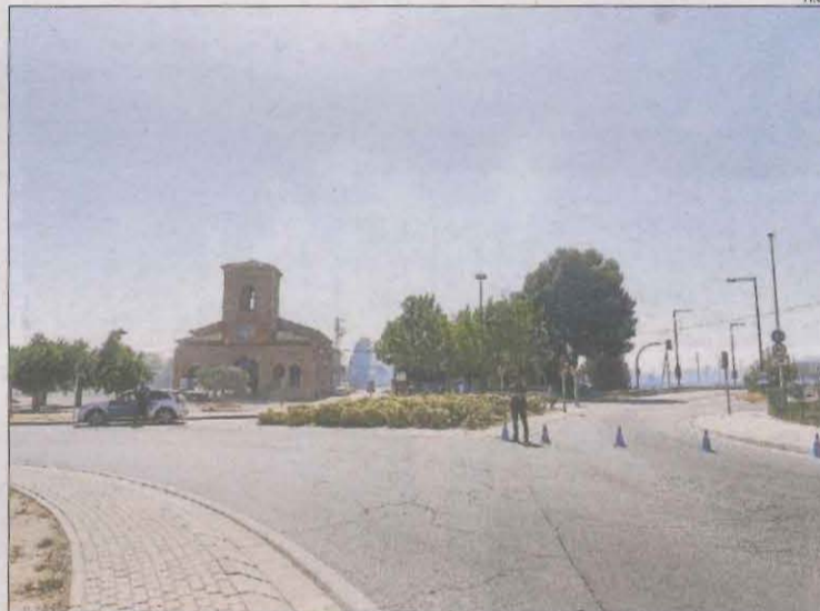
La carretera N-240 va quedar tallada unes dos hores.