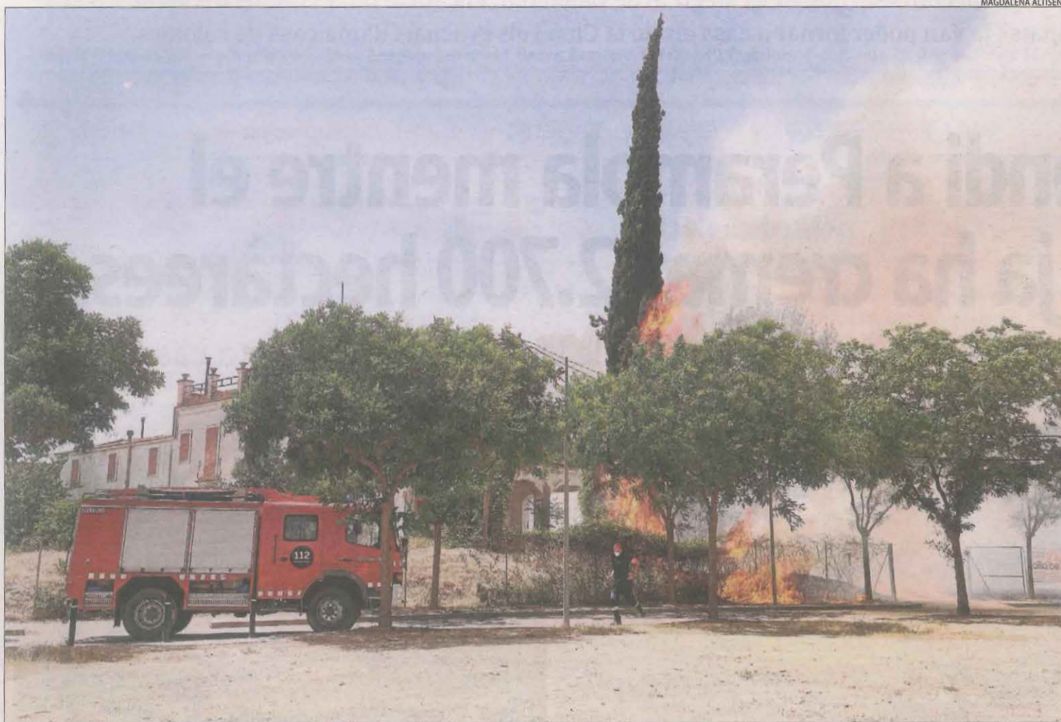
L'incendi es va originar al costat de Ciutat Jardí, a prop d'aquesta casa abandonada i de l'església de Montserrat.