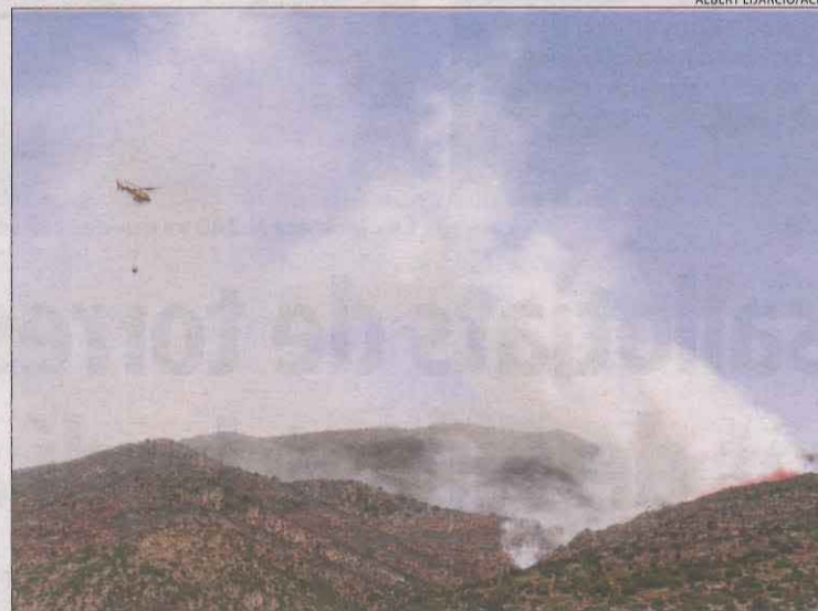
Un helicòpter a punt de descarregar aigua a l'incendi d'Artesa.

va reduir a entre 500 i 1.000 hectàrees gràcies al treball dels Bombers, amb cinquanta-cinc dotacions terrestres i nou d'aèries. Van indicar que el flanc prioritari és l'esquerre, el que dona accés a la Serra d'Aubenc.