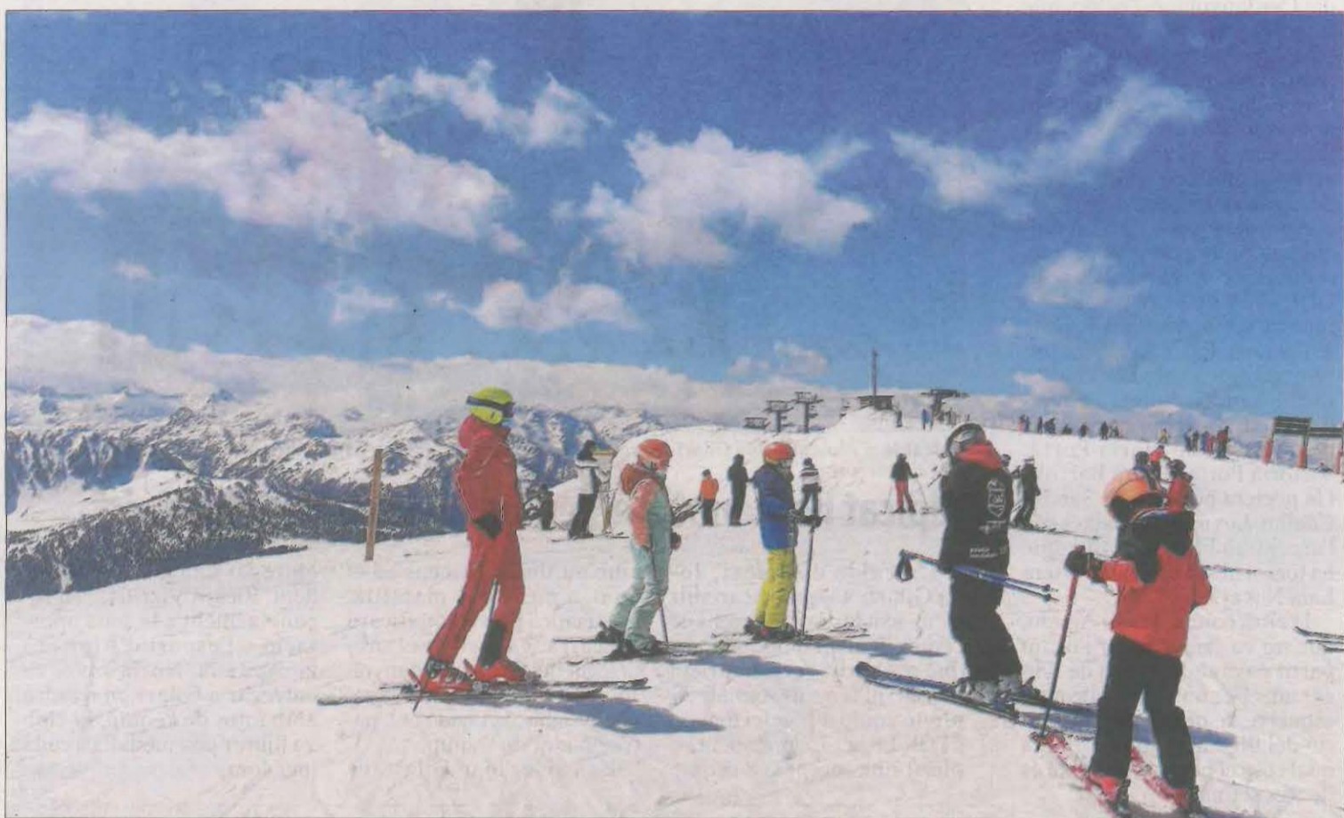
Foto d'arxiu d'esquiadors a l'estació aranesa de Baqueira Beret.

El Govern està obert a col·laborar amb altres territoris, però liderant el projecte olímpic