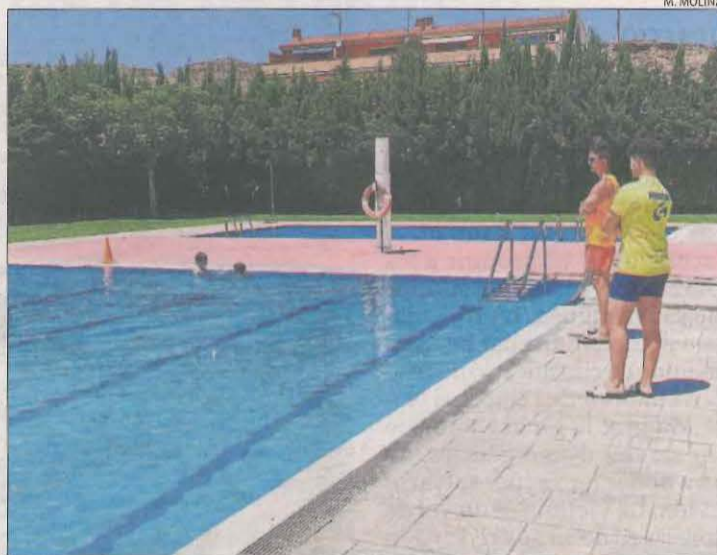
Els socorristes de les piscines d'Aitona parlen català.