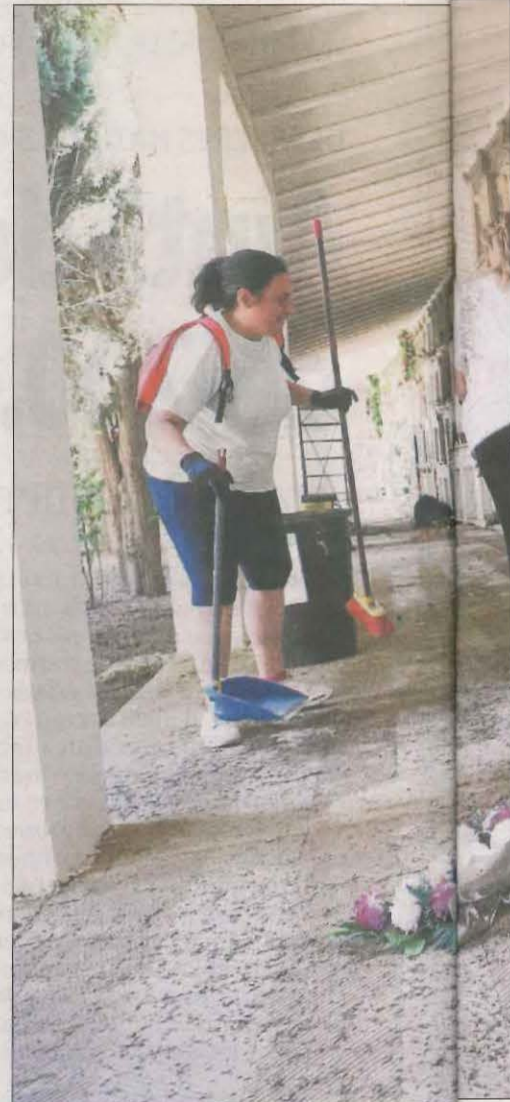
L'alcaldeessa d'Almacelles i veïnes

l'Estat treballen ara per delimitar quines seran les zones que rebran aquesta consideració -n'hi ha a Catalunya, el País Valencià, Aragó, Navarra, Andalusia i Castella i Lleó- i definir en els propers dies l'àmbit d'aplicació dels ajuts. La declaració s'aprovarà en el Consell de Ministres de dissabte o de dilluns vinent per poder oferir els ajuts.