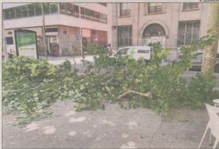
Una branca de grans dimensions, ahir a la rambla Ferran.