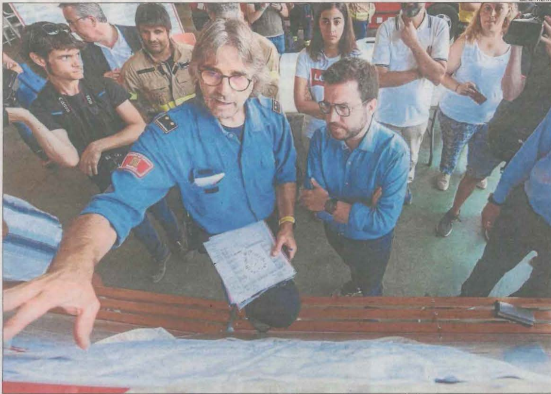
Aragonès va visitar ahir Artesa de Segre, on els Bombers li van explicar els detalls de l'incendi.