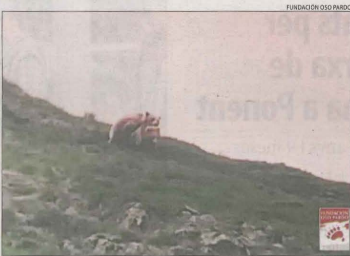
Aconseguen filmar l'aparellament de dos ossos a Aran.