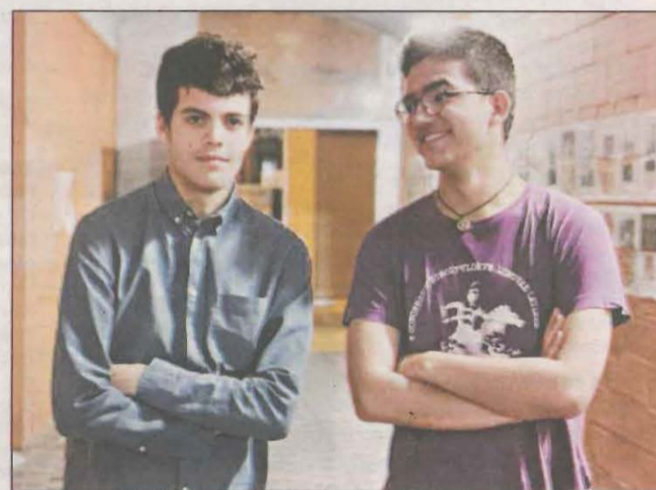
Ambos músicos han recibido una completa formación

Precisamente 'Tant de bo' fue la canción en catalán y de producción catalana que fue más radiada durante 2020, según la Associació de Productors i Editors Fonogràfics i Videogràfics de Catalunya, seguida por 'De veritat' de Blaumut, 'A la deriva' de Txarango y 'The Bright Side' de Stay Homas.