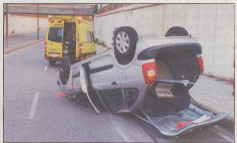
El conductor va donar positiu al control d'alcoholèmia

A banda d'això, els Bombers també van haver d'extingir un foc al carrer Parra de Lleida, el qual es va originar en un vehicle que estava estacionat. Els fets van ocórrer a les 3.07 hores i no es van registrar ferits.