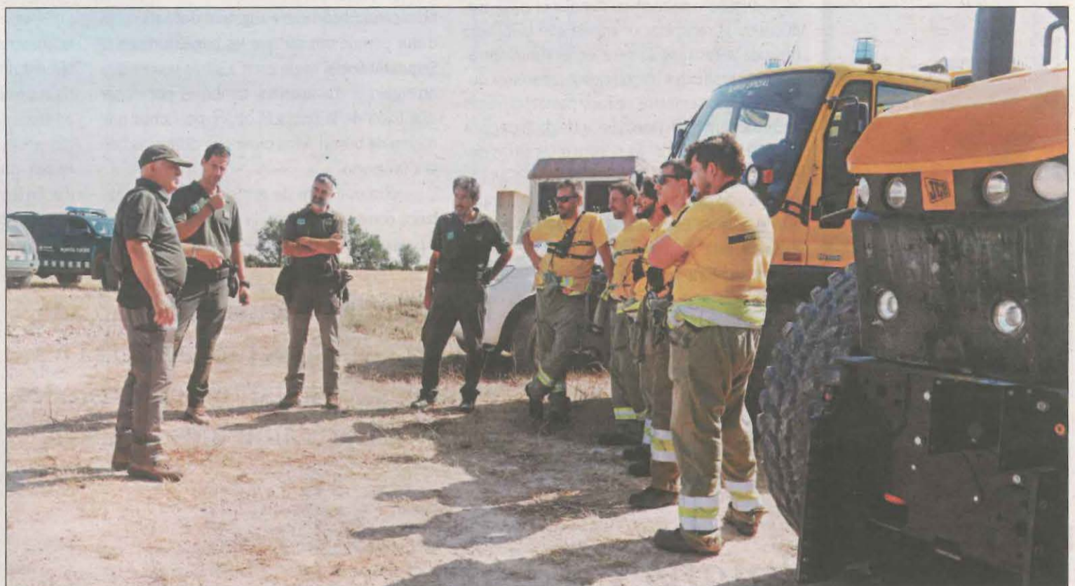
Els Agents Rurals sobrevolen les comarques de Ponent i patrullen les finques agrícoles durant la campanya de la sega

La campanya de la sega va arrencar a principis de juny i s'allargarà fins d'aquí unes tres setmanes, a principis d'agost.