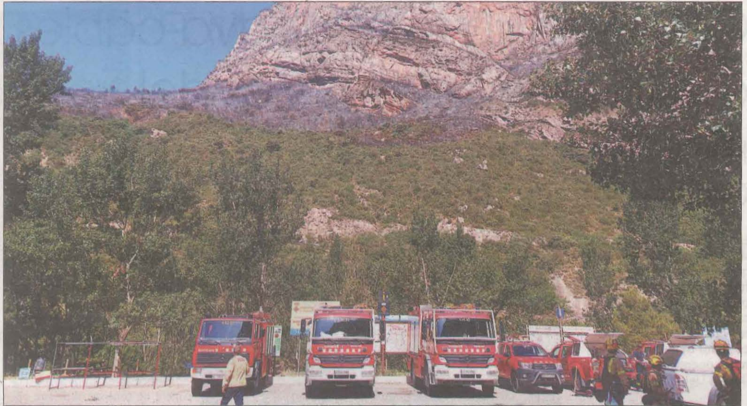
Els Bombers continuen treballant, amb 26 camions, per remullar els punts calents de l'incendi i evitar que revifin

Set dotacions dels Bombers van treballar ahir en un incendi que va calcinar totalment una masia a Belcaire d'Urgell. A la Granja d'Escarp un foc va cremar 800 metres quadrats.