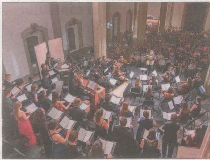
Concert inaugural de la 41a edició de la Càtedra