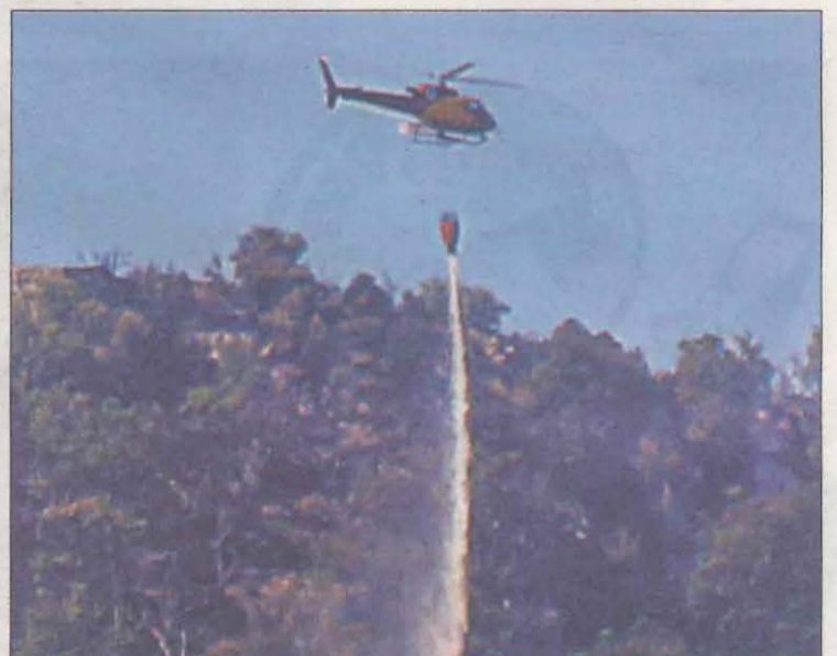
Un helicòpter dels Bombers descarregant aigua