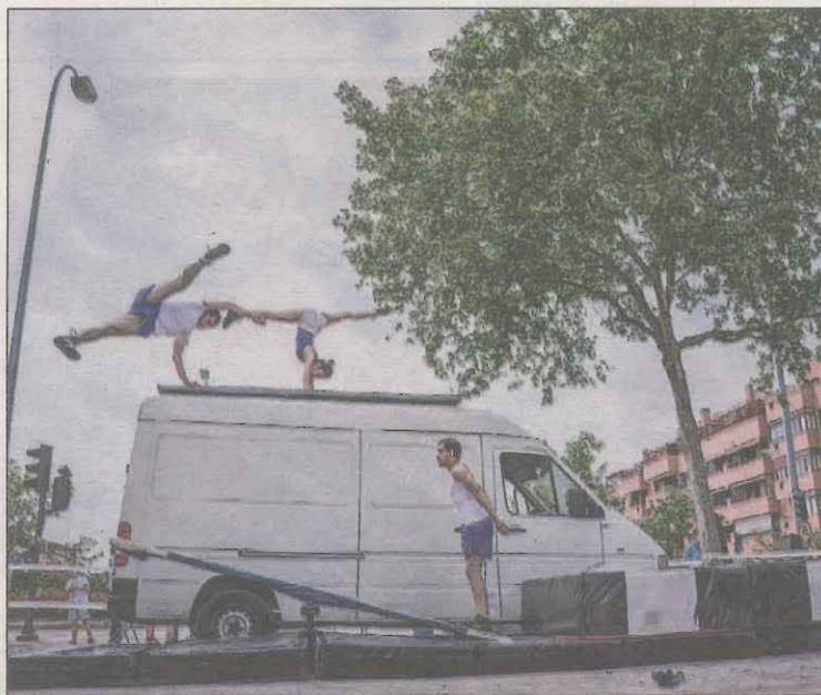
Una furgoneta emmarca l'escena de l'espectacle