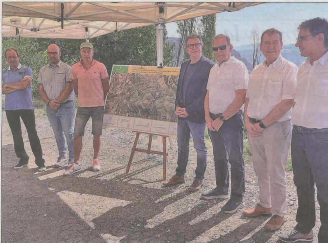
El president de la Diputació de Lleida i els alcaldes de la zona van presentar ahir el projecte

Per la seva banda, l'alcalde de Sant Esteve de la Sarga, Jordi Na-