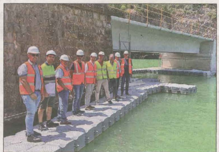
S'hi estan fent actuacions d'ampliació i millora