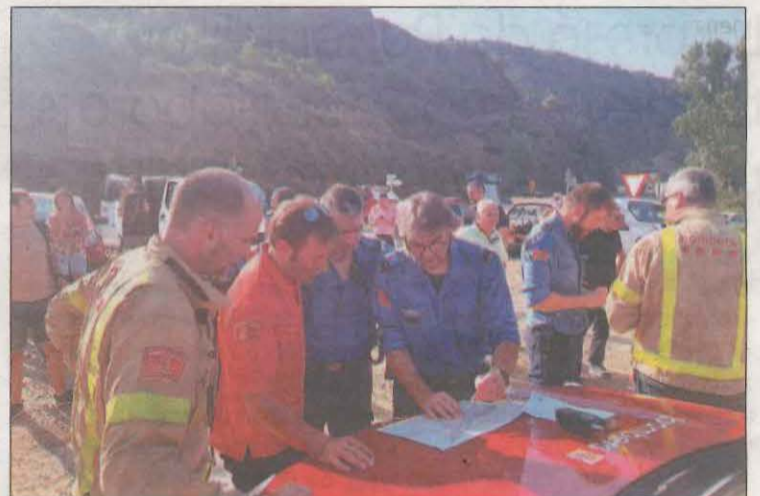
Reunió de treball al punt de comandament