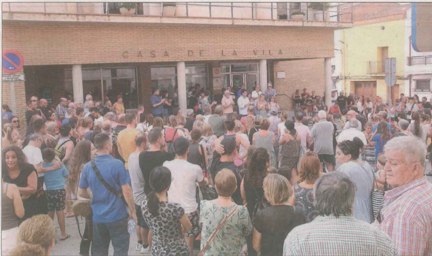
El gobierno municipal de sumó a la protesta de unos 300 vecinos de la localidad para exigir medidas para mejorar la seguridad

Denuncian actos violentos y una serie de robos a vecinos y en locales y hay un detenido y un fugado que vivían en pisos propiedad de la Sareb