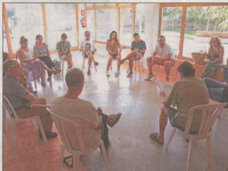
Moment de la reunió celebrada ahir a Juneda