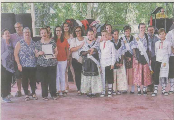
Aquest any també hi haurà homenatge a la gent gran

Entre les activitats més destacades en aquests quatre dies, els més joves podran gaudir d'un parc aquàtic durant tota la jornada del divendres a les piscines municipals. El mateix dia també hi haurà una caminada popular i la festa jove amb el DJ Enric Font. El dissabte destaca el tradicional concurs de paelles o el campionat de bitlles organitzat pel Club Esportiu Raimat. Finalment, el diumenge es farà la tradicional missa major cantada per la Coral Montserratina a l'Església del Sagrat Cor, i la festa major tancarà amb l'homenatge a la gent gran, un torneig de botifarra i el correfoc.