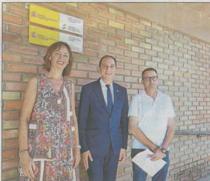
Crespín a l'Oficina de la Seguretat Social a Balaguer

tuals d'aquesta prestació, 3.948 són adults i 4.140 són menors d'edat. La prestació de l'IMV es rep de forma mensual en 12 pagues, contempla fins a catorze tipologies diferents de llars en funció del nombre de membres que hi conviuen o persones que viuen soles i estableix un nivell de renda garantida per a cada tipus de llar. La quantitat a percebre oscil·la,