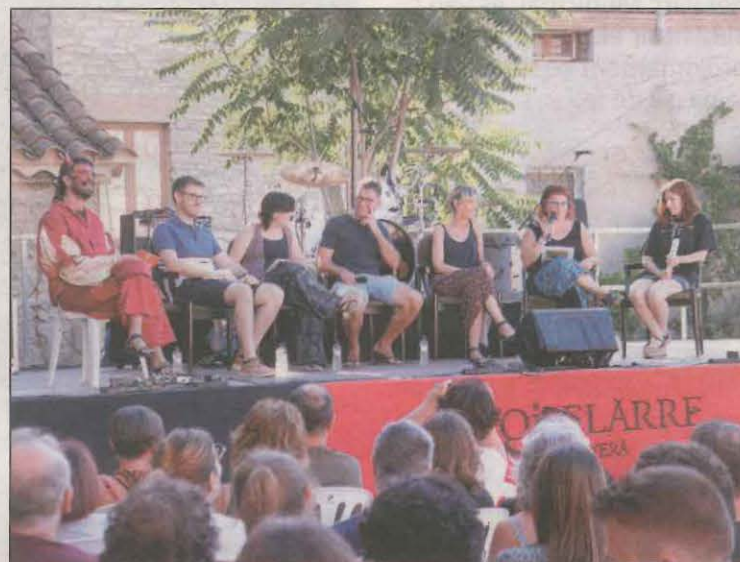
La nova edició de l'Aquelarre es va presentar ahir

L'impacte econòmic de l'Aquelarre per a la ciutat de Cervera es de quasi un milió d'euros, s'hi esperen 30.000 persones durant tot el cap de setmana i es cremaran uns 360 quilos de material piro-