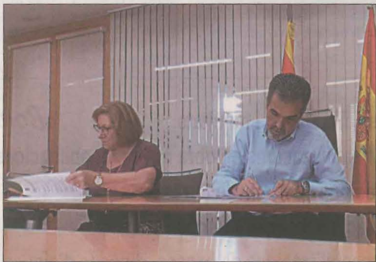
Moment en què es va firmar aquest conveni