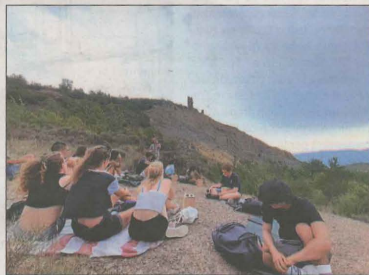
Els joves provenen de França i Grècia, entre d'altres

dels habitatges als requeriments tècnics de habitabilitat seran sufragats per l'Ajuntament de Fraga, destinant un import proper als 190.000 euros. Aquest espai podrà donar servei fins a vint-i-quatre usuaris de forma simultània. La gestió del servei d'acollida i atenció el realitzarà Càrites Diocesana Barbastre-Monsó.