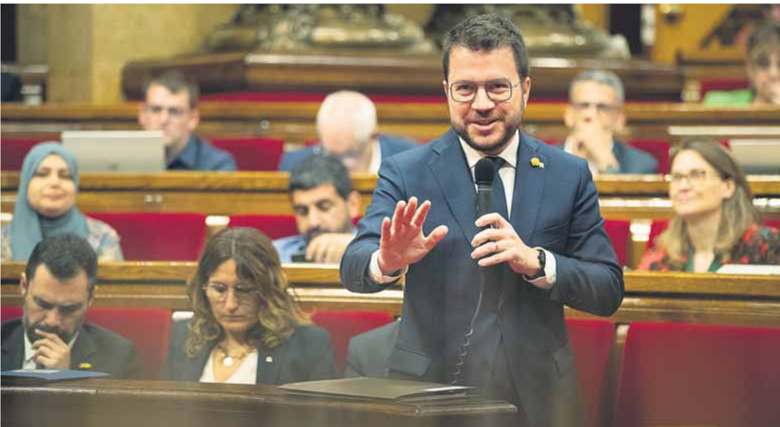
El president del govern, Pere Aragonès, en la sessió de control, ahir al Parlament