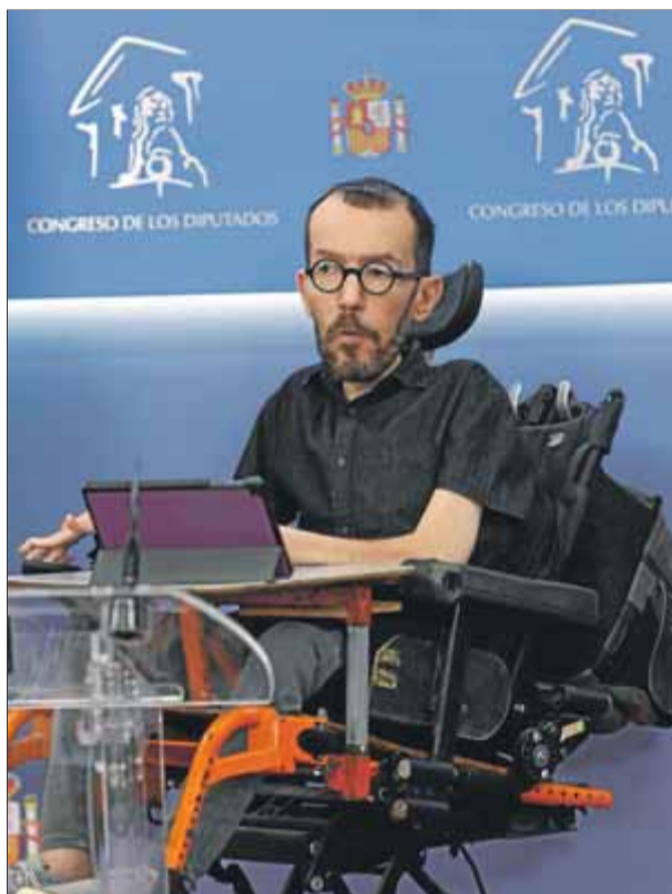
Echenique (Podem), ahir al Congrés ■ RODRIGO JIMÉNEZ / EFE