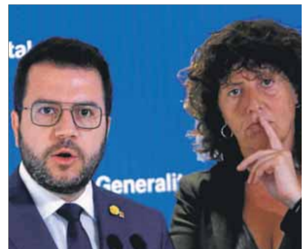
El president Pere Aragonès i la consellera d'Acció Climàtica, Teresa Jordà, ahir en la visita a l'ACA

sures. “Som conscients que amb relació a la disponibilitat de l'aigua la situació és complicada”, va assenyalar, i va defensar que “el govern fa temps que treballa” en la situació. El president va insistir que és necessari llançar “el missatge a la ciutadania” que “cal fer un ús responsable de l'aigua”.