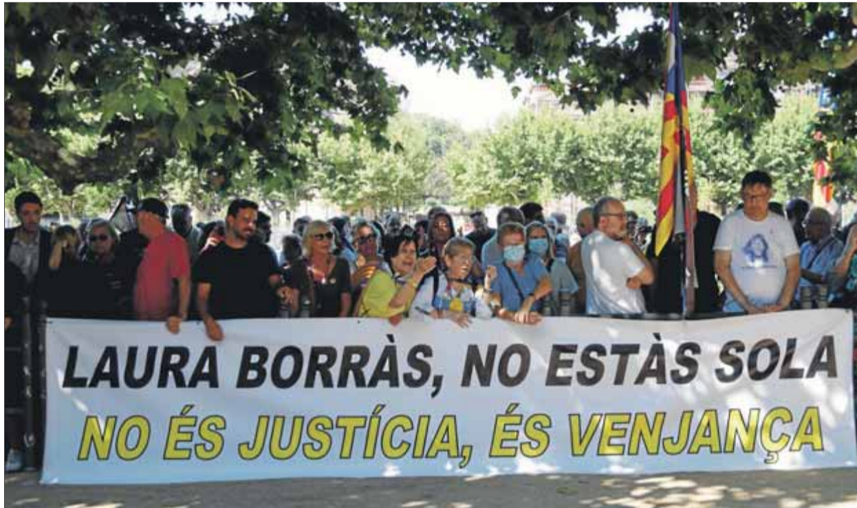
Alguns dels concentrats donant suport a Laura Borràs a les portes del Parlament ahir al matí

Els republicans no van voler entrar a valorar les acusacions de “jutges hipòcrites” amb què Borràs va qualificar-los, juntament amb la CUP, i la portaveu d'ERC, Marta Vilalta, va preferir “treballar per la ciutadania, ser útils i no alimentar aquelles dinàmiques que ens n'allunyen”. Això sí, va recordar que no era una situació buscada pels republicans, que preferien que hagués dimitit, i va explicar que havien aplicat estrictament el que deia el reglament per no po-