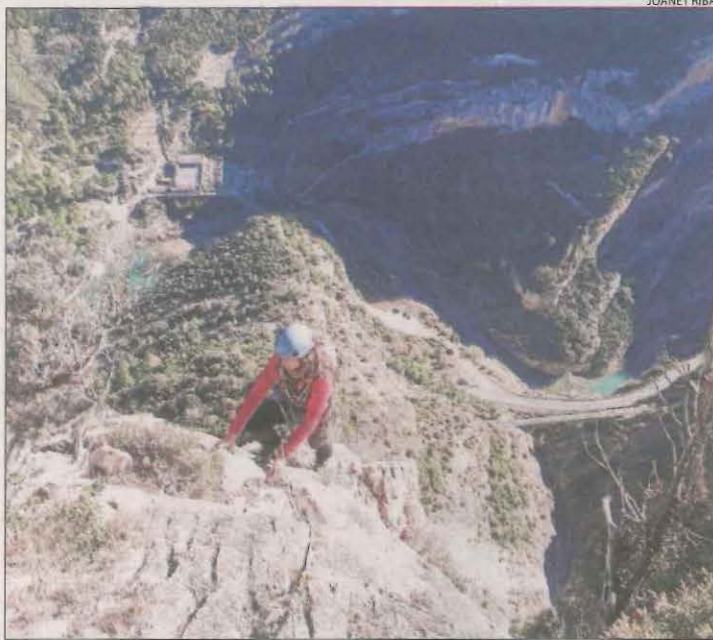
Escaladora acabant una de les nombroses vies de Roca Regina.

Un punt de vista des de Mountain Wilderness Catalunya