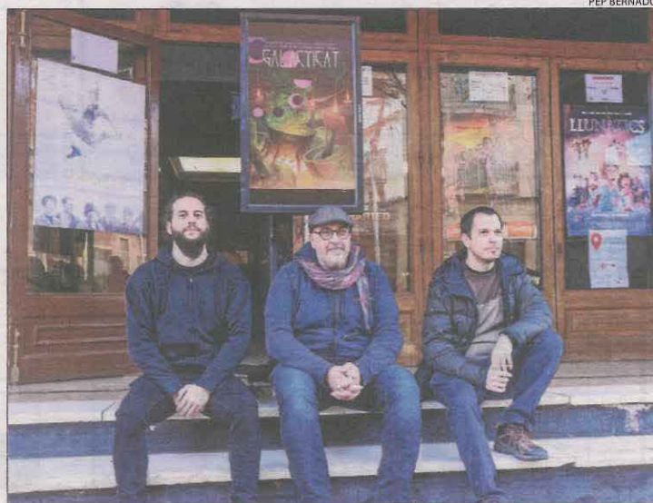
Responsables del Galacticat, en la presentació del certamen.