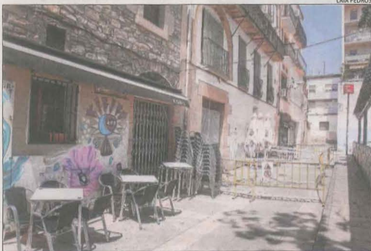
La zona afectada per l'ensorrament va quedar tancada.