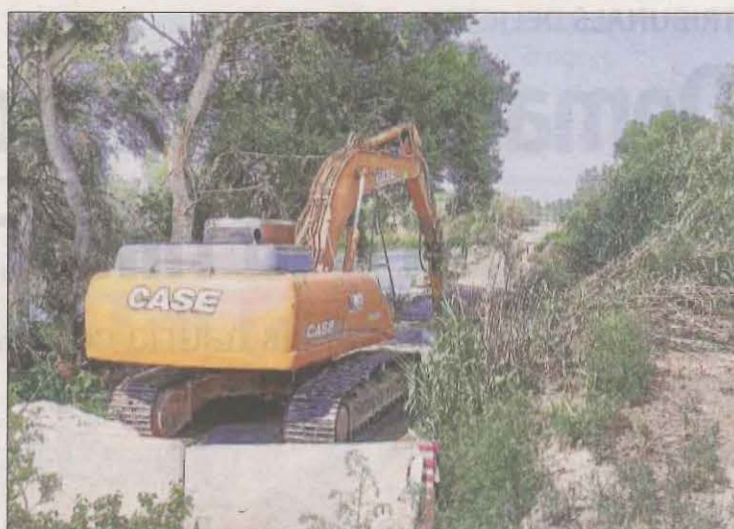
La CHE ha iniciat els treballs per demolar el pas del riu.

La CHE va iniciar ahir els treballs previs amb la construcció d'una "barrera de sediments" per poder treballar amb la maquinària.