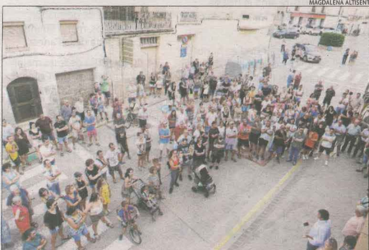
Veïns d'Alcoletge van protestar dimarts per demanar seguretat.

És el segon detingut per aquest cas, després que dimarts a la matinada la policia catalana