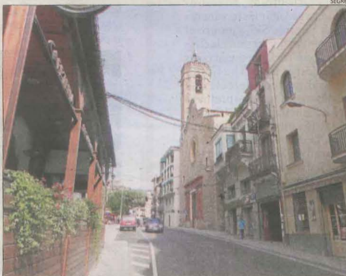
Imatge d'arxiu de la travessia de l'N-260 a la Pobla.

Els treballs de redacció del traçat de la ronda es van paraitzar el 2012, quan es va firmar una acta de suspensió d'aquesta infraestructura. L'Estat va reprendre el projecte el 2019 i l'any següent va publicar l'informe d'impacte ambiental.