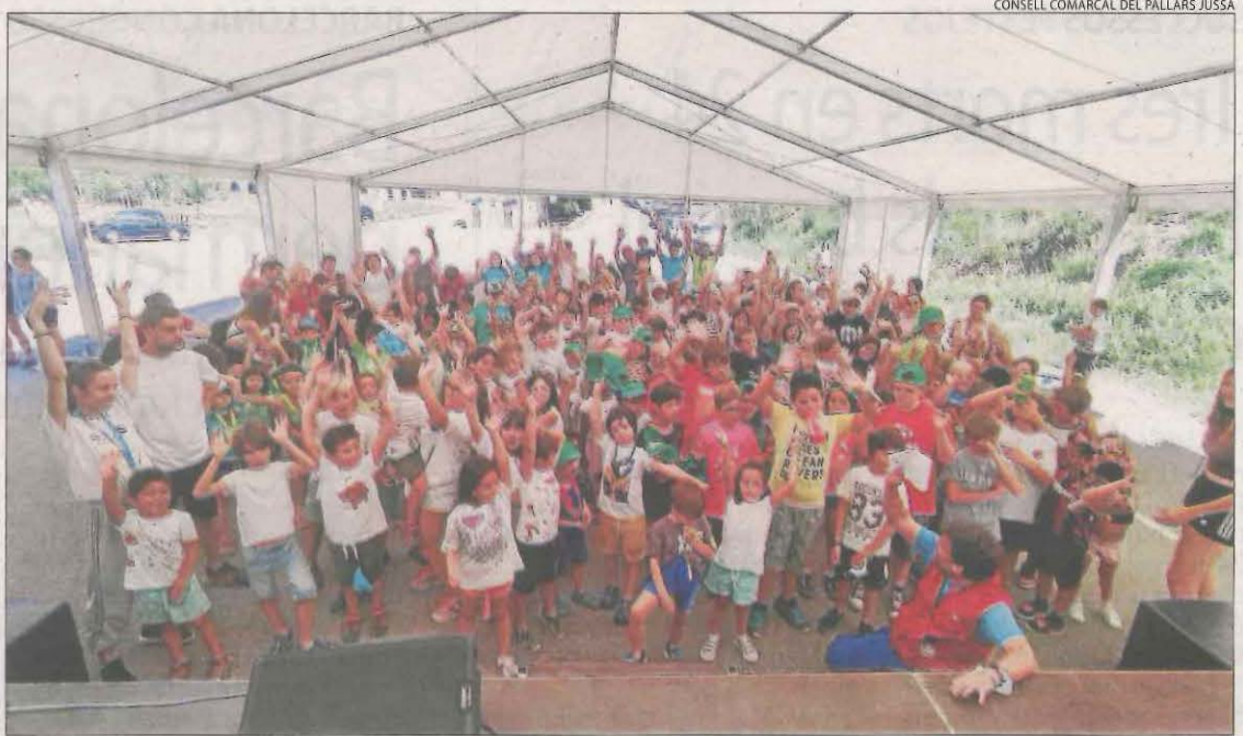
CONSELL COMARCAL DEL PALLARS JUSSÀ

La parròquia de Tàrrega va rebre el pergami restaurat amb el projecte original de l'església de Santa Maria de l'Alba. Ho va fer el tracista Fra Josep de la Concepció i l'han restaurat al Centre de Restauració de Béns Mobles.