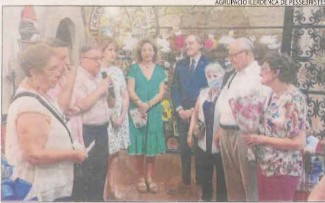
AGROPACIÓ ILLERDENCA DE PESSEBRISTES