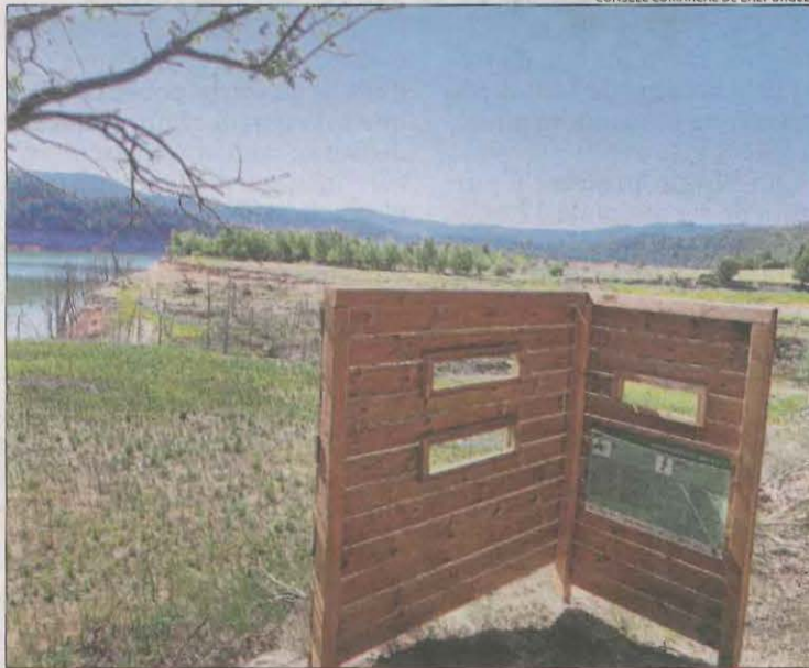
Un dels aguaitis instal·lats a l'entorn de l'embassament de Rialb.

tant el medi ambient. Camina Pirineus es planteja com un impuls al territori a través de la creació de la xarxa del paisatge de l'Alt Urgell amb la posada en valor de recursos com miradors, aguaitis o itineraris. Des del consell van explicar que la protecció i rehabilitació d'espais naturals protegits i la preservació del patrimoni cultural augmenten la competitivitat de l'oferta turística de la comarca i reactiven l'economia.