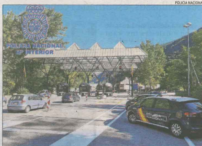
Imatge de la duana de la Farga de Moles.