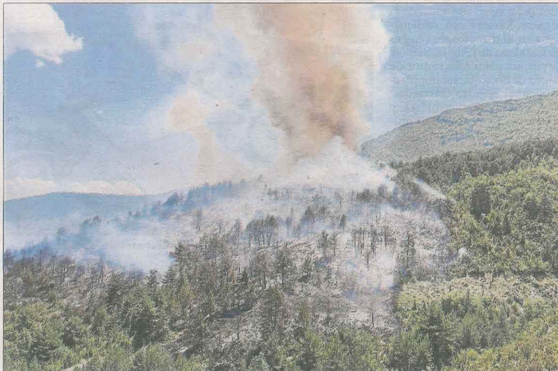
Imatge de l'incendi de Bonansa, en una zona boscosa de difícil accés.

El foc es va produir a uns dos quilòmetres d'aquest poble de la Ribagorça però no hi va haver risc