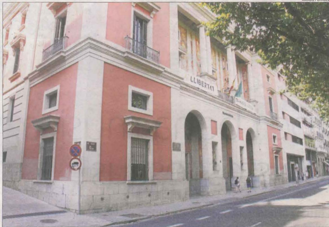
Façana de la seu de la Diputació, a la rambla Ferran de Lleida.

Dels 36 actuals, comarques com el Segrià només en tenen un, que cobreix amb dificultat els ajuntaments inclosos en el programa. El pla preveu suplementar, per exemple, els SAT de l'Alt Urgell, les Garrigues i el Sobirà.