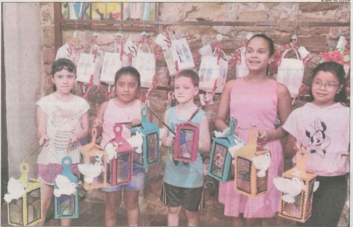
BISBAT DE LLEIDA