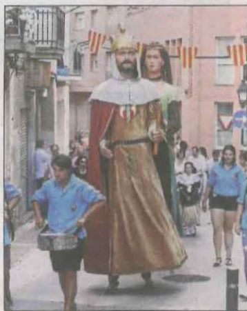
Acompanyats pels grallers, sortiran en diverses ocasions.