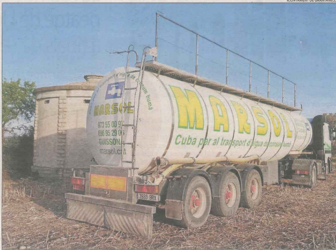
AJUNTAMENT DE GRANYANELLA

L'ajuntament de Llimiana va anunciar ahir restriccions al consum d'aigua potable, després que Baix Pallars establís les primeres a Lleida la setmana passada. La localitat del Pallars Jussà tancarà el subministrament del poble des de les 23.00 fins a les 7.00 hores, i adverteix els habitants de masies que redueixin