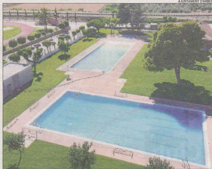
Vista aèria de les piscines d'Arbeca.

Pares dels menors diuen que va ser "part d'un joc en què tots els nens participaven"