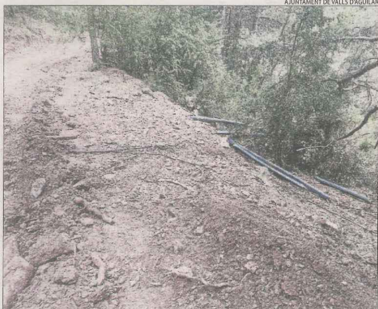
AJUNTAMENT DE VALLS D'AGUILAR

■ S'espera que en els propers dies baixin les temperatures i que això comporti un descens en el consum d'aigua.