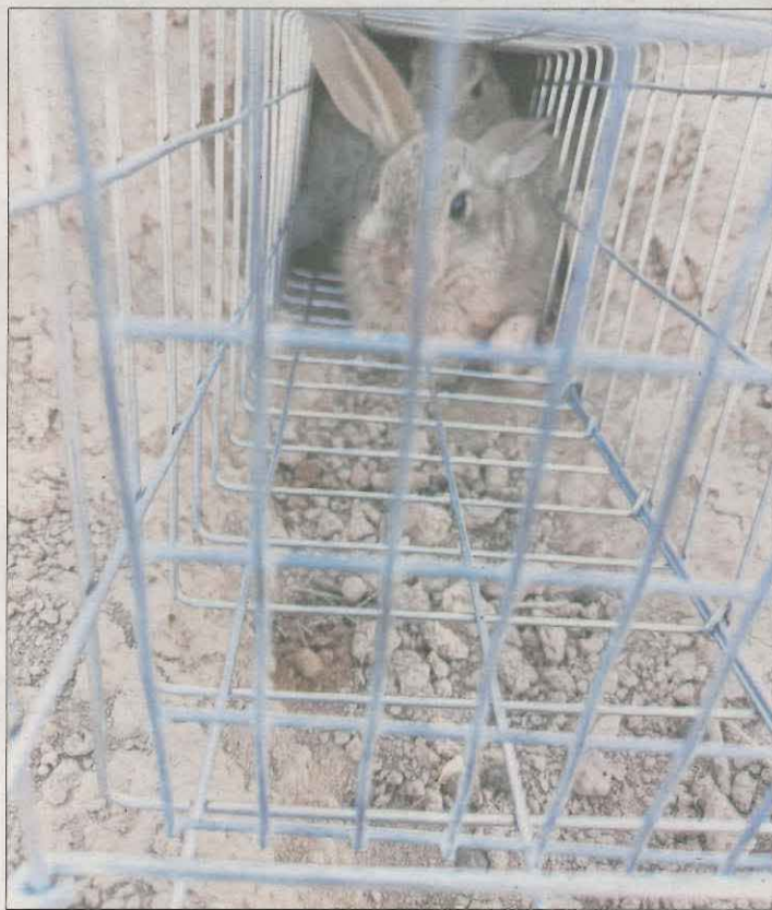
Dos conills en una trampa a Verdú.