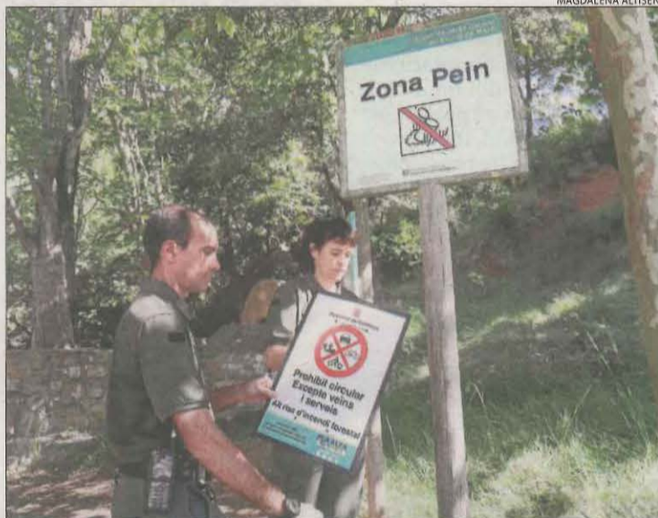
Retirada ahir del senyal de prohibició a la font de la Figuera.