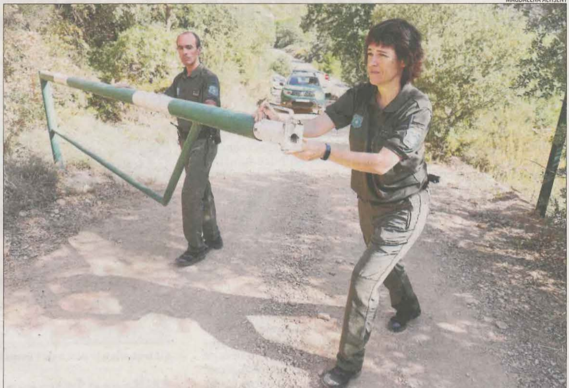
Dos agents rurals obrint ahir un camí tancat al Montsec de Rúbies a Vilanova de Meià.

Per la seua part, el Servei Meteorològic de Catalunya va afirmar que es tracta d'una de les "onades de calor més persistents que s'han mesurat", que destaca per l'exceptional durada de l'episodi, amb més de dos setmanes de calor superior a la normal en plena canícula. Les nits tropicals (temperatura mínima nocturna igual o superior a 20 graus) han estat habituals a la costa catalana però també en molts llocs elevats de l'interior. A Vielha, per exemple, es van superar les temperatures màximes en anys amb registres per sobre dels 37 graus durant diversos dies.