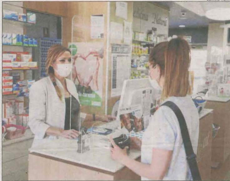
Venda de medicaments en una farmàcia lleidatana.