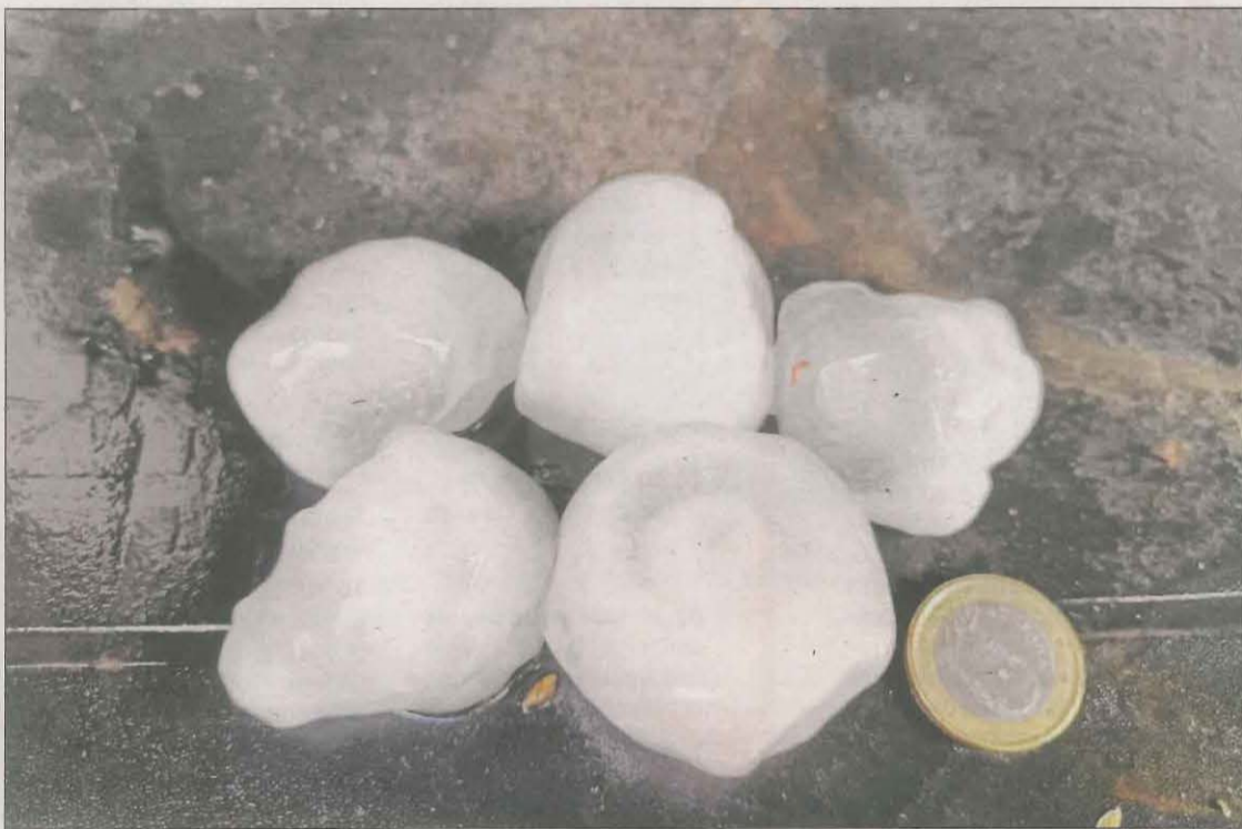
Pedra que arriba a duplicar el diàmetre d'una moneda d'un euro a Almacelles.

Tempestes irrompen a les comarques lleidatanes després de mesos de sequera i deixen fins a 45 litres per metre quadrat || La Generalitat alerta de pluges i forts vents que hauran d'amainar a partir d'avui