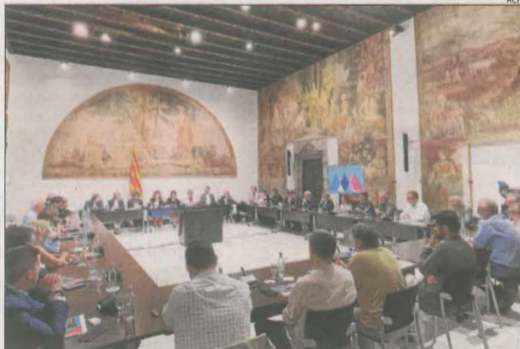
Moment de la reunió amb la taula de representació territorial.

Altres estacions que acolliran proves són la Molina i Masella, i els esports de gel es farien al Palau Sant Jordi, el Palau de Gel del Barça, Fira de