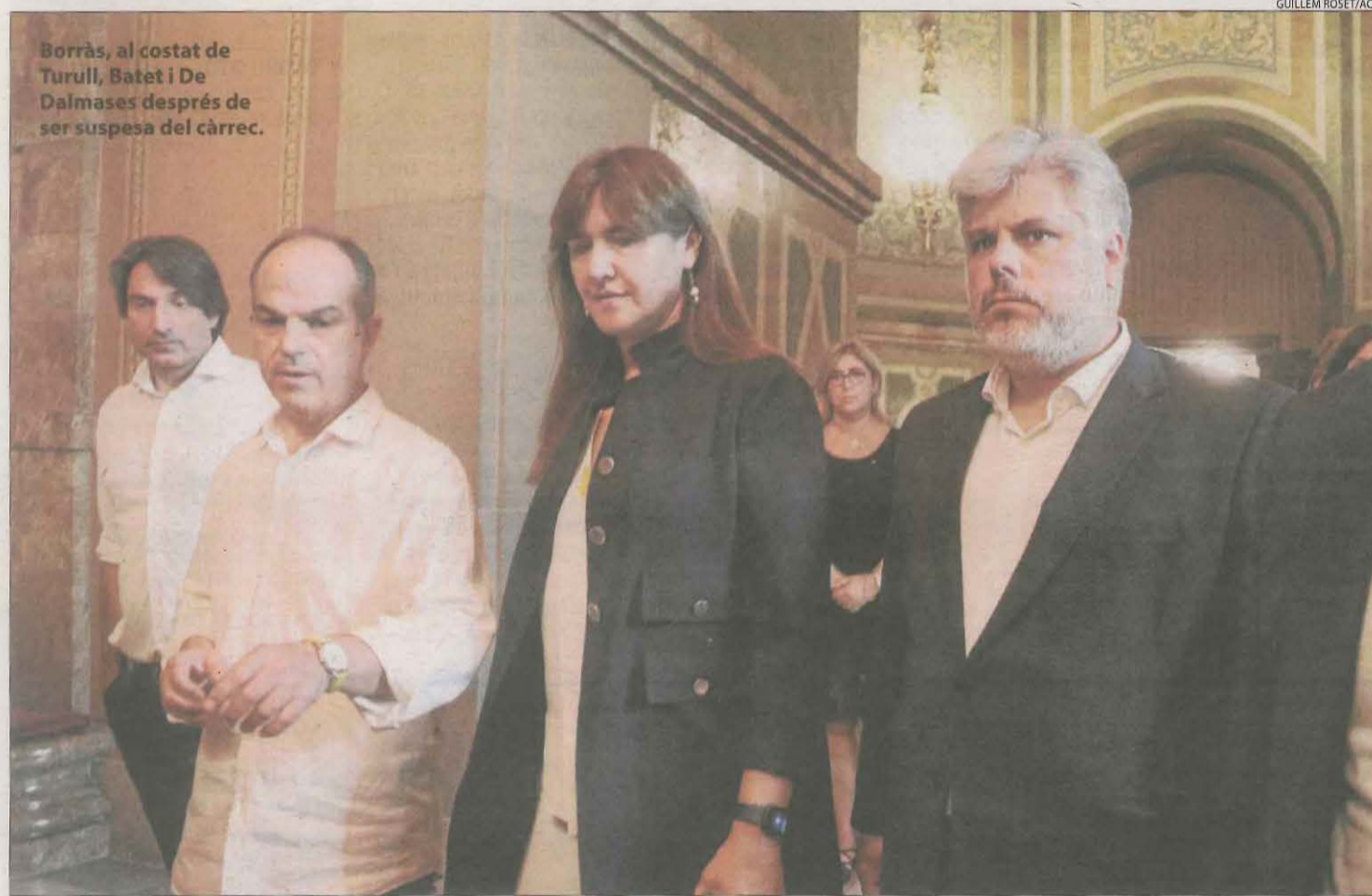
Borràs, al costat de Turull, Batet i De Dalmases després de ser suspesa del càrrec.