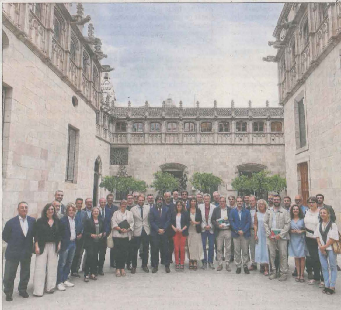
Foto de família dels assistents a la reunió d'ahir, després de la qual la Generalitat va anunciar el projecte.

Després que no tirés endavant el projecte conjunt amb Aragó, davant de les reiterades traves del president de la comunitat aragonesa, Javier Lambán, Vilagrà va destacar que no vol perdre "l'oportunitat" d'optar pels Jocs del 2030. No obstant, va reconèixer que la decisió no depèn de la Ge-