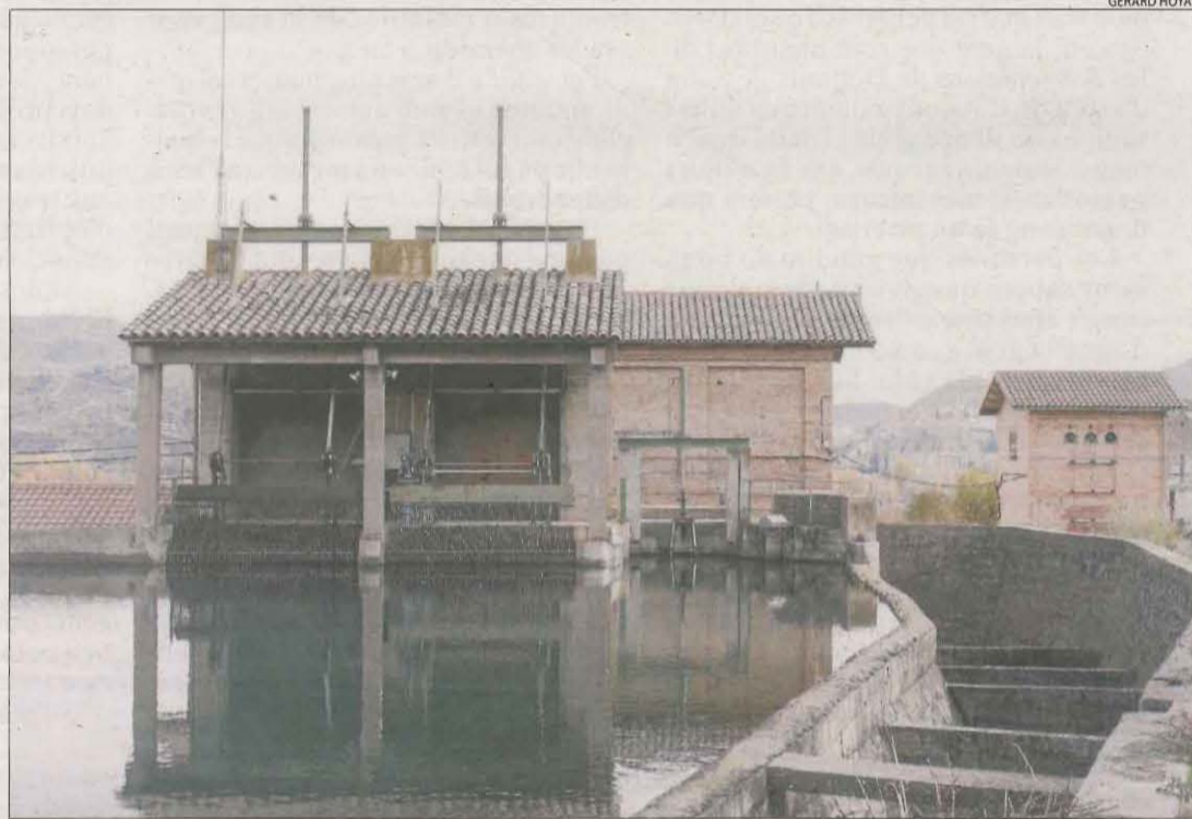
Imatge recent de la central hidroelèctrica de Castillonroi.

Les concessions de les centrals hidroelèctriques d'Espot, Llesp, la Plana, el Pont, Sant Maurici i la Torrassa són les pròximes que expiraran a Lleida fins al 2031. La resta es prolongarà més enllà d'aquesta data i les de més de trenta es mantindran en vigor fins a l'any 2061.