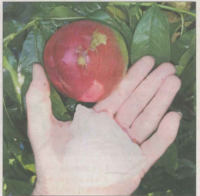
Préssec danyat per granís de gran mida a Almacelles.