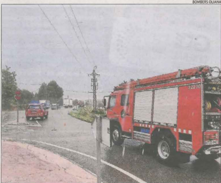
Una de les intervencions dels bombers ahir.