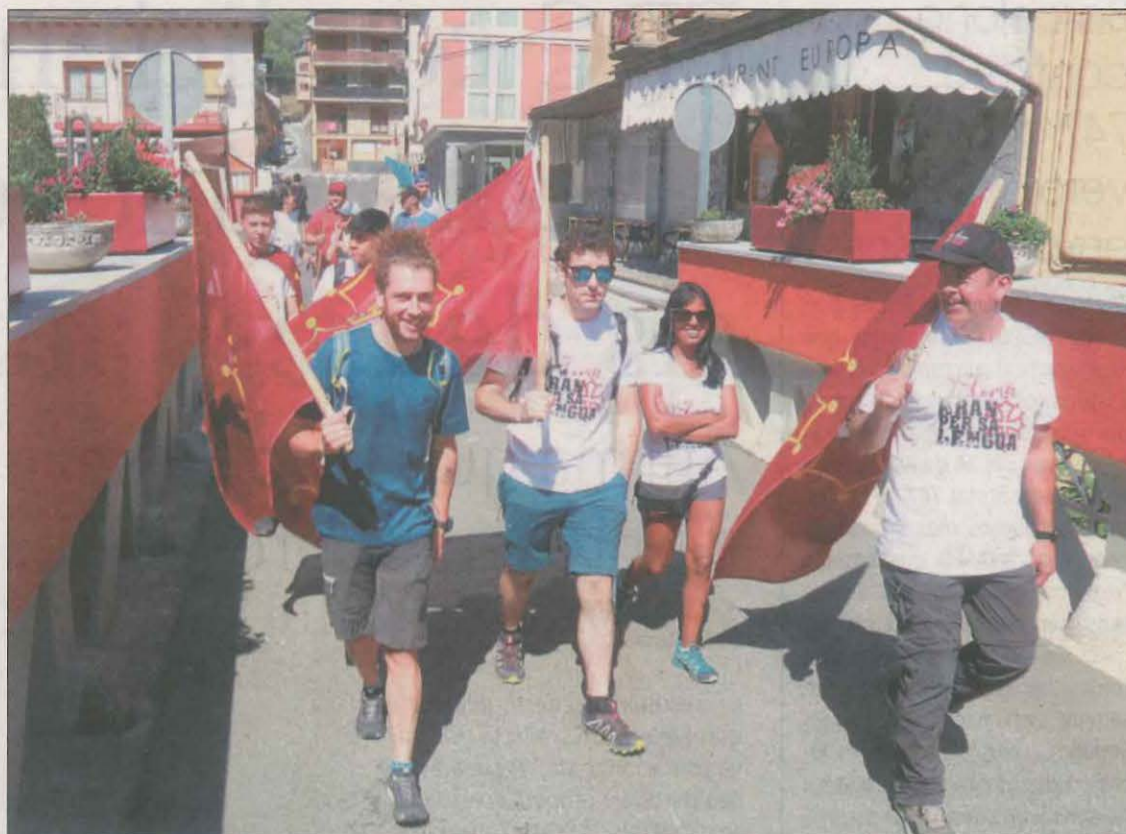
L'edició d'enguany ha recuperat el format habitual d'abans de la pandèmia