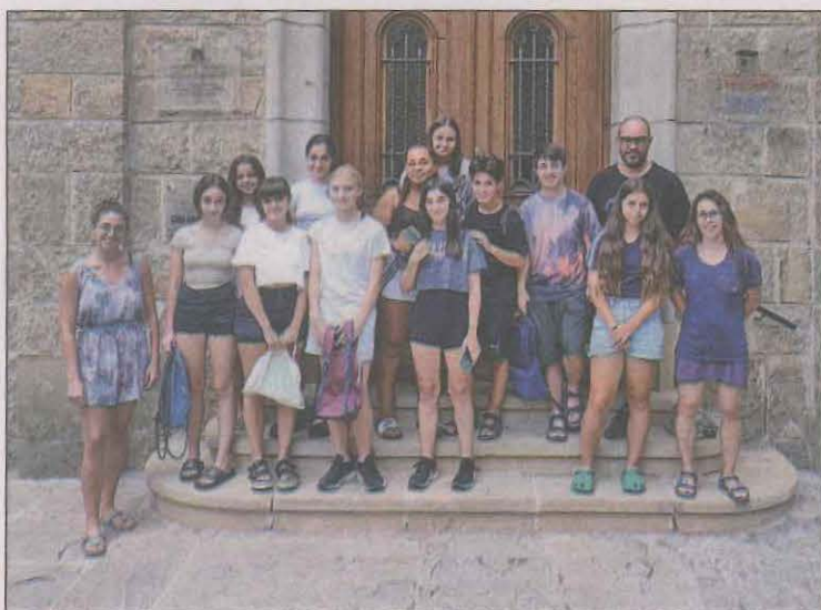
Els joves que han participat a la iniciativa

Fins a 26 joves de la Pobla de Segur han participat aquest mes de juliol al camp de treball local, organitzat per l'Ajuntament de la Pobla de Segur. La novetat d'aquest any, especialment celebrada, ha sigut el retorn a la Residència Nostra Senyora de Ribera. Aquest era un servei que s'oferia habitualment al camp de treball local.