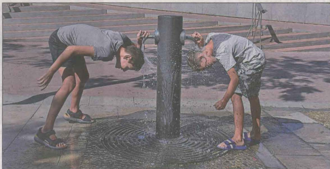
Els lleidatans han hagut de patir una sofocant calor dia i nit el passat juliol

Entre els dies 11 i 25 de juliol del 2022 es va produir una de les onades de calor més persistents mesurades a Catalunya amb més de dues setmanes de calor superior a la normal en plena canícula. La persistència de la massa d'aire càlid provinent del nord d'Àfrica que va dominar la península Ibèrica durant més de dues setmanes, arribant en alguns moments fins i tot a les illes britàniques, és la causa d'un dels períodes més llargs de calor sostinguda que ha viscut Catalunya