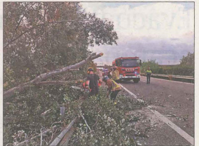
Un arbre va caure ahir sobre la carretera LI-12

de Lleida el fort vent va trencar arbres i algunes finestres i persianes, segons informà la Guàrdia Urbana. La tempesta va ser especialment intensa a l'est del Pallars Jussà. A l'estació de Sant Romà d'Abella es van mesurar 45,2 mm de pluja en 30 minuts i una baixada de temperatura de més de 20 graus en poc més d'una hora. Fins a les 21 hores d'ahir, es van registrar 21 serveis de Bombers a la Regió de Lleida pel temporal. Dijous a la nit es van evacuar 87 persones que estaven acampades a Aramunt. (més info pag.15)