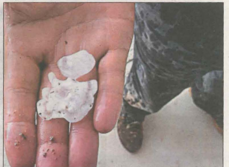
Imatge de pedra que va caure ahir a Alfès