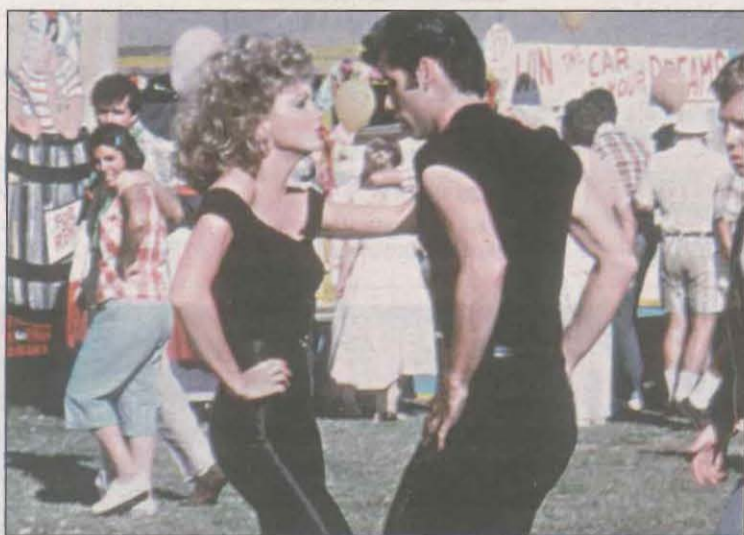
Olivia Newton-John, amb John Travolta, en una escena de 'Grease'