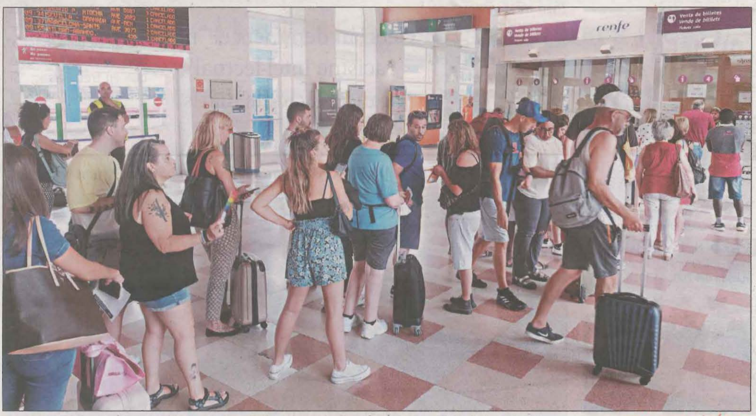
Largas colas de pasajeros indignados en la estación de ferrocarril de Lleida-Pirineus TEMA DEL DIA | PÁG.3-5