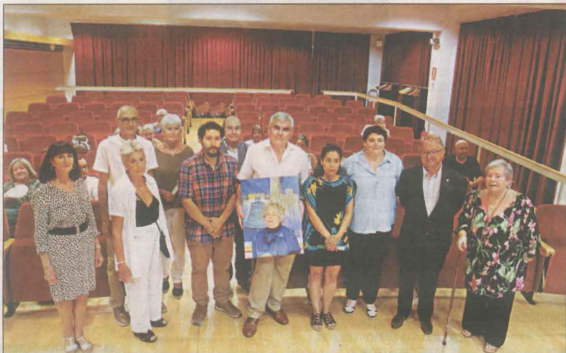
El seminari va donar el tret de sortida ahir a la sala d'actes de la Diputació de Lleida