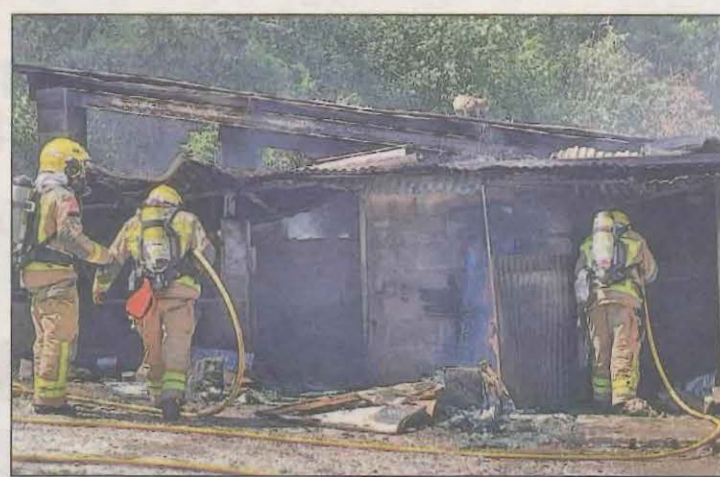
Els efectius dels Bombers apagant el foc de la granja