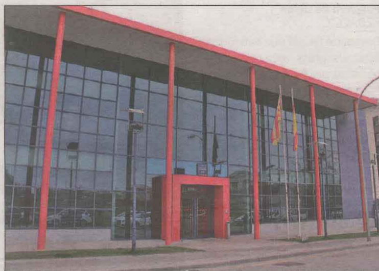
FOTO: ACN / Imatge d'arxiu la comissaria dels Mossos d'Esquadra a Lleida

El Balanç de Criminalitat mostra increments en les diferents tipologies de delictes penals que recull durant el primer semestre d'enguany a Lleida, si es compara amb els mateixos mesos del 2021. En total, l'informe del Ministeri de l'Interior comptabilitza entre gener i juny a la demarcació 10.669 infraccions penals, un 25% respecte a les 8.538 dels primers sis mesos de l'any passat.