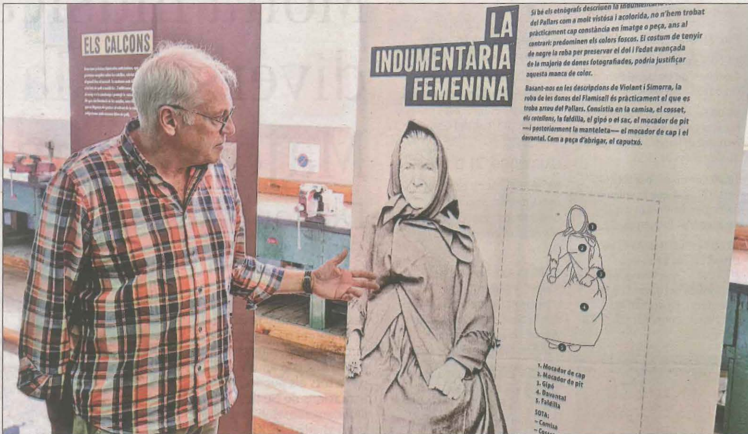
L'exposició, amb el títol "Enfilem l'agulla", recupera peces i vol preservar la cultura popular del Pallars