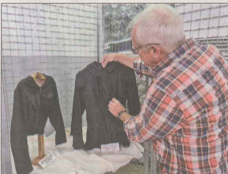
Ha set difícil trobar indumentària d'aquesta època