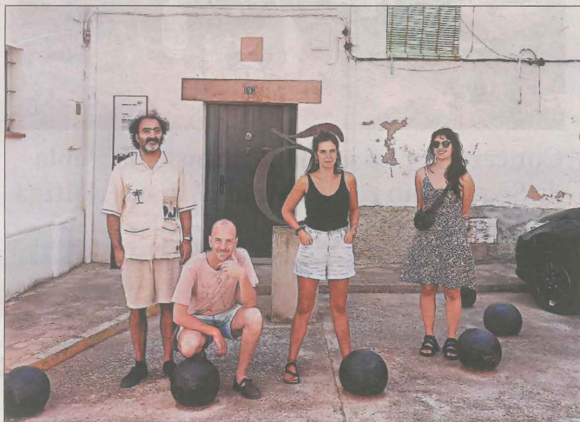
Els quatre artistes participants en aquesta primera residència 'Lo Niu'

Durant la residència, els artistes participants desenvoluparan la seva activitat a Lo Pardal, que es transformarà en un taller on tothom que ho vulgui podrà anar veient l'evolució dels diferents projectes. Està previst que el dia 25 d'agost (19.00 hores) a