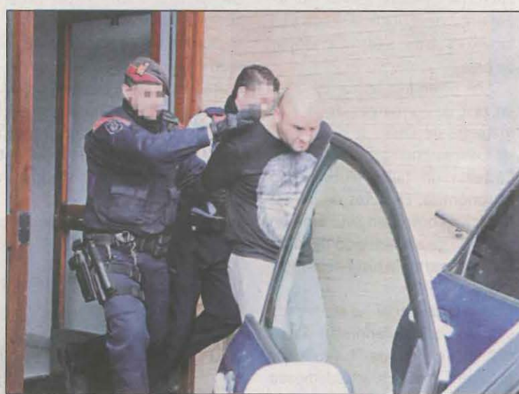
Els Mossos enduent-se el detingut per matar un paleta

"Va rebentar la porta d'accés i la paret de l'habitació on es trobava la víctima, aconseguint ac-