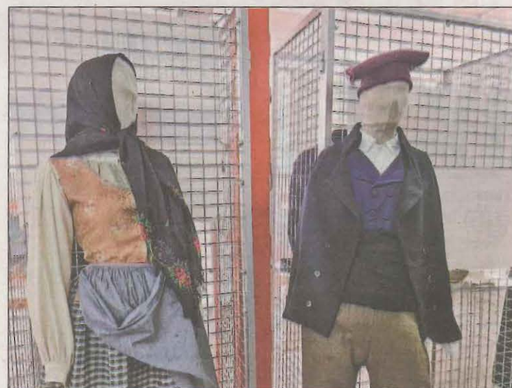
Es mostra el vestit masculí i el femení