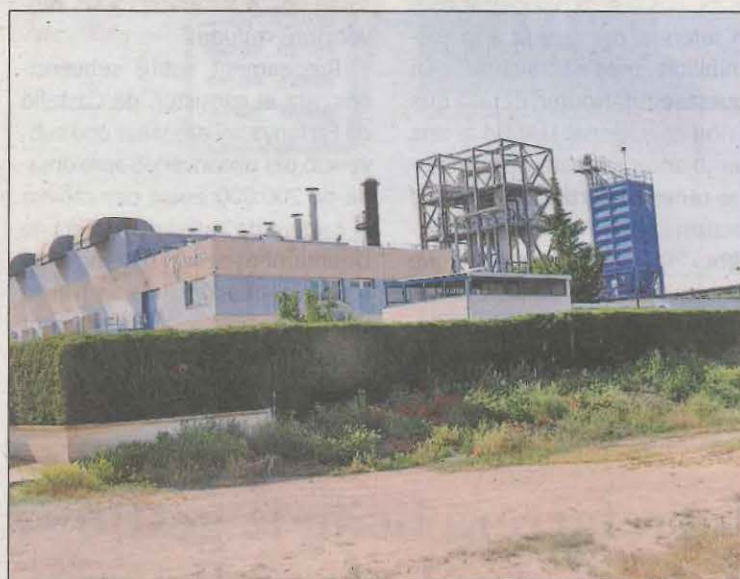
Imatge d'arxiu de la planta de Tracjusa