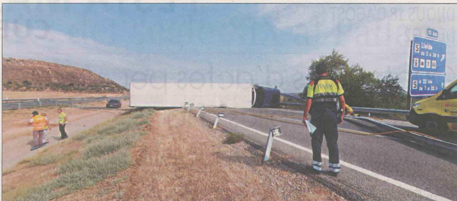
El camió frigorífic va ocupar la via de l'AP-2 en el seu pas per Castellans després de bolcar ahir al matí

Una excursionista va informar ahir a última hora del matí que s'havia accidentat mentre feia una ruta per l'Estanyoleta a València d'Àneu. La noia va dir que s'hauria torçat el turmell mentre es trobava en una zona de difícil accés. D'aquesta manera, els efectius dels Bombers de la Generalitat i els operaris Sistema d'Emergències Mèdiques (SEM) van activar el corresponent protocol i es van mobilitzar fins a la zona on s'havien produït els fets a les 12.15 hores. Un cop allà, amb l'helicòpter dels GRAE van efectuar el recat de la noia en uns quaranta-cinc minuts. Efectuat el rescat, el SEM la va traslladar al centre hospitalari ferida lleu.