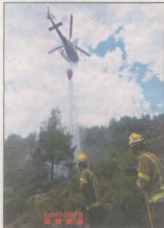
L'helicòpter bombarder apaga el foc a Tremp

Creuen 500 metres quadrats de matolls a Tremp