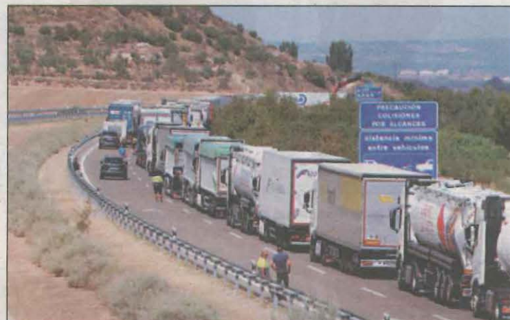
Cua de vehicles a l'AP-2 en sentit Lleida a causa del sinistre

El vehicle circulava en sentit Saragossa i va quedar creuat a la via en sentit Lleida. Els Mossos van haver de desviar el trànsit que es dirigia en direcció a Lleida per l'N-240, ja que l'AP-2 va estar tallada durant més de dues hores. Alguns camions i turismes van quedar atrapats en els 9 quilòmetres de tram que hi havia fins a la sortida 7 de l'N-240, fins que van poder retirar el camió.