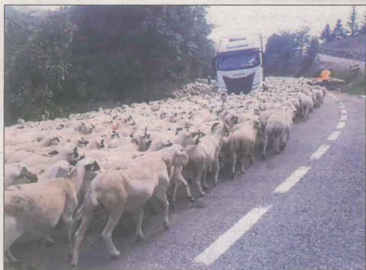
Anaven de Barruera a Areny

Per tot això, des de l'Ajuntament de la Pobla de Segur proposa diverses alternatives al projecte que proposen. En primer lloc, consideren que seria millor que el projecte aprofités les línies ja existents al municipi. Així mateix, defensen que s'han de soterrar aquestes línies i, finalment, defensen que el parc solar es connecti amb la subestació de Tremp, ja que geogràficament és més a prop i requeriria un recorregut de línia més curt.