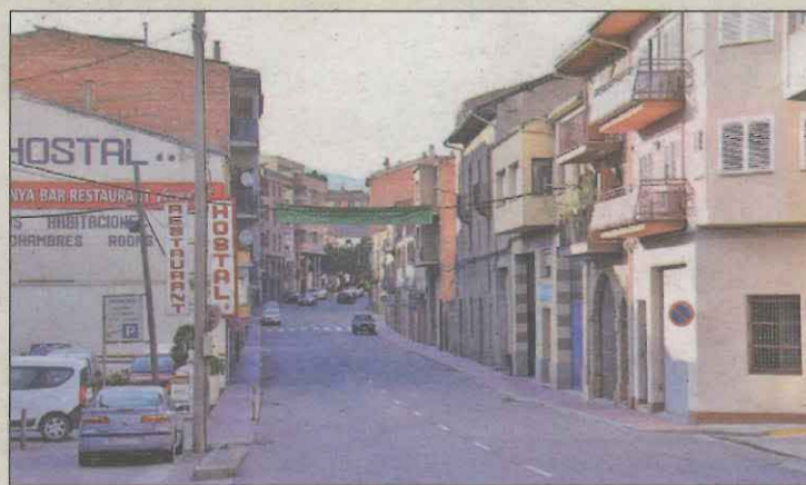
Imatge de la travessera de la C-14 a Artesa de Segre

A Artesa de Segre en aquests moments hi ha un centenar de botigues i empreses diverses de serveis. La Generalitat i l'Ajuntament són conscients de l'impac-