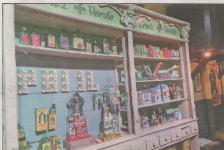
La mostra exposa productes fitosanitaris i insecticides