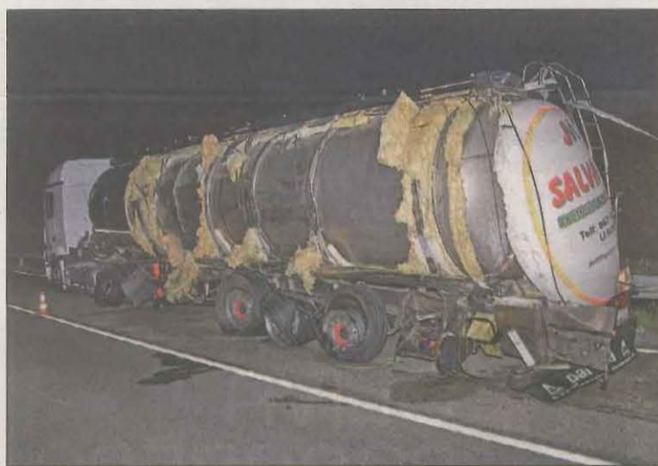
Un dels camions accidentats ahir a Torrebesses

re afectada per una col·lisió frontal, aquest cop a les 15.40 hores a Castell de Mur. Els Bombers es van desplaçar amb quatre dotacions i van haver d'excarcerar un dels ocupants, que havia quedat atrapat a causa del xoc. El SEM va atendre dos ferits lleus i els va evacuar a l'Arnau de Vilanova.