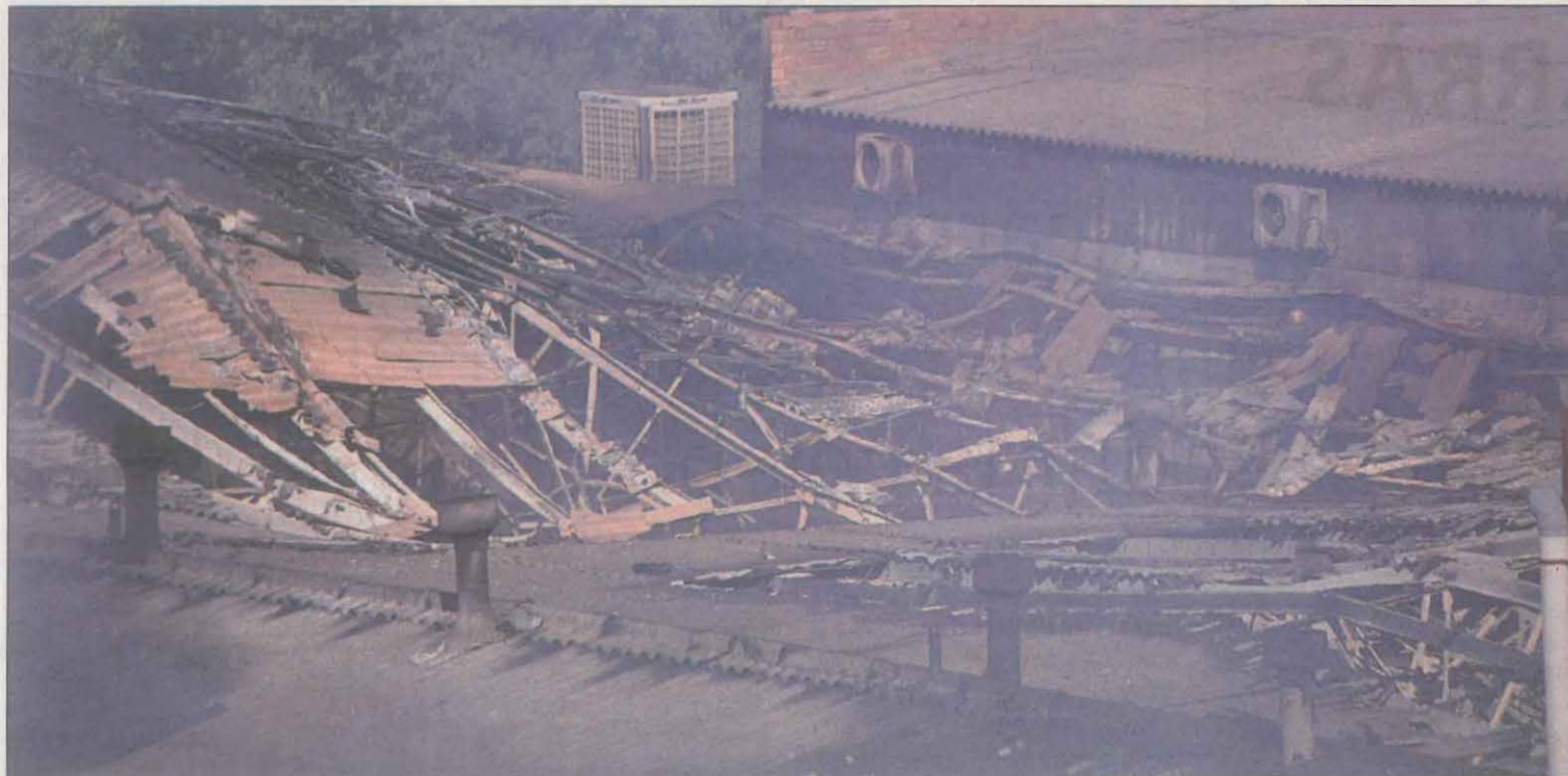
La teulada de la nau afectada principalment per l'incendi va cedir a mitja tarda