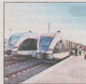
El nuevo convoy, ayer en la estación de Balaguer

EL GERIÁTRICO DE 250 PLAZAS DE GUISSONA, PARA 2023 LLEIDA | PÁG. 19