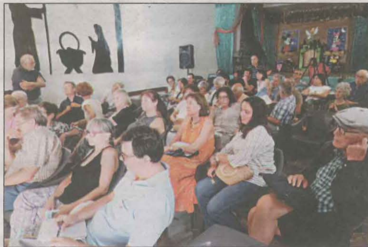
Una de les conferències organitzades a Areny