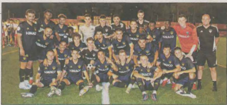
La plantilla, con el trofeo ganado en Manresa

El Lleida Esportiu culminó ayer su preparación para el inicio de la Liga con una victoria ante el Manresa, rival de su misma categoría. ESPORTS | PÁG. 29