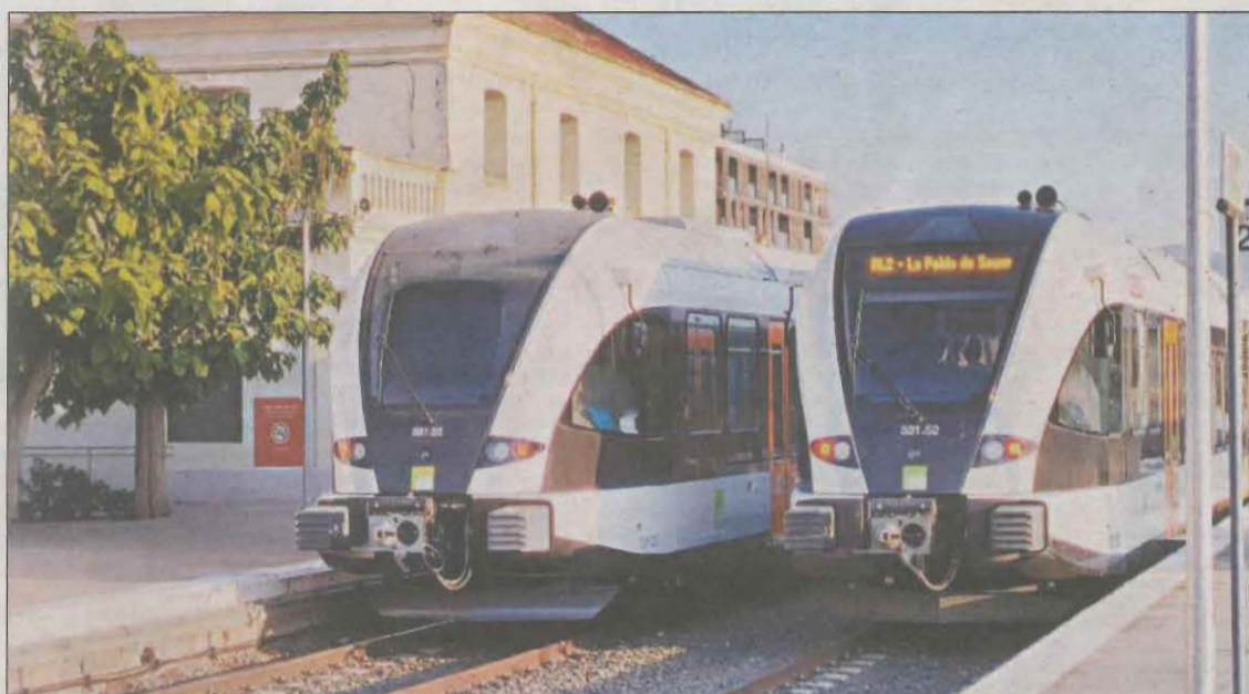
Vista de l'estació de Balaguer, amb els nous trens de la línia

Reforça la disponibilitat del servei i evita els trajectes alternatius per carretera