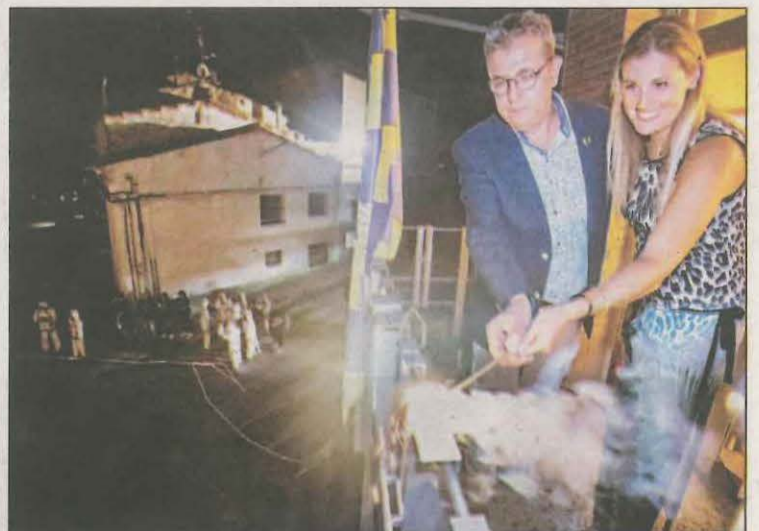
FOTO: Diputació de Lleida / Joan Talarn a la Festa Major de Miralcamp

La Festa Major de Miralcamp continua fins dilluns amb activitats lúdiques, musicals i esportives adreçades a totes les edats.