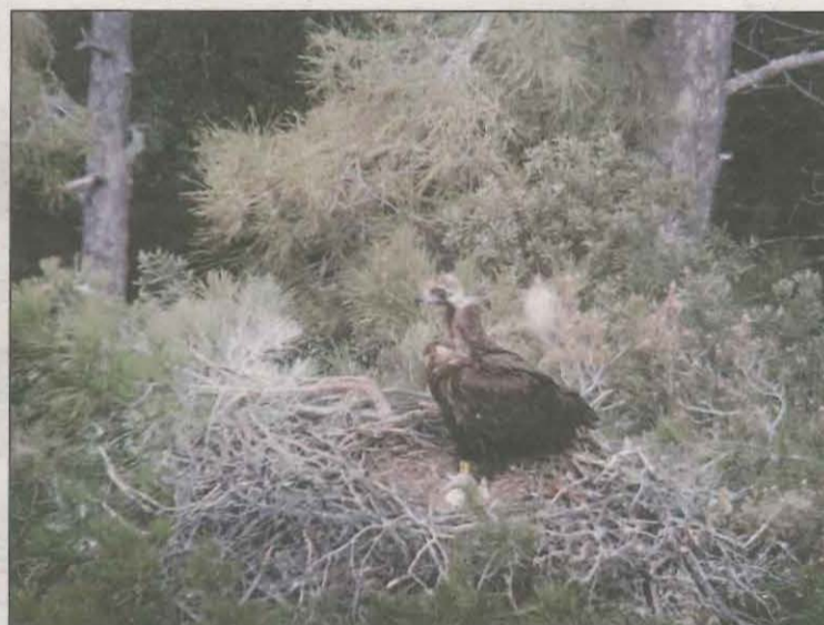
Recentment han nascut 7 cries de voltor negre

De fet, aquest darrer animal, té una població molt més estesa arreu de Catalunya, amb més de 2.000 exemplars, segons dades del Departament de Medi Ambient i Sostenibilitat. El voltor negre encara està molt lluny d'aquestes xifres, però tampoc s'espera que hi arribi, segons