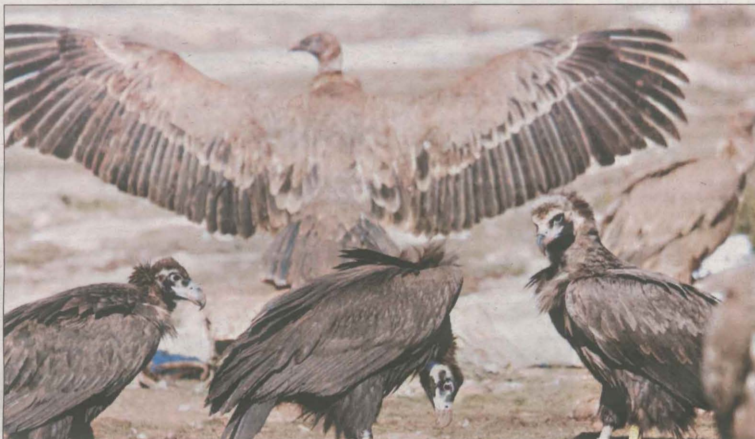
El voltor negre és una espècie que viu principalment a la serra de Boumort, a la comarca del Pallars Jussà