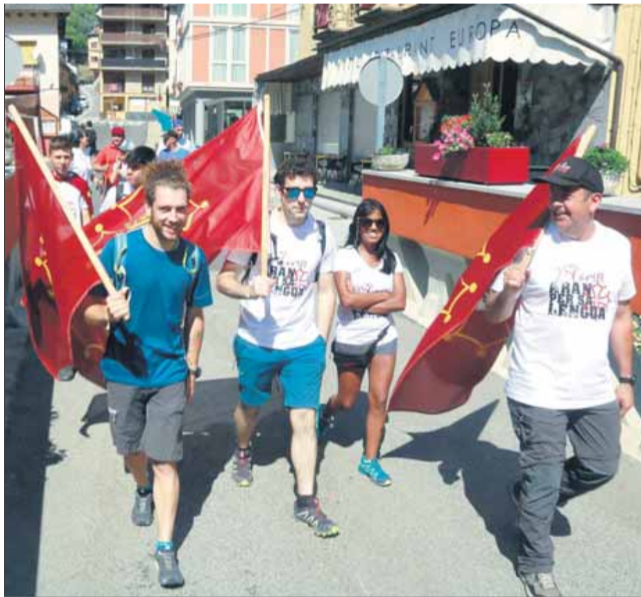
Inici d'una de les marxes que va acabar a Vielha, a la plaça d'Aran

L'edició d'aquest any ha posat l'èmfasi a reivindicar la continuació de l'aranès com a llengua vehicular a l'escola, que des de la Val d'Aran es veu en perill arran de la situació creada per l'aprovació de la Llei 8/2022 sobre l'ús i l'aprenentatge de les llengües oficials en l'ensenyament, aprovada per unanimitat al Parlament i que pretén blindar el català a l'escola davant la sentència del 25%. Tot i que des del govern afirmen que aquesta llei que l'aranès manté el caràcter de llengua vehicular de l'ensenyament, des del Con-