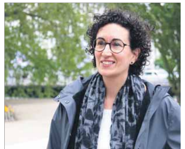
Marta Rovira fotografiada a la ciutat de Ginebra, on va fixar la seva residència en marxar de l'Estat espanyol

En una altra piulada, la líder republicana assegura que són els eurodiputats els que sí que es poden moure amb llibertat per la immunitat de què gaudeixen, i com que ella no ho és no ho pot fer. “Ens teniu al vostre costat perquè aquesta immunitat sigui respectada”, diu Rovira, que aclareix: “No és el meu cas, que no tinc immunitat, i per això visc exiliada fora de la UE.” ■