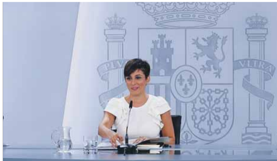
La ministra Isabel Rodríguez (Política Territorial) ha forjat l'acord

Abans de consumir les hostilitats acudint al TC, els dos governs sempre poden afinar les seves discrepàncies sobre una llei i llimar aspors com si es tractés d'un arbitratge per evitar anar a judici. El fòrum