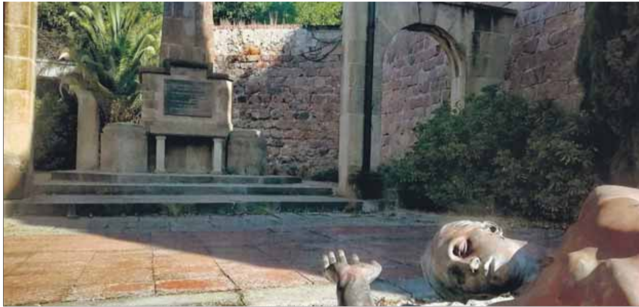
L'escultura que evoca els feixistes afusellats a Montjuïc i, al fons, l'altar i l'obelisc

L'actuació d'ofici consistirà a recopilar informació a l'Ajuntament i, després d'analitzar-la, emetre un pronunciament. Quan va assumir el