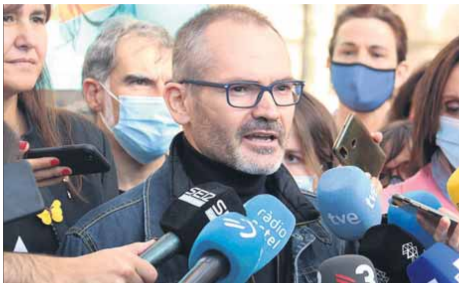
L'exvicepresident primer del Parlament, Josep Costa, després de quedar en llibertat