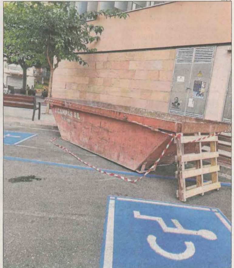
Lavabos col·locats en una de les places per a persones amb mobilitat reduïda i els contenidors fotografiats aquest dilluns a les 20.30 hores.

respecte per evitar que es repeteixi aquesta pràctica "que ens obliga a buscar pàrquing en llocs allunyats i que no són adequats a les nostres necessitats".