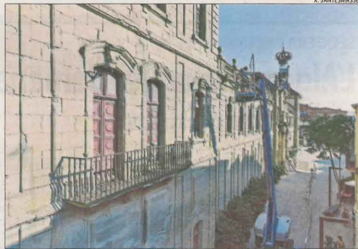
Imatge dels treballs a la façana de la Universitat de Cervera.