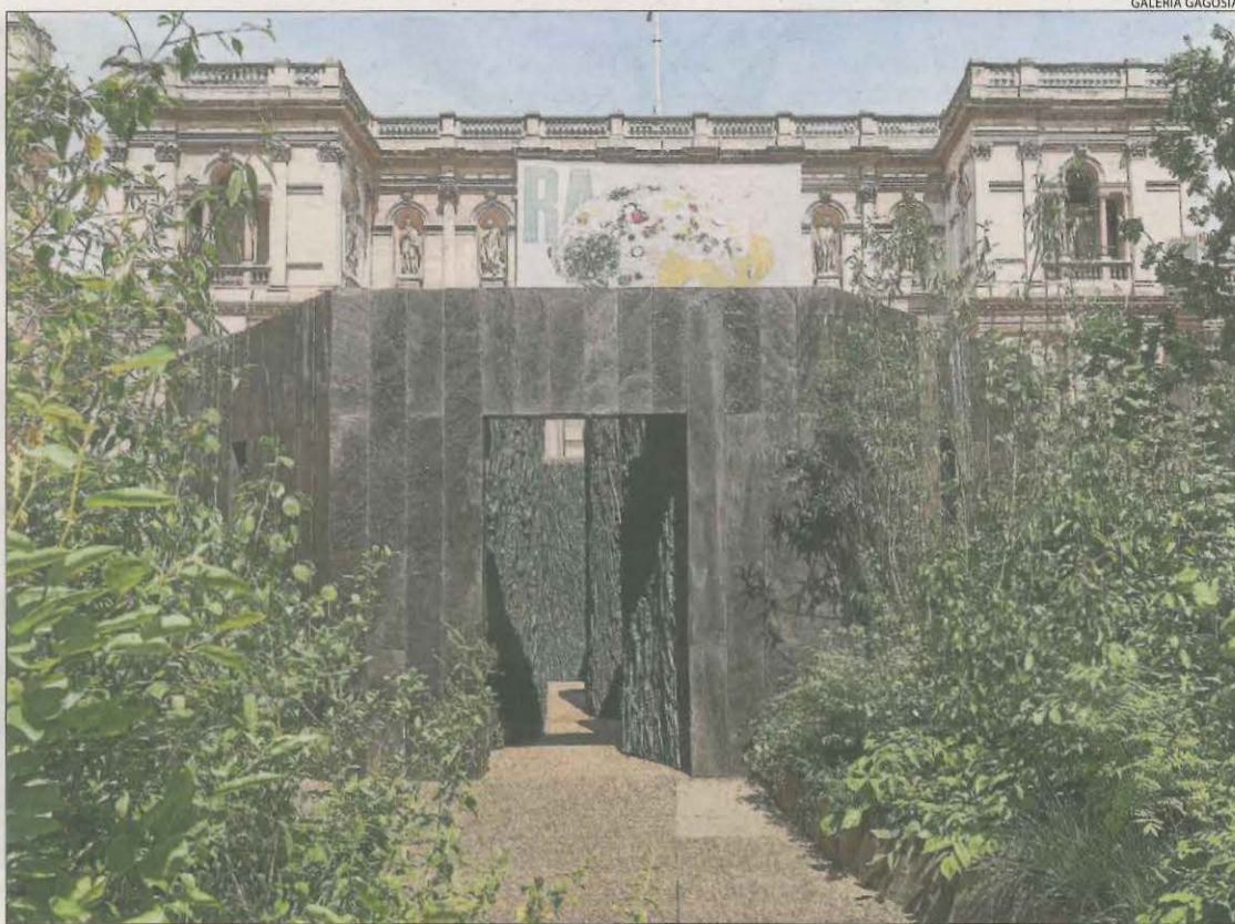
Entrada de la instal·lació 'Wet Labyrinth' de Cristina Iglesias a la Royal Academy of Arts de Londres.

Cristina Iglesias, guardonada amb el premi d'Arquitectura de la Royal Academy of Arts londinenca, és una prestigiosa escultora i gravadora amb una trajectòria de quatre dècades. Va estar casada amb l'escultor madrileny Juan Muñoz, que va morir el 2001 als quaranta-vuit anys. En aquell moment es trobava en exposició l'obra Double Bind a la Tate Modern de Londres. Aquesta instal·lació es va presentar a Espanya l'octubre del 2018 en l'estrena de Planta de Sorigué, on s'exhibeix des d'aleshores.