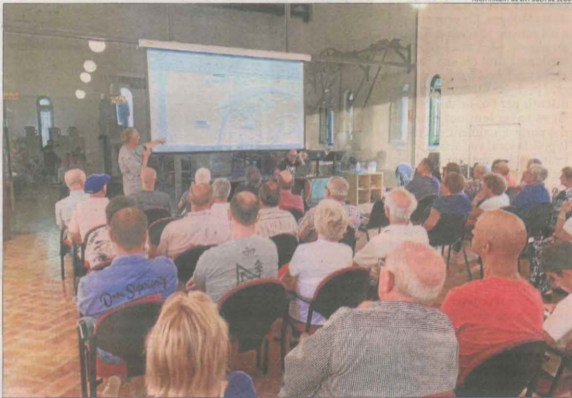
AJUNTAMENT DE LA POBLA DE SEGUR

El concurs per rehabilitar el ferm de la variant de Cervera, amb un pressupost d'11,89 milions, ha rebut sis ofertes. Aquest projecte servirà per refer el malmès carril dret, el greu deteriorament del qual fa que nombrosos conductors evitin circular-hi, com ja va avançar SEGRE. El consell de la Segarra i ajuntaments de la comarca han criticat en reiterades ocasions