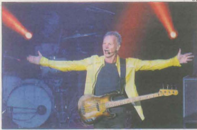
El cantant, dilluns a la nit al festival de Palafrugell.