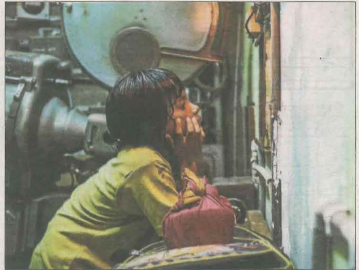
La cinta índia 'La última película' estrenarà avui el Mostremp.

La programació comptarà també amb activitats infantils, tallers de fotografia i de videoclips, taules redones i la recuperació, divendres a la nit, de la Festa del Cinema, un sopar popular a la rambla Doctor Pearson amb productes locals i música en directe de la mà de New Band Experience. El jurat de la secció oficial estarà