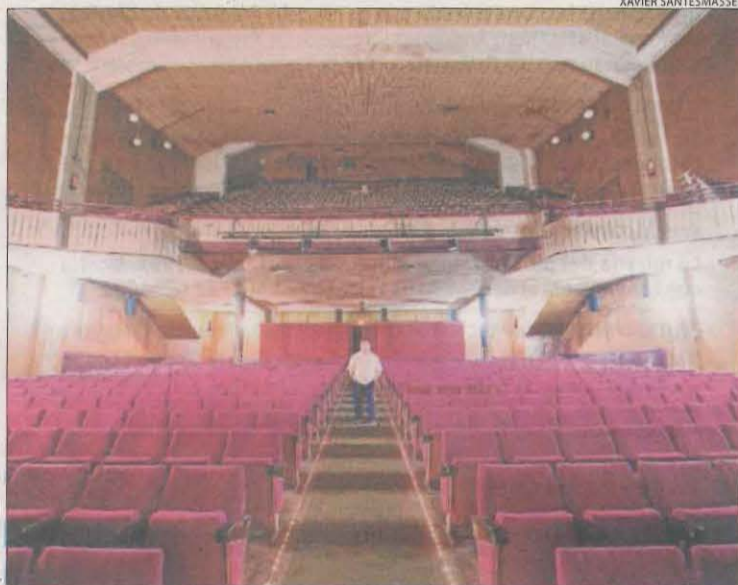
El cine Casal de Cervera va tancar les portes el maig del 2014.

■ Lleida tenia 16 cines el 2020, poc més del 10 per cent dels 137 de tot Catalunya.