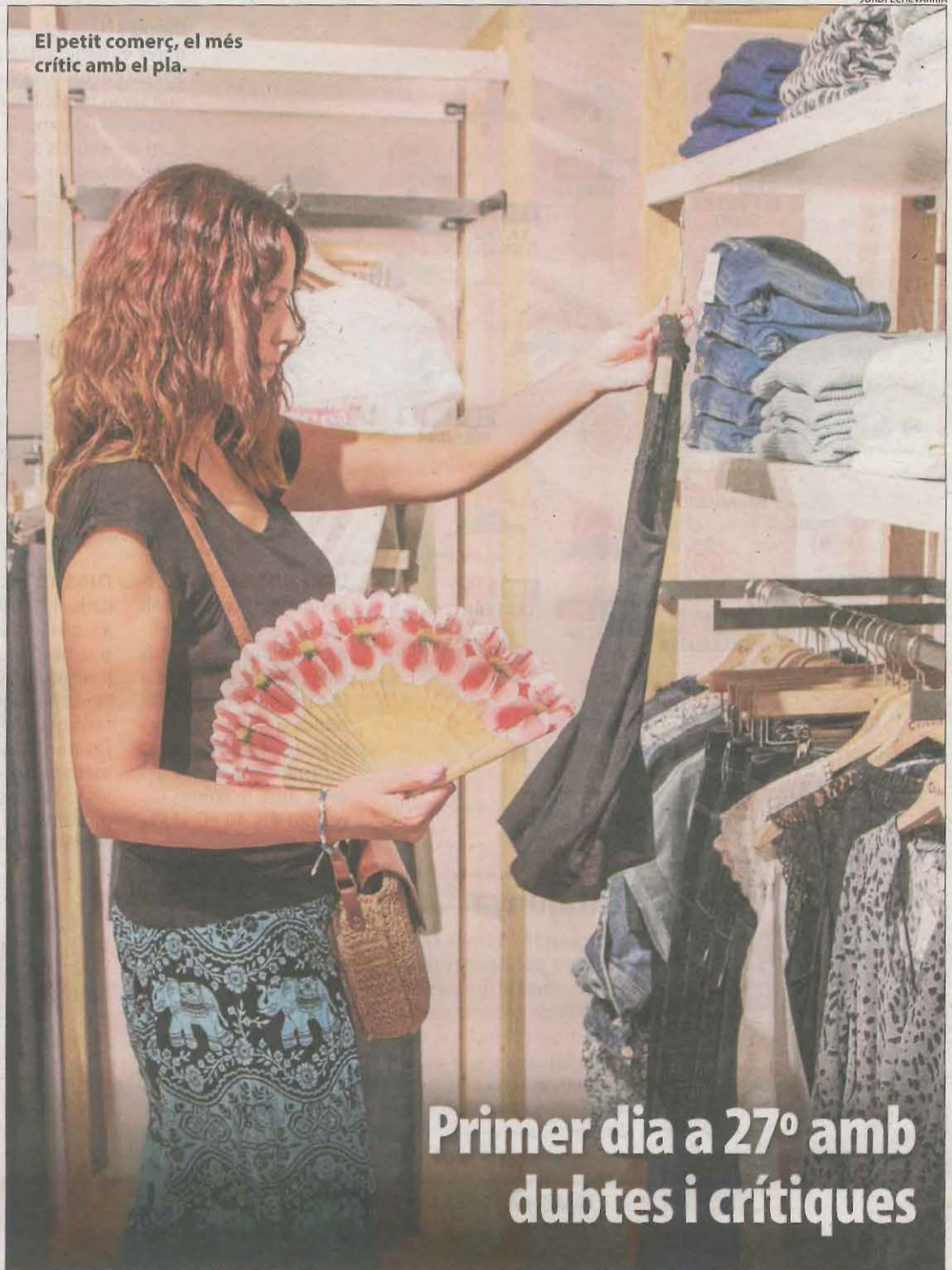
El petit comerç, el més crític amb el pla.