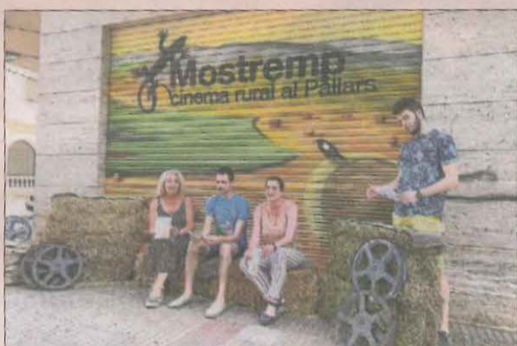
Presentació del festival Mostremp 2022.

El Mostremp 2022 arranca avui a les 18.00 amb un taller de videoclip obert a tothom a l'espai Supo-Supo, a càrrec de la companyia Desoris. A les 20.00, a La Lira es projectaran els cinc primers curtmetratges seleccionats per competir aquest any. Són l'iranià Dor , els espanyols Les altres coses que ens separen , Memory i La Tristeta i el francès Carpenradultes . Els deu títols restants es mostraran entre demà i dissabte, quan se celebrarà l'entrega de premis.