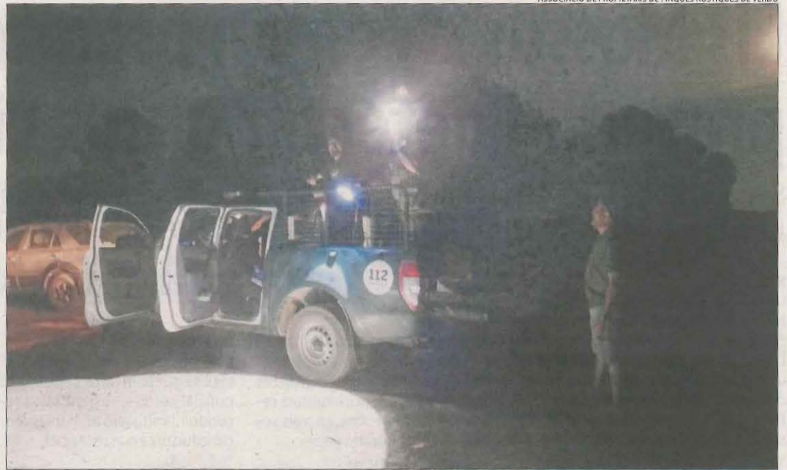
Imatge de la batuda de conills que es va dur a terme la nit de dimarts a dimecres a Verdú.