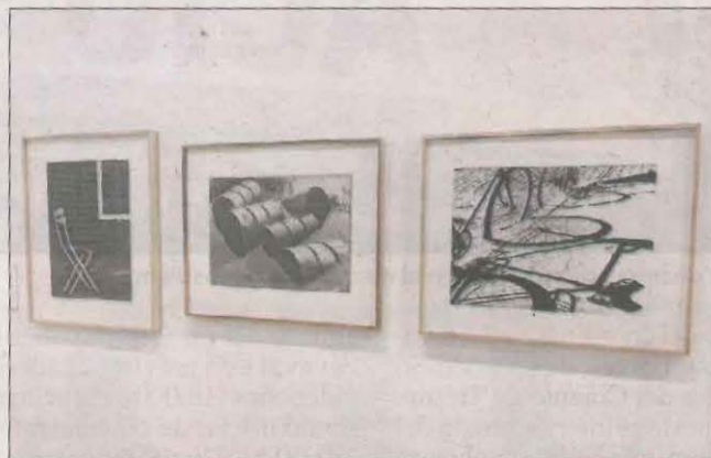
Fotografies de Palmira Puig a l'exposició de Lleida.

In the beggining was... La primera exposició permanent a Europa de l'artista japonesa Chiaru Shiota. Permanent.