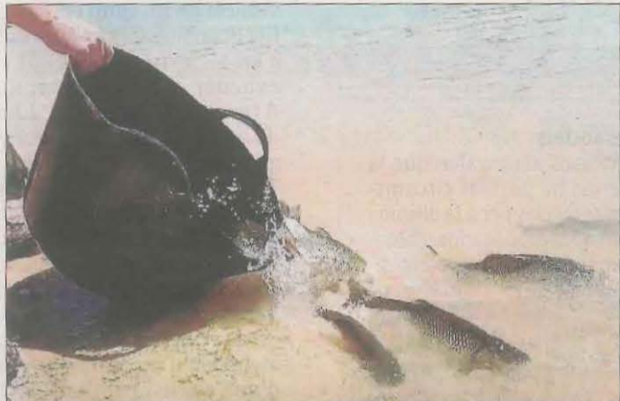
Imatge de l'alliberament d'alguns dels peixos autòctons.