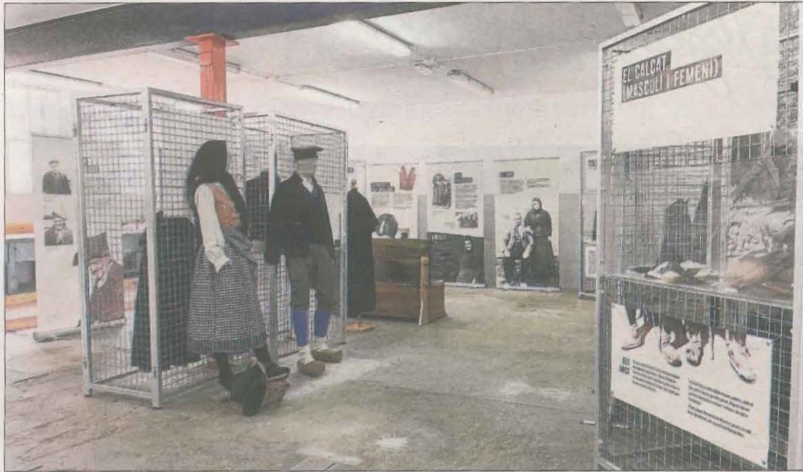
La mostra 'Enfilant l'agulla', a l'edifici del taller de la central hidroelèctrica.