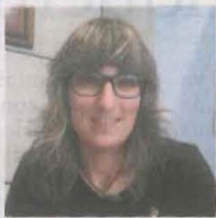
Alcaldesa accidental de Lleida

«L'alt absentisme escolar del Barri Antic es reduirà amb la millora de l'antic col·legi Cervantes»