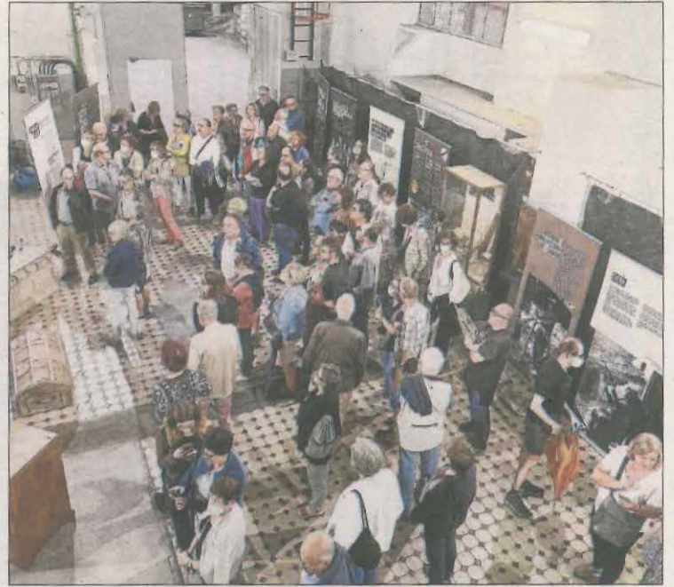
La inauguració de l'exposició, el divendres 5 d'agost.