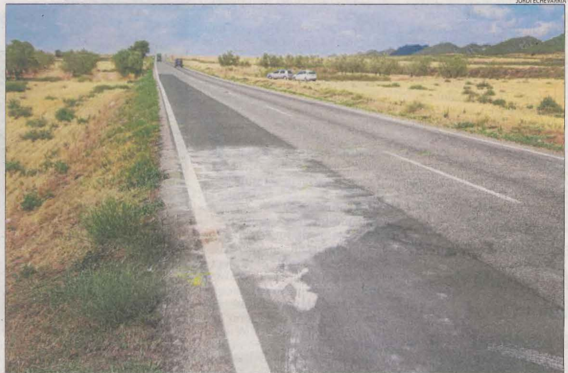
Vista de la carretera C-26 al seu pas per Castelló de Farfanya, on ahir es va produir el xoc mortal.

deu les persones que han perdut la vida en accidents aquest any a les comarques lleidatanes, una xifra inferior a la dels últims anys. Concretament, són deu de morts menys respecte al mateix període del 2021 i tres menys que el 2020, any que va estar marcat per les restriccions de mobilitat derivades de la crisi sanitària de la Covid-19.