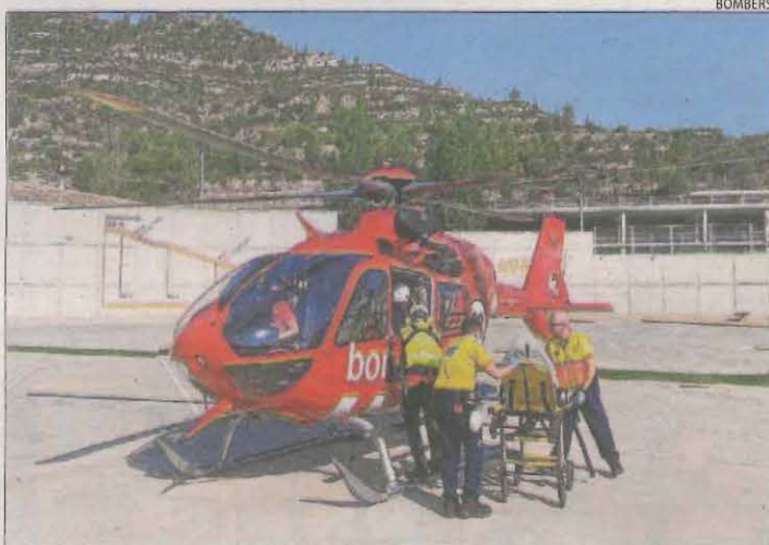
Efectius de Bombers i del SEM, ahir a Barruera.