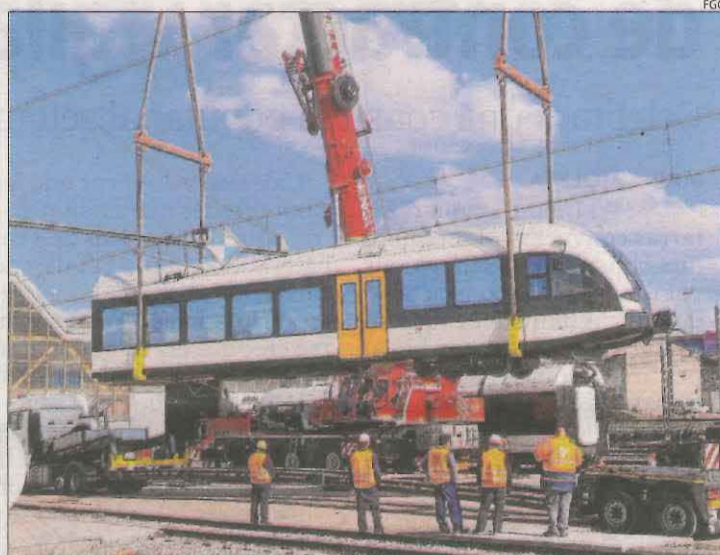
La tercera unitat de la línia va arribar a peces al març a Lleida.

De fet, la pandèmia va retardar-ne també la fabricació. La màquina es va adjudicar a l'empresa suïssa (que va construir també les altres dos) l'any 2019 per 6,4 milions d'euros i es posarà en marxa tres anys després.