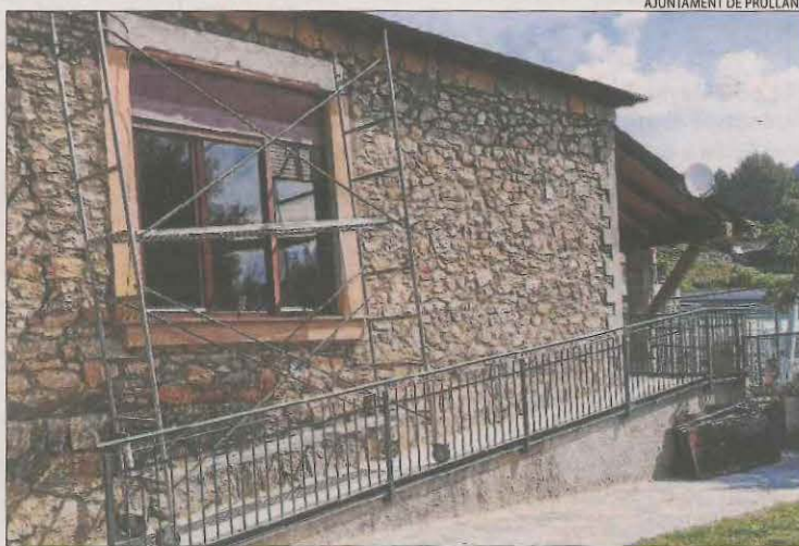
Els treballs per renovar l'escola de Prullans.