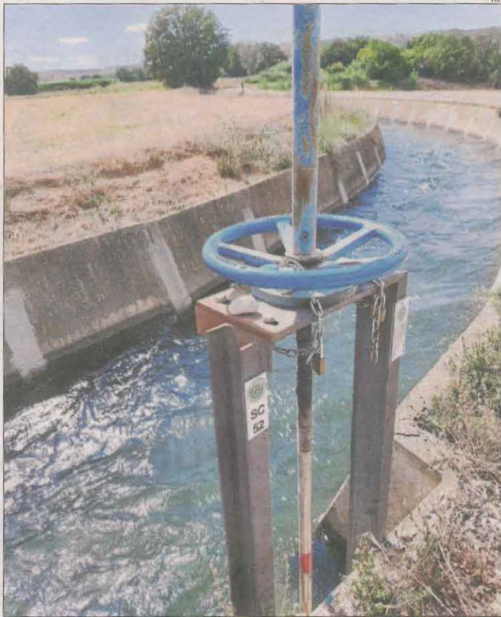
Una de les pales on Pinyana ha col·locat cadenats.

Tampoc no millora la situació a la conca del Segre, en estat d'emergència, ja que el