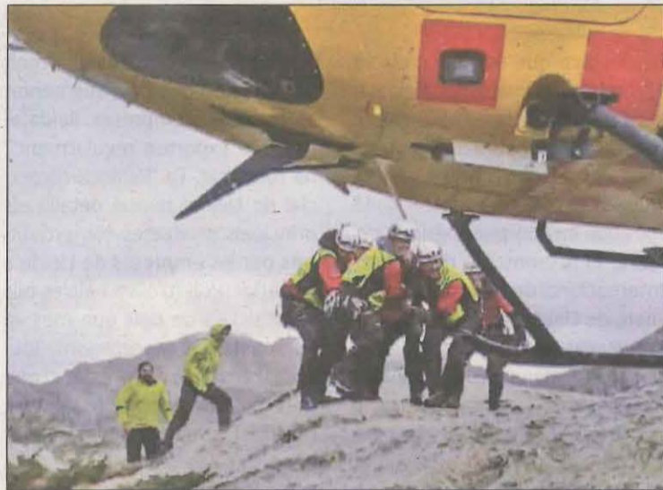
Els efectius de rescat del GRAE evacuant les víctimes

Així, l'helicòpter ha descarregat el personal GRAE i mèdic a l'embassament de Sallente, on també hi van arribar, per terra,