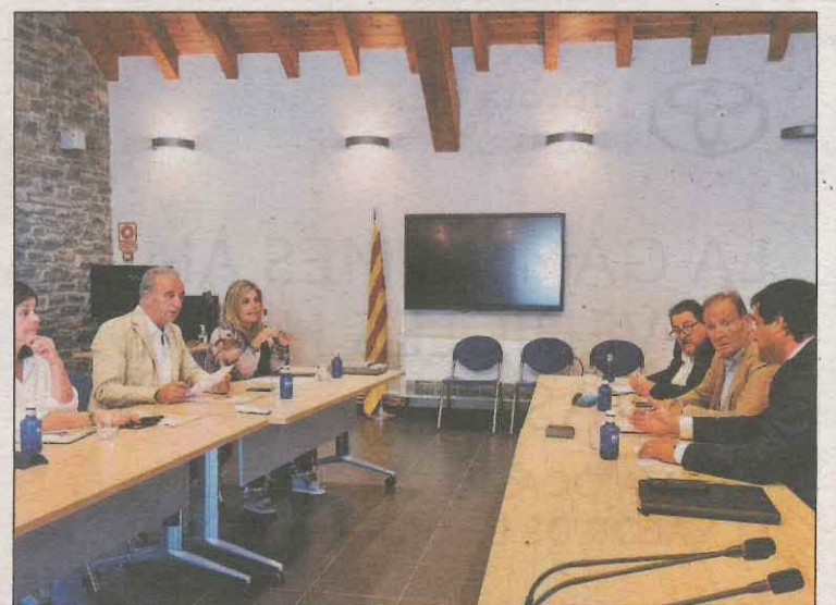
Reunió dels presidents dels consells comarcals i el Conselh