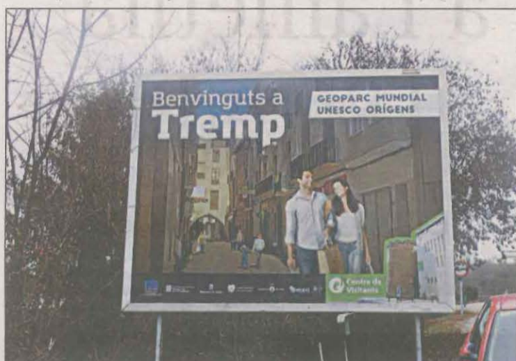
Cartell que anuncia el Geoparc de Tremp

Tremp reunirà del 2 al 4 de novembre quinze Geoparcs provinents de tot l'estat i quatre territoris aspirants per parlar i destacar la importància d'aquesta figura de la UNESCO en el marc de les VII Jornades del Fòrum Espanyol de Geoparcs. La temàtica de les jornades serà "Conservació i Innovació als Geoparcs". Les Jornades Obertes dels Geoparcs espanyols es duen a terme des de l'any 2014. Cada any és un Geoparc mundial de la UNESCO qui s'encarrega d'organitzar les jornades al seu territori amb l'objectiu de donar a conèixer el treball que realitzen els Geoparcs i la repercussió d'aquesta figura de la Unesco en aquestes comarques. Als països que tenen diversos geoparcs, la Xarxa dels Geoparcs