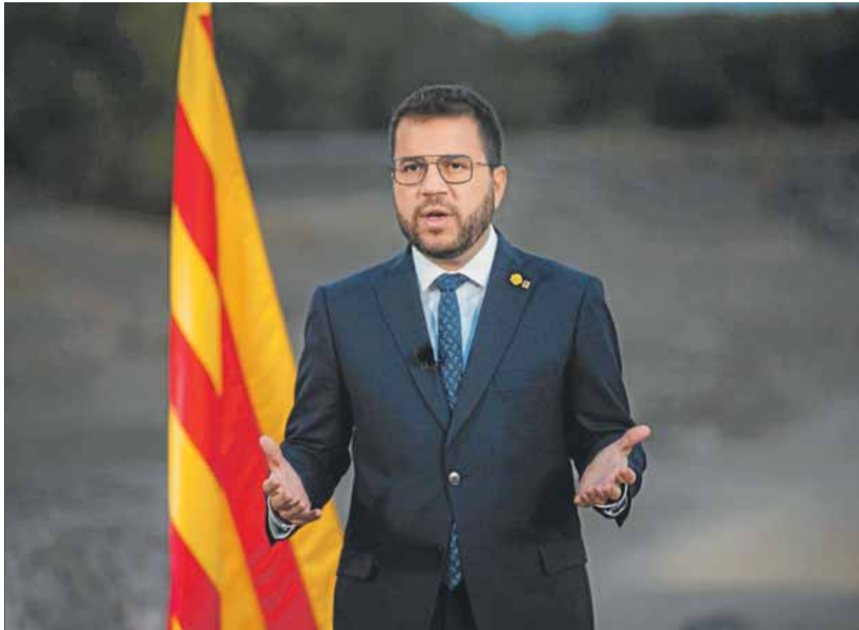
El president Aragonès, durant l'enregistrament del missatge amb motiu de la Diada a les ruïnes d'Empúries

Després d'uns dies convulsos arran de la guerra entre l'ANC i ERC que farà que avui el partit no envii ningú del govern ni de la plana major a la manifes-