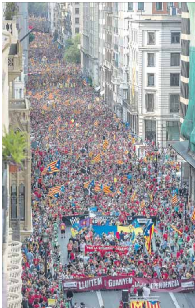
La capçalera de la manifestació de l'any passat

xifres. I podria ser perfectament factible tenint en compte que, la darrera setmana i amb l'esclat de tota la polèmica entre els partits, havien augmentat un 50% les reserves del nombre d'autocars i ja se superaven els 150.