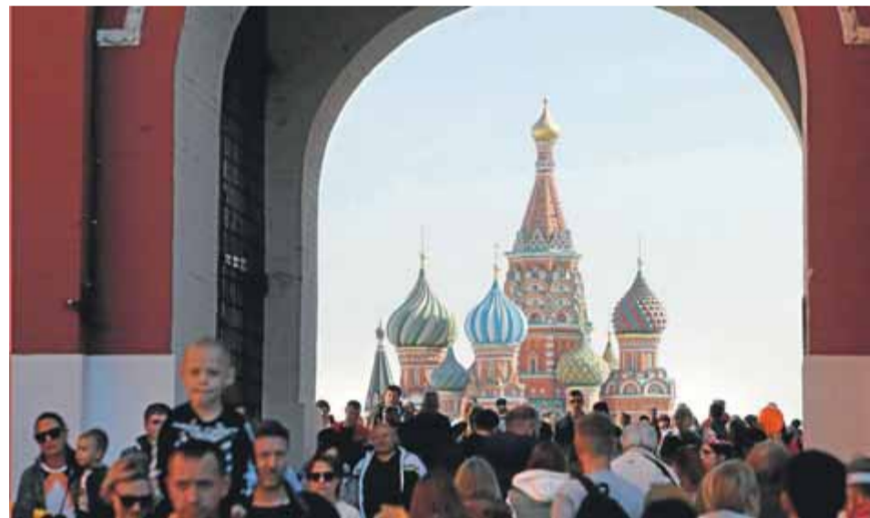
Guerra i pau. Els ciutadans de Moscou celebren els 875 anys de la fundació de la ciutat, mentre l'exèrcit de Putin continua en plena invasió a Ucraïna