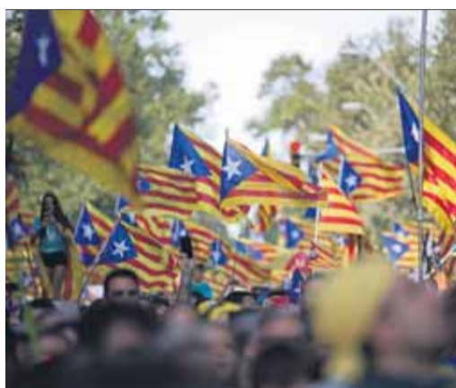
Un estol d'estelades durant una Diada recent

I la repressió no ens fa oblidar –al contrari, fa més evident– que se'ns continua negant el dret a po-