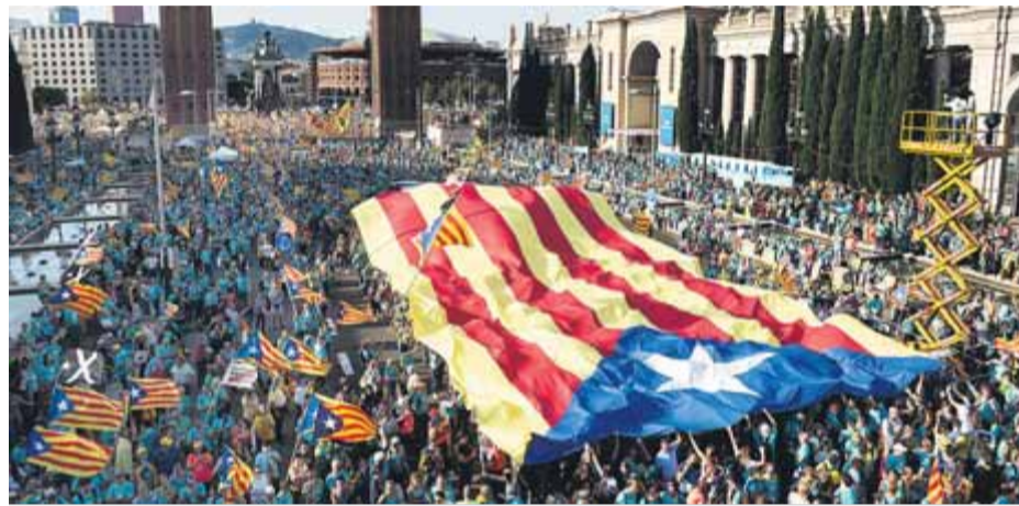
Manifestació de la Diada, el 2019

Enguany, superat –esperem que definitivament– el parèntesi de la pandèmia, la Diada arriba marcada al calendari com una mena de pròleg de la commemoració del cinquè aniversari d'aquell immens exercici d'autodeterminació que va ser el referèndum de l'1 d'Octubre, que ens va mostrar la millor versió que tots, junts, som capaços d'oferir. Un aniversari que no arriba, certament, en un context gaire engrescador si tenim en compte que el principal motor d'aquelles espectaculars manifestacions va ser una unitat que a hores d'ara sembla un miratge.