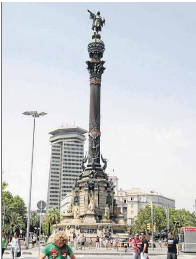
El monument de Colom al front marítim barceloní

El monument de Colom, de 60 metres d'altura, es va inaugurar el