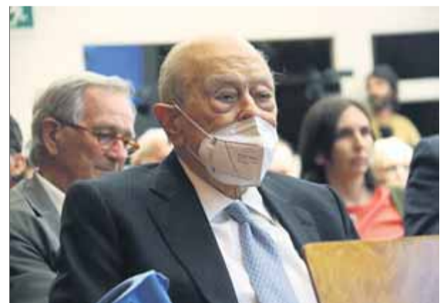
Pujol, en un acte dedicat a Trias Fargas el juliol passat

“És clar que em preocupa [el meu llegat]. He fet coses ben fetes, i fins i tot algunes coses molt ben fetes, però n'hi ha d'altres que no em deixen satisfet”, va assegurar ahir el president Jordi Pujol en una entrevista a El Suplement de Catalunya Ràdio, centrada en la mort de la reina Elisabet II. El dia abans de la Diada, l'exmandatari es va referir a la situació política del país i va assegurar que Catalunya, i també l'Estat, passen per “un moment de crisi política seriosa”, però va valorar que el Principat continuï tenint una “certa capacitat creativa”. “No som un país que hàgim de plorar a la cantonada, continuem sent un país que és