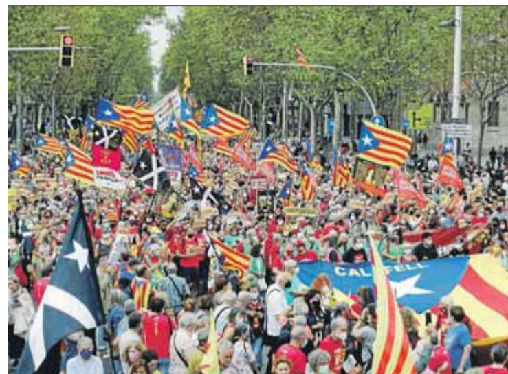
Manifestació el 3-0 de l'any passat, per recuperar l'esperit del 2017 ■ J.R.

Ara mateix tota l'energia popular i mediàtica que es dedica als retrets i a l'autocompassió, al