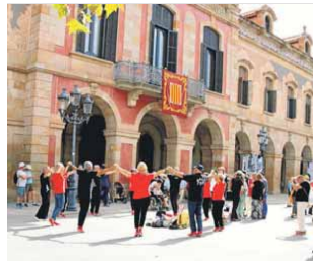
Ballada de sardanes, ahir, davant de la façana del Parlament amb motiu del 90è aniversari de la institució

participació de Borràs i la vicepresidenta amb funcions de presidenta, Alba Vergés, i actuacions musicals de joves talents de l'Esmuc i el conservatori del Liceu. Avui, s'hi han programat actuacions castelleres, de capgrossos, bestiari, gegants, bastoners i balls de grups folklòrics internacionals. ■