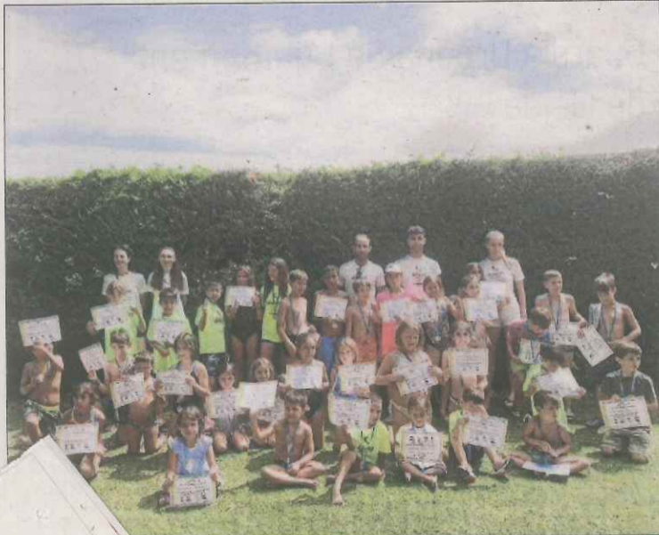
Activitats de lleure als casals d'aquest estiu.