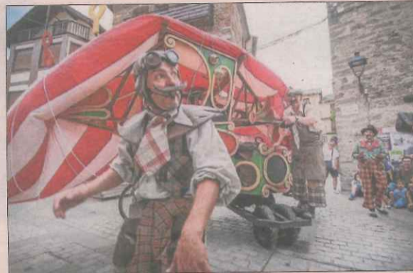
Animació familiar amb 'Zeppelin', de La Baldufa.

La companyia teatral La Baldufa inaugura la festa major de Tremp amb l'espectacle familiar d'animació Zeppelin a la plaça de la Creu, el mateix escenari en el qual, més tard, la Colla d'Escudellers i Escudelleres de Tremp pronunciarà el plegó. La festa es reprèn a les 23.00, amb els concerts de La Jauma Productions, que presenta el seu repertori de rap, la fusió de Sexenni i les versions de Fugint del Silenci a la plaça de Catalunya. Després obren les penyes, al carrer Lleida.