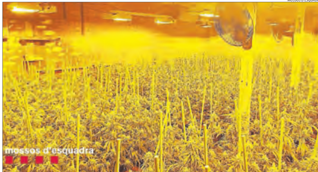
Imatge de la plantació que va ser desmantellada el juny de l'any passat a Camarasa.

L'home, de 40 anys i nascut als Països Baixos, va ser detingut el 16 de juny de l'any passat pels Mossos d'Esquadra com a responsable d'una plantació de marihuana en una nau industrial pròxima al polígon Sant Jordi de Camarasa. El magatzem