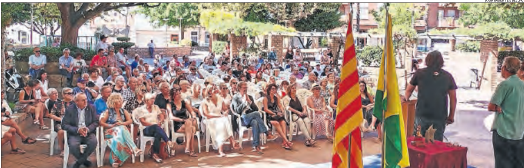
AJUNTAMENT DE BELLPUIG

el penúltim festiu. Avui, a les 18.00, es projectarà la pel·lícula Aline i Cristian Mòdol tancarà les festes amb un concert a la plaça a partir de les 20.30.