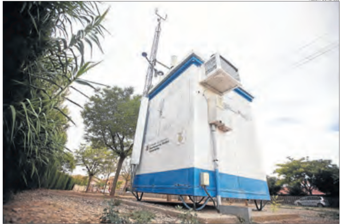
L'estació mesuradora de qualitat ambiental de l'aire ubicada a Juneda.

JUNEDA | La zona del pla de Lleida és la segona de tot Catalunya amb el major nombre d'avisos preventius per contaminació de l'aire. Des de començament d'any, la secretaria d'Acció Climàtica ja ha activat a Ponent quatre d'aquests avisos per la presència excessiva de partícules (cendres, sutge, metalls pesants, ciment o pol·len). El registre d'avisos a Lleida només és inferior al de l'àrea metropolitana de Barcelona, que aquest 2022 ja en suma set. Fonts del Govern argumenten que la posició en el rànquing d'avisos ve donada perquè Lleida és "una zona plana i envoltada pel Montsec, la Segarra i el Montsant, la qual cosa pot provocar més acumulació dels contaminants emesos pels diferents focus en condicions desfavorables". Aquesta és la primera vegada en els últims set anys de registres que aquesta zona de Lleida (que inclou el Segrià, les Garrigues, l'Urgell i el Pla) supera la resta d'àrees de Catalunya, amb les quals fins al moment solia tenir el mateix nombre d'emergències climàtiques. Aquests avisos s'emeten quan a les dos estacions de vigilància atmosfèrica de Lleida capital i Juneda registren una xifra superior als cinquanta micrograms per metre cúbic