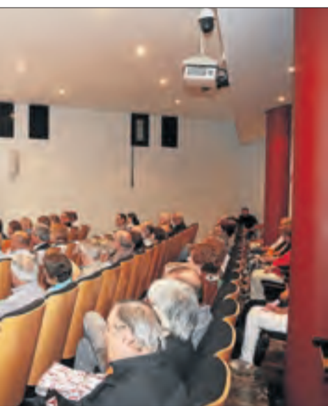
ahir l'acte de la Diada.

món, una Catalunya far de drets i exemple de deures... una Catalunya que avança i, sobretot, una Catalunya que no es resigna i progressa.