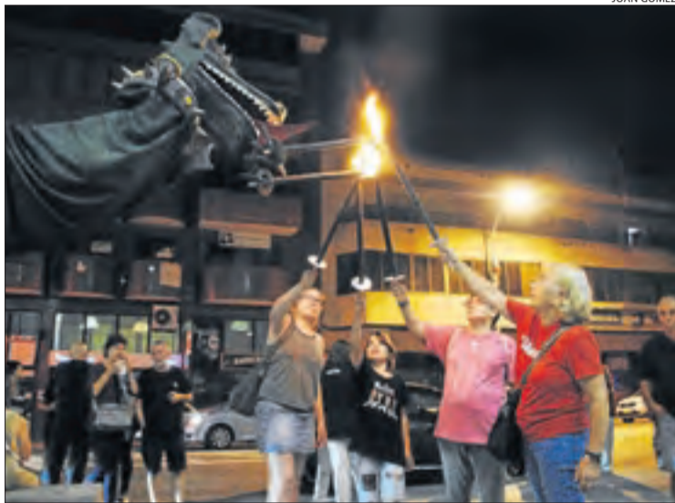
Mollerussa. El drac dels Diables ARF va encendre les torxes.

va subratllar que "les guerres d'exèrcits han estat substituïdes per pressupostos discriminatòris i comunicacions centralistes, tot el que produeix una sibil·lina repressió". Així mateix, Balaguer, Tremp i Torrelameu van celebrar els actes oficials de la Diada. Per la seua part, la CUP va organitzar un debat a les Borges sobre "com encarar el futur del país".