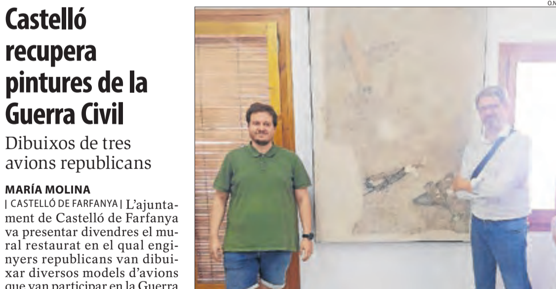
La presentació del mural amb els tres avions republicans.

de partícules contaminants a l'aire, el límit a partir del qual es considera que la qualitat de l'aire és deficient. Recomana reduir l'ús de cotxes, es notifica a les indústries i obres públiques i als ajuntaments que vigilin activitats que generin pols. Es van donar avisos entre el 19 i el 26 de gener i 29 març coincidint amb anticiclons.