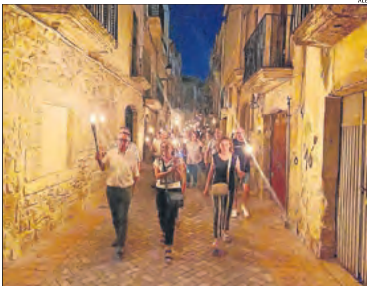
Les Borges. La marxa va recórrer la capital de les Garrigues.