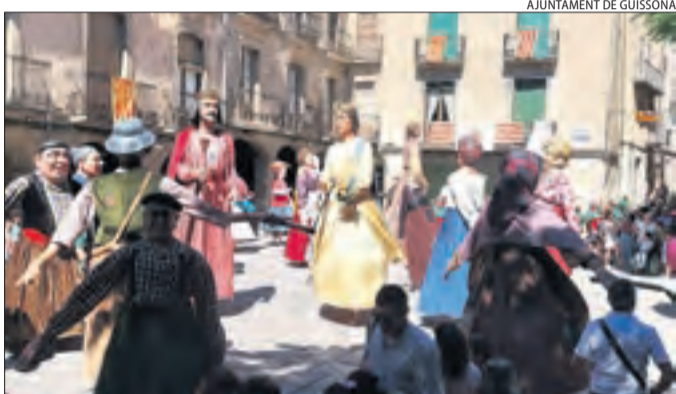
AJUNTAMENT DE GUISSONA

Tremp ■ Els veïns de Tremp van gaudir ahir d'una paellada popular al parc del Pinell en el marc de la festa major. A partir de les 23.00, la música va prendre el protagonisme.