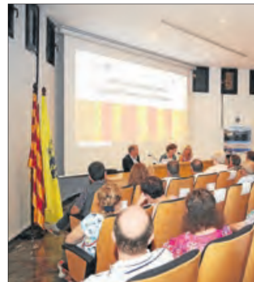
Tremp. La capital del Pallars Jussà va celebrar