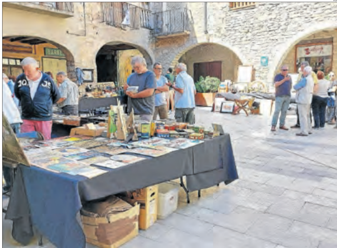
Algunes de les parades de la Diada que es van instal·lar a la plaça de Salàs.