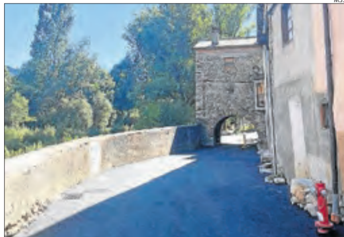
Una de les vies de Vilaller on s'ha renovat el paviment.