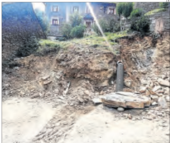
La zona de Llavorsí on l'ajuntament farà el pàrquing.