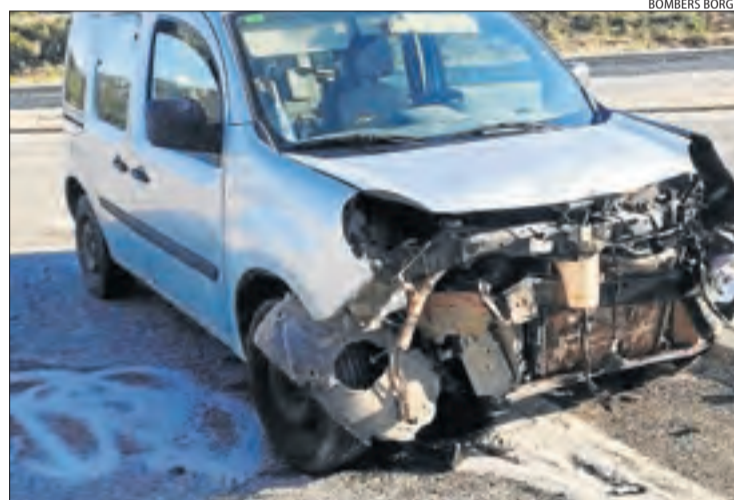
Un dels cotxes implicats en l'accident a l'N-240 a Vinaixa.

D'altra banda, un ciclista va resultar ferit en una caiguda a la C-12 a Menàrguens a les 9.50 hores, segons el SEM. A Vinaixa, a l'N-240, van xocar dos turismes a les 8.58 hores i alguns dels ocupants van resultar ferits de caràcter lleu.