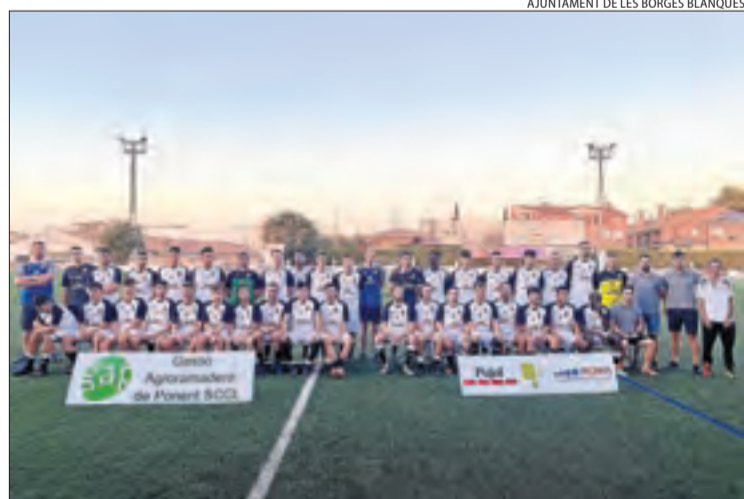
AJUNTAMENT DE LES BORGES BLANQUES