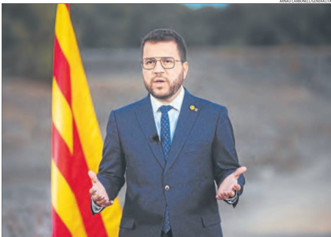
Pere Aragonès va oferir ahir el discurs de la Diada des de les ruïnes d'Empúries.

Aragonès, que va augurar una tardor i un hivern "molt complicats" per l'alça dels preus, va fer una crida a participar en els "diferents actes" de la Diada "cada un d'acord amb les seues pròpies conviccions", però "amb tot l'entusiasme i amb tota la força". Encara que