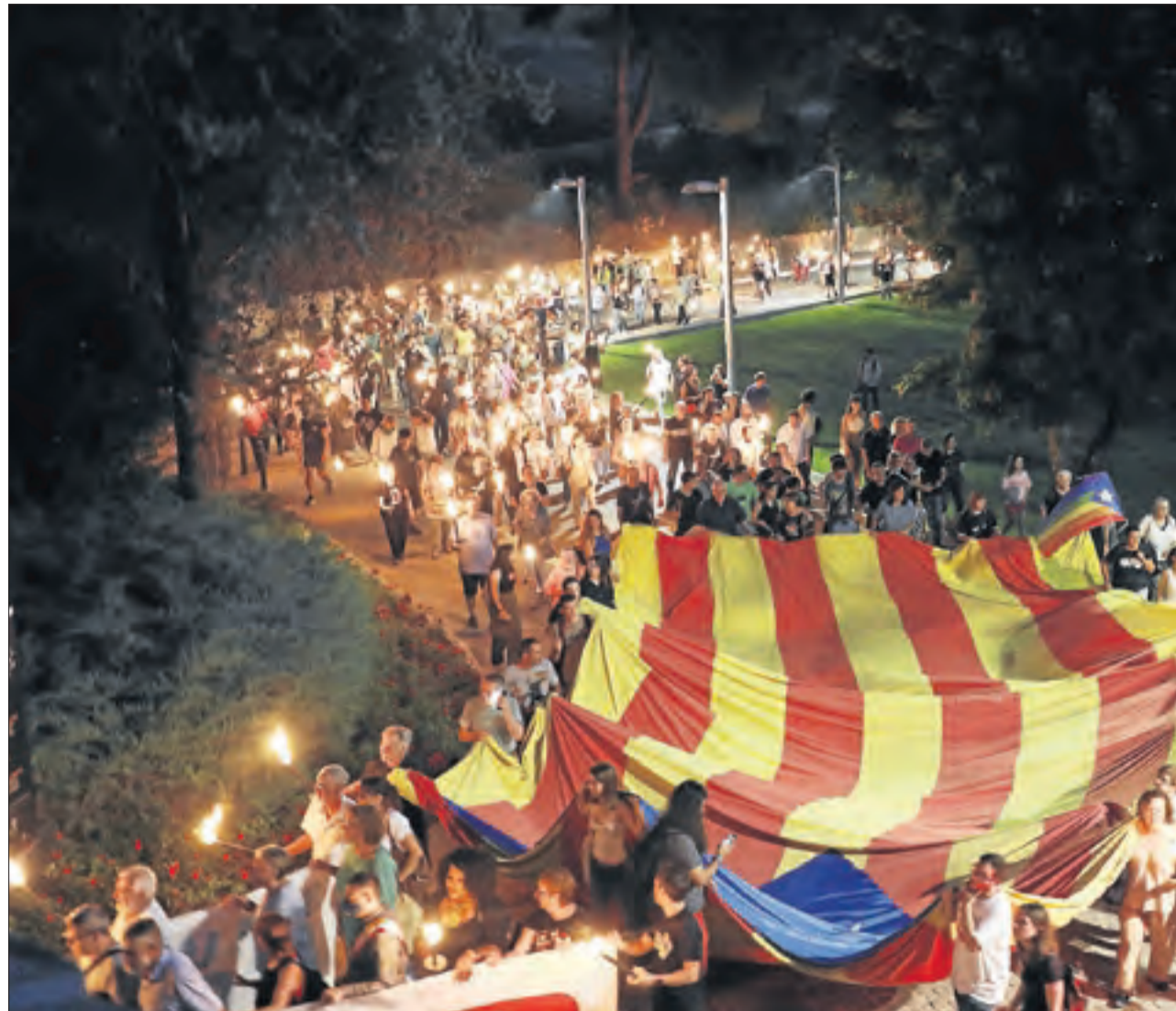
Lleida. La Marxa de Torxes de la ciutat de Lleida va sortir del Roser i va finalitzar a la Seu Vella.