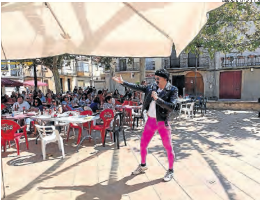
AJUNTAMENT DE CASTELLDANS

Guissona ■ La colla gegantera de Guissona va tornar a celebrar ahir la seua trobada, a la qual van assistir cinc colles procedents de diferents poblacions catalanes.