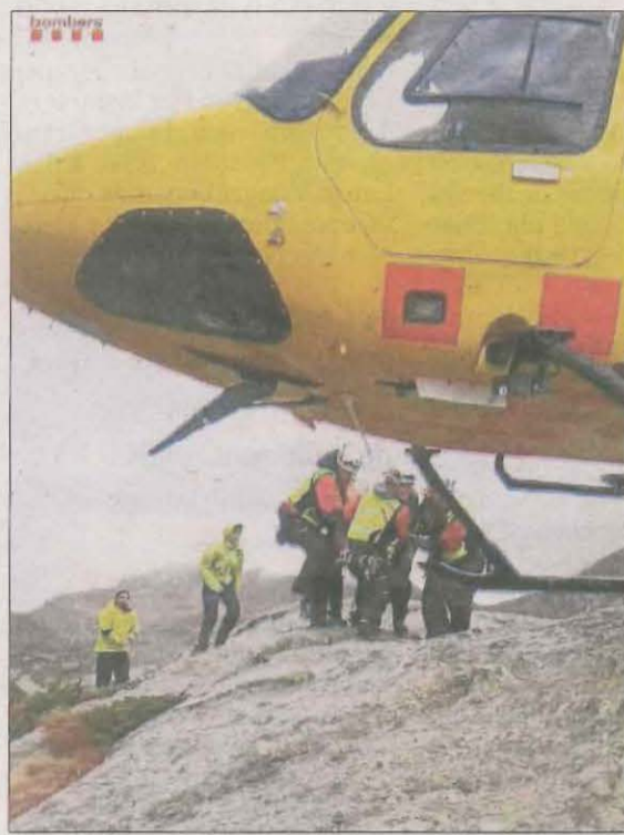
Efectius dels Bombers, durant el rescat ahir dels dos excursionistes a la Vall Fosca.

Una vegada eren amb els excursionistes, un dels pilots va veure que podia baixar amb l'helicòpter, i sense arribar a aterrar, van poder carregar les dos persones a l'aparell per poder ser evacuades a l'hospital del Pallars, a Tremp. La dona va quedar ingressada amb una hipotèrmia moderada i l'home, amb una hipotèrmia lleu. Al principi, els Bombers van valo-