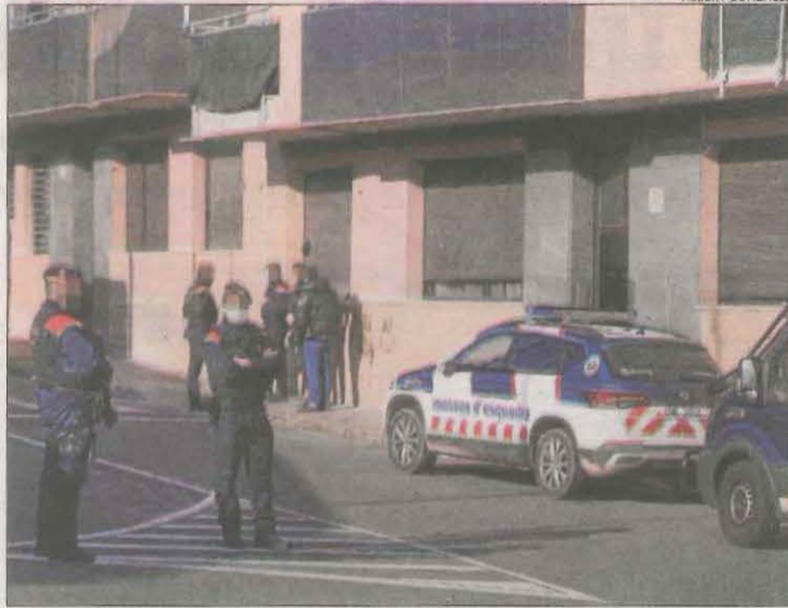
Operació policial recent en pisos del carrer Santiago Rusiñol.