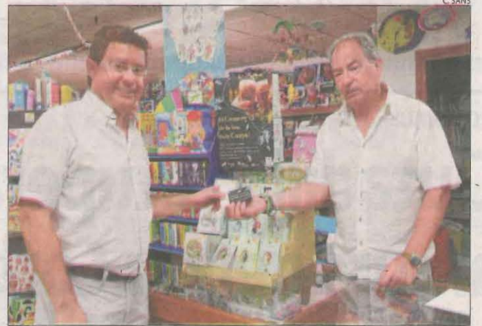
Els comerciants van iniciar la campanya dilluns.