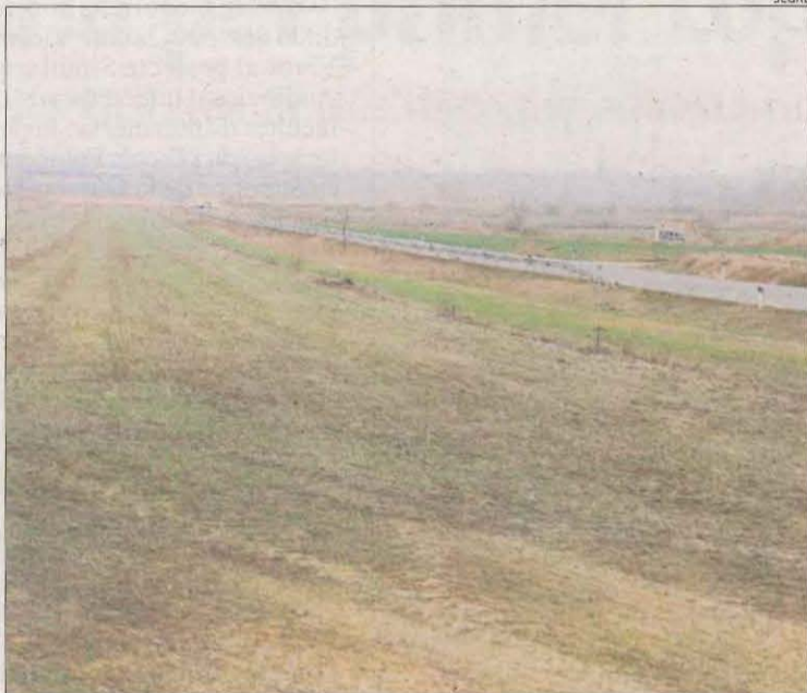
Imatge d'arxiu de part dels terrenys de Torreblanca.

Altres aspectes que subratllen els organitzadors són "l'ecosistema innovador, amb el desenvolupament industrial de l'aeroport d'Alguaire, el parc de Gardeny i diversos centres tecnològics; les infraestructures hidràuliques; la disponibilitat de biomassa; el fet que és la província catalana líder en el sector agrícola i agroalimentari; la seua situació geoestratègica; l'existència de mà d'obra qualificada; i que disposa de bona qualitat de vida.