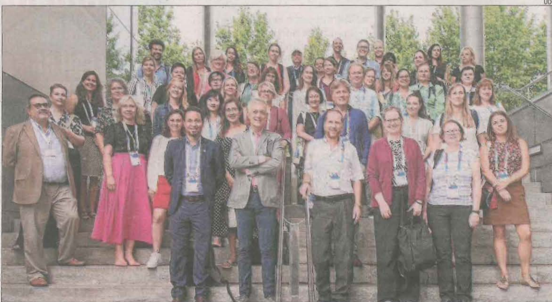
Els experts que van visitar la UdL són d'una quarantena d'universitats d'Europa, Àsia i Amèrica.

La visita forma part de les activitats de la conferència anual de la European Association for International Education (EAIE), que s'està realitzant a Barcelona.