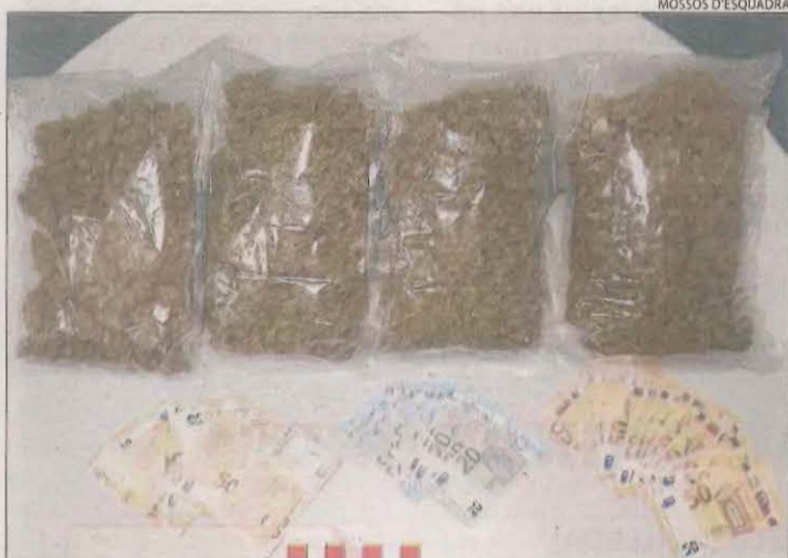
Imatge de la droga i els diners confiscats dilluns.