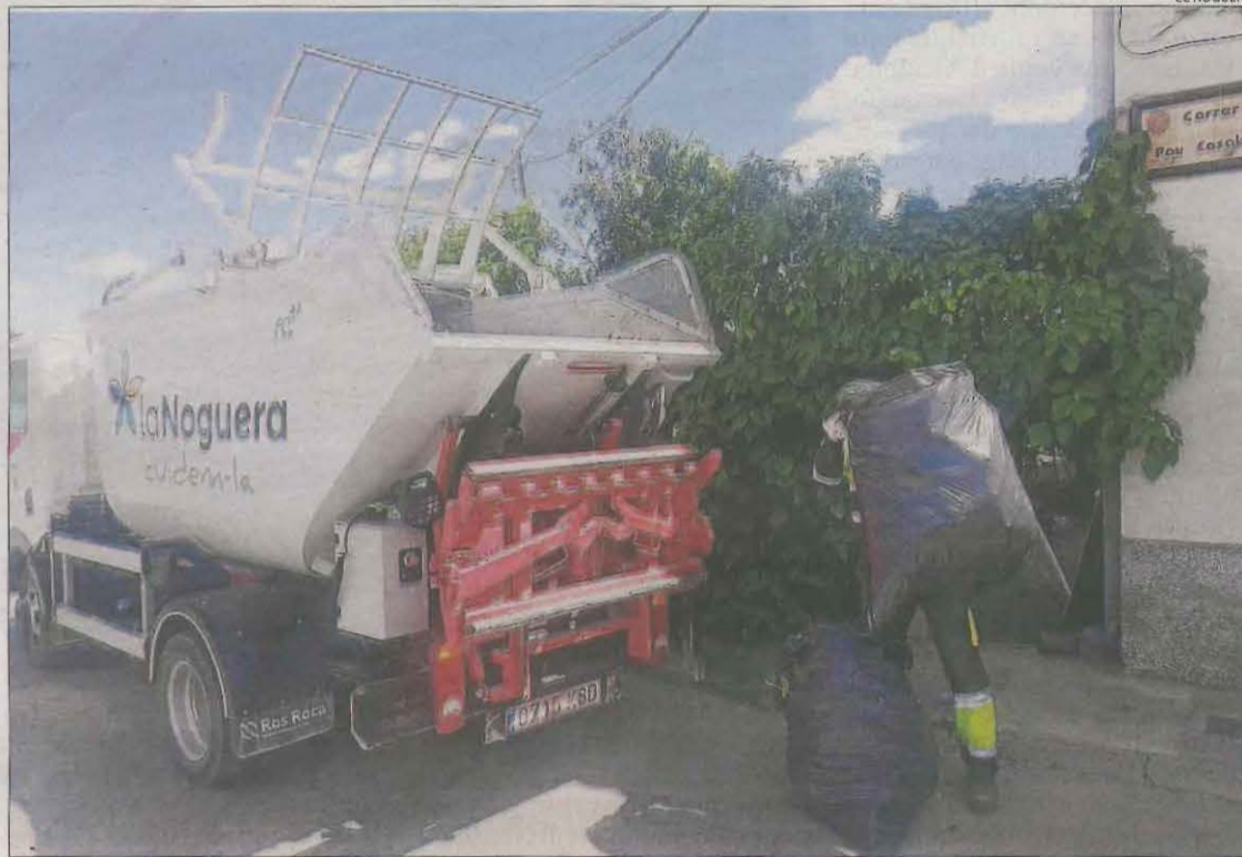
Imatge d'arxiu del servei de recollida de restes vegetals a la Noguera.