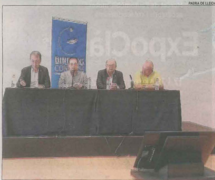
La celebració de la jornada sobre ornitologia a la Llotja.

■ En cas d'infraccions greus, la llei preveu multes des de 2.001 euros fins a 100.000 euros excepte si es tracta de residus perillosos o sòls contaminats. En aquest cas la multa podria arribar als 600.000 euros. En cas d'infraccions greus, la sanció es pot elevar a 3,5 milions.