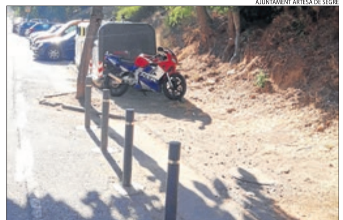
AJUNTAMENT ARTESA DE SEGRE

Pilones de seguretat ■ Artesa ha habilitat pilones de seguretat al costat de l'àrea de contenidors de la carretera de Trepmp per evitar l'estacionament irregular a la voravia.