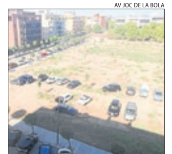
Cotxes aparcats dijous.