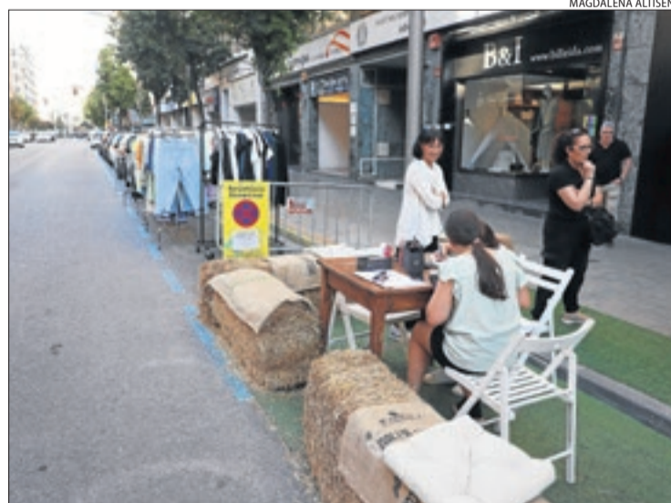
A la Zona Alta hi va haver parades i activitats de lleure.