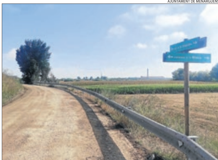
AJUNTAMENT DE MENÀRGUENS

| MENÀRGUENS | L'ajuntament de Menàrguens ha finalitzat aquesta setmana els treballs de millora de diferents camins municipals. Els de la zona del Secà han comptat amb una inversió total de 17.242 euros i s'han finançat amb fons propis, mentre que els camins de l'Horta han costat 39.780 euros, finançats amb ajuts de l'Agència de Residus.