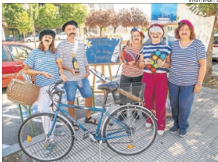
L'EOI va dur a terme ahir diverses activitats davant la seu.