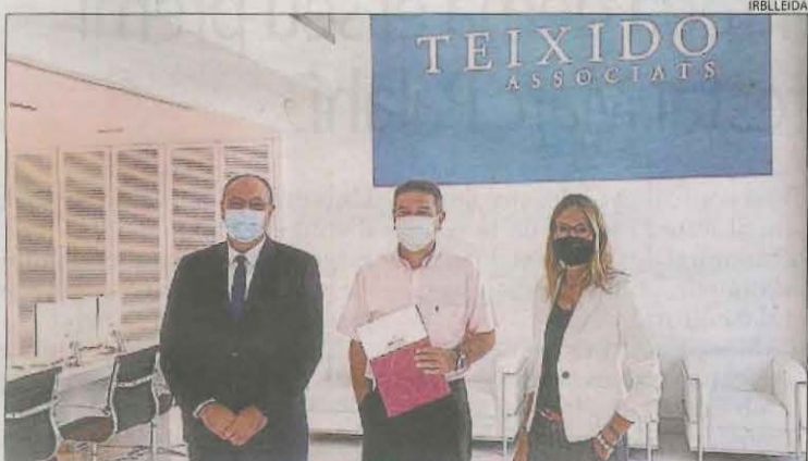
Impuls a la investigació biomèdica ■ L'assessoria Teixidó Associats ha renovat, per segon any consecutiu, la seua col·laboració amb l'Institut de Recerca Biomèdica de Lleida (IRBLleida).