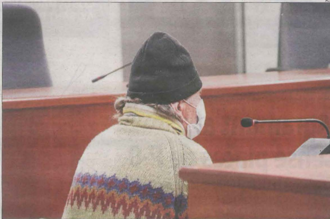
El condemnat, durant el judici celebrat a l'Audiència de Lleida el febrer passat.

Durant el judici, la víctima va relatar que el seu avi havia abusat d'ella quan passava uns dies a la seua casa de Golmés l'estiu del 2018. Va explicar que el seu avi aprofitava els moments en què es quedaven sols per fer-li tocaments. Per la seua part, la mare de la víctima i filla de l'acusat va declarar que es va assabentar dels abusos la tardor del 2019, quan va pressionar la