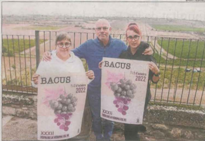
Verdú serà el proper cap de setmana la capital del vi.

de 17 a 22 hores i el diumenge d'11 a 15 hores la divuitena Mostra de Vins de la DO Costers del Segre amb la participació de més de mitja dotzena de cellers, que s'amenitzarà amb l'actuació musical de Perifèrics (dissabte tarda) i de Xènia Páez (diumenge migdia).