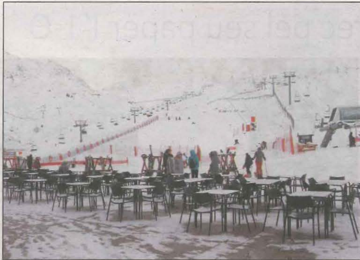
Imatge d'una estació d'esquí al Pirineu

Empreses del Pirineu ofereixen 250 llocs de treball de perfils professionals relacionats amb l'hostaleria, la restauració i el turisme per a la campanya d'hivern. Per això, una vintena de firmes es van desplaçar ahir a Tarragona per participar en una sessió d'entrevistes ràpides per trobar candidats. La finalitat és que el sector empresarial de la Val d'Aran, l'Alt Urgell, l'Alta Ribagorça, el Pallars Jussà i el Pallars Sobirà pugui cobrir les necessitats de personal per a la temporada d'hivern, que començarà al novembre i finalitzarà a la primavera. La sessió es va fer a les instal·lacions de l'Institut Català de Seguretat i Salut Laboral de Tarragona i va comptar amb la participació de 150 perso-