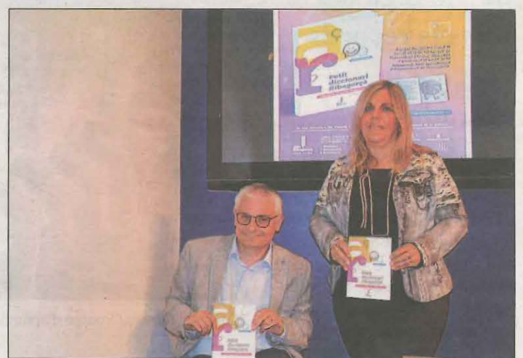
Un moment de la presentació ahir a la Diputació

El llibret recull prop de les 1.300 paraules i expressions del territori que l'Associació Escunç ha anat recopilant al llarg dels anys. L'objectiu és que amb el llibret s'animi la ciutadania a utilitzar-les i a recollir-ne de noves per tal que el diccionari vagi creixent amb noves edicions. En aquest sentit, s'entén que aquest és un document provisional i que es podria arribar a doblar la quantitat de paraules recollides si es manté la